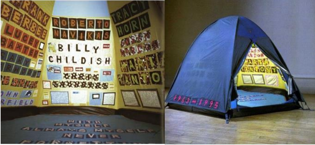
Tablo 9. Tracey Emin, "Everyone I have slept with 1963-1995", Enstelasyon, 1997