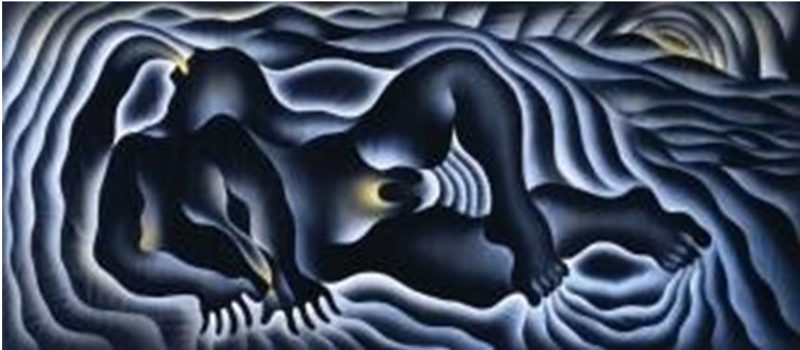
Tablo 6. Judy Chicago, Earth Birth, 1983, Çin Koleksiyonu

Judy Chicago, 1980'den 1985'e kadar Doğum Projesi üzerinde çalışmıştır. Batı sanatında doğum konusunda bir ikonografinin bulunmadığının farkına varan Chicago, ülke çapında yüz elli iğne işçisi ile, Chicago gözetiminde yürütülen, iğne işi için bir