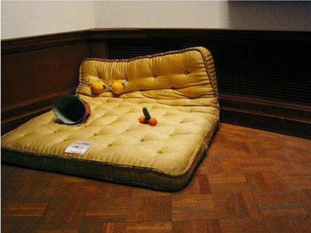
Tablo 10. Sarah Lucas, Doğal (Au Naturel), Enstelasyon, 1994