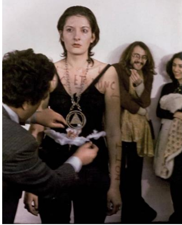
Tablo 2. Marina Abramovic, Ritim 0, 1974, Performans, Stüdyo Mona, Napoli.

Marina Abramovic'in Ritim Serisinin son çalışması Ritim 0'dır. 1974'ün sonunda Napoli'deki Mora Galerisi'nde sahnelenen bu performans, gücü seyircinin ellerine vererek, pasif izleyici arasındaki bölünmeyi gözler önüne sermek ve meydan okumak için kullanmıştır. Abramovic galeri duvarlarından birine, "Ben nesneyim. Bu süre zarfında tüm sorumluluğu alıyorum." diye bir not yapıştırarak seyirciyi haberdar etmiştir (Tablo 2). Abramovic, bu performansın rastgele olarak tanımlanmış altı saatlik süresi boyunca, akşam 8'den sabah 2'ye kadar, vücudunu giderek daha da agresifleşen bir izleyici kitlesinin ellerine emanet ederek kendini bir nesne olarak kullanmıştır.