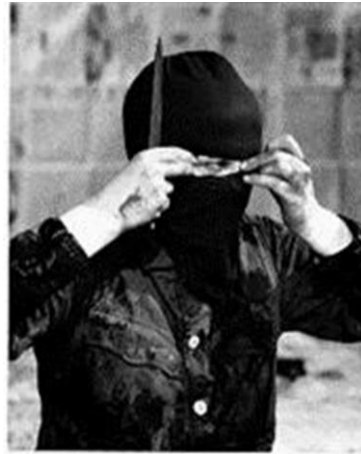
Tablo 4. Mona Hatoum, Variation Discord and Division, Performans, 1984, Vancouver.

Sanatçı bir kovanın içindeki kırmızı renkli su ile gazete kaplı odayı temizlemeye çalışır. Sonra bir sandalyeye oturmak için kalkar ve oradan düşer. Kıyafetinin altından çıkardığı (kendine ait olmayan) böbrekleri keserek tek tek seyirciye dağıtır. Daha sonra kendi yüzündeki siyah çorabı keserek bunu bir özgürleşme imgesi olarak izleyiciye sunar. Bu performans aracılığıyla, sanatçı; sürgün, savaş ve zulüm gibi toplumsal sorunlar üzerinde durmaktadır.