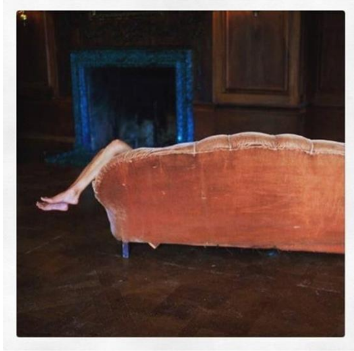
Tablo 7. Nan Goldin, Sansürsüz Sergi, Fotoğraf, Tate Modern, 2019.

Terme doğumlu Şükran Moral yirmi yılı aşkındır İtalya'da yaşayan bir sanatçıdır. İtalyan senatosunda aday gösterilen ilk Türk ünvanına sahiptir. Avrupalı Cumhuriyetçiler'in adayı olarak gösterilmiştir. Sanatçı beden sanatı çalışmaları, performansları ve enstelasyonları ile bu ünvana sahip olmuştur. Moral, kendi vücudunu bir sanat aracı olarak kullandığı Beyoğlu'nda, erkekler hamamına girip yıkandığı video performansları üretmiştir. Şükran Moral yaptığı işlerde provokasyonu, rahatsız etmeyi ve bu yolla düşündürmeyi amaçlamaktadır.