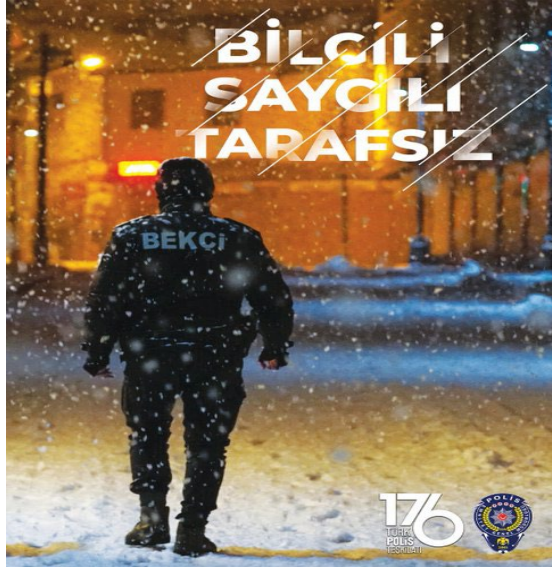
Görsel 1: Çarşı ve Mahalle Bekçisi