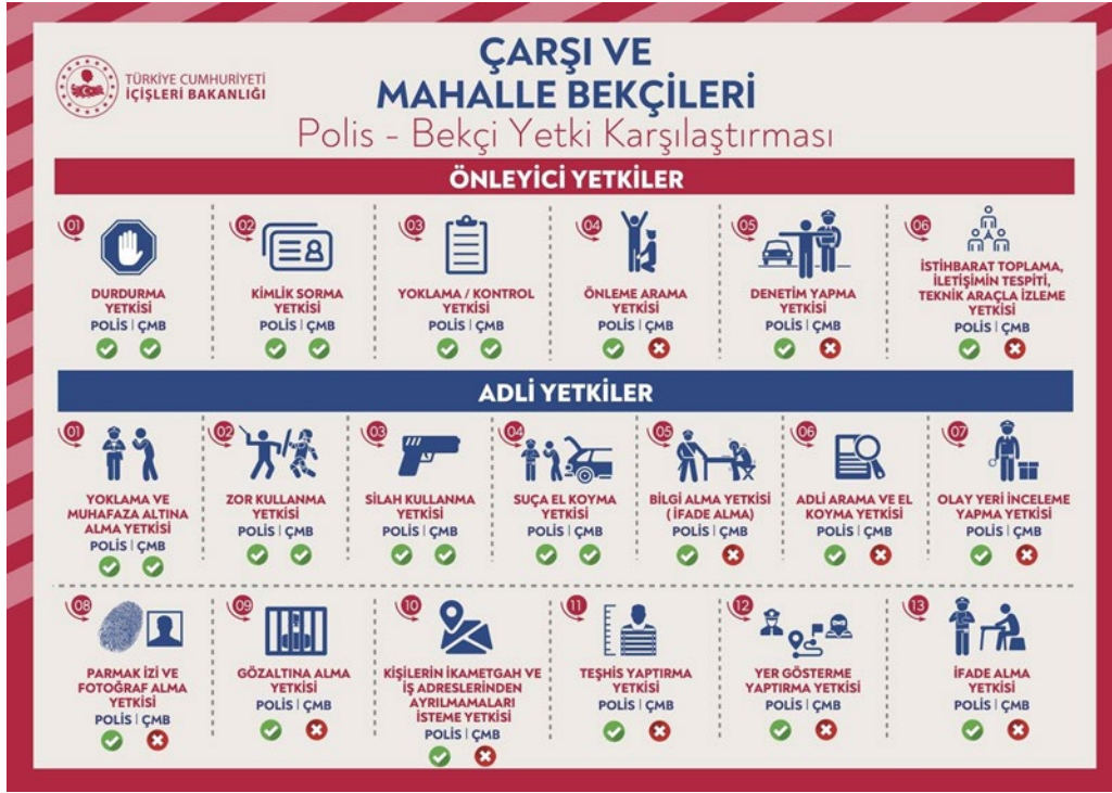
Şekil 2: Polis Bekçi Yetki Karşılaştırması

Salâhiyetler Kanunu Madde 16'ya göre bekçilerin de polis gibi silah kullanmaya yetkili olduklarına değinilmiştir. Yayınlanan bu içeriğin Facebook, Twitter ve LinkedIn'de paylaşılabilmesi için web sitesinde panel bulunmaktadır ( www.icisleri.gov.tr ).