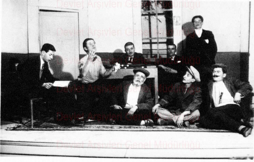
Fon No: 490 1 0 0 - Kutu No: 1070 - Dosya No: 1100 - Sıra No: 1