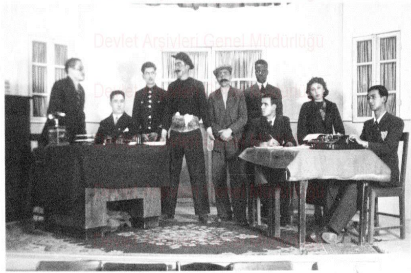
Fon No: 490 1 0 0 - Kutu No: 1070 - Dosya No: 1100 - Sıra No: 1