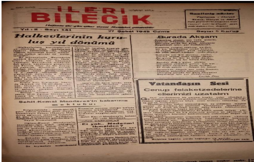
27 Şubat 1948 Tarihli İleri Bilecik Gazetesinde Bilecik Halkevi ile ilgili Haber. EK 7.