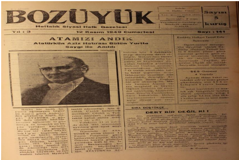
Bilecik Halkevi ile İlgili İleri Bozüyük Gazetesinin 28 Aralık 1951 Tarihli Haberi.