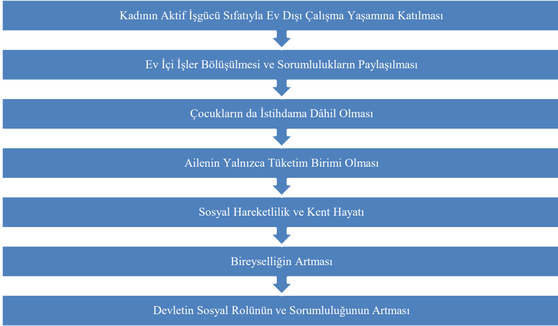
Şema 4: Endüstri Toplumunda Ailenin Süreç Analizi

Endüstri dönemi, yalnızca makineleşme ile birlikte gelişen mekanik bir yenilenme süreci değil aynı zamanda toplumun hemen her alanında değişime neden olmuş sosyo-kültürel bir hareketliliktir. Öyle ki, teknolojik anlamda ilerlemelerin kaydedilmesi ile insan gücüne duyulan ihtiyacın azalması ve dolayısıyla istihdam alanlarının daralması, sosyal dışlanma ve mekânsal ayrışma, şiddet, demografik yapının çözülmesi, göç gibi çok çeşitli konuların birer sosyal soruna dönüşmesi, mevcut sosyal politikaların yenilenmesini yahut yeni sosyal politikaların üretilmesini zorunlu hale getirmiştir. Bu dönem sosyal politikalarına yön veren en önemli aktörlerden biri de sosyal bir kurum olan ailedir.