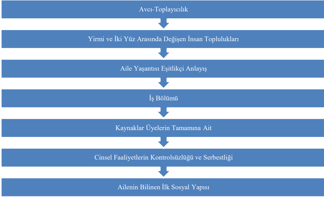
Şema 2: İlkel Dönemde Ailenin Süreç Analizi Şeması