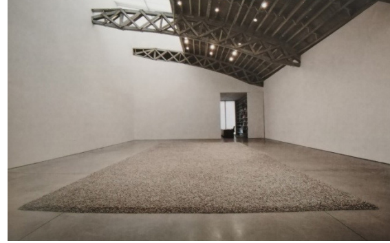
Resim 13. Ai Weiwei "Sunflower Seeds (Ayçekirdekleri)" (Görsel Kaynak: Wilson, M. (2015). Çağdaş Sanat Nasıl Okunur 21.Yüzyıl Sanatını Yaşamak . İstanbul: Hayalperest Yayınevi)

Tate Modern'deki enstelasyonun ardından 2012 yılında New York'taki Mary Boone Gallery'de farklı bir versiyonu sergilenmiştir (Resim 13). Bu sergileme öncesinde Ai, izleyicilerin yapıtının üstünde yürümelerini istemiştir. Üzerinde yürünerek yapıtın tam anlamıyla anlaşılabilirliğini savunan sanatçının bu görüşü kısa bir süre uygulanmıştır. Ancak yetkililer seramik tozunun sağlık riskleri nedeniyle kısa bir süre sonra bu tecrübeyi sonlandırmıştır. Sergileme sonrasında 10 ton içerisinde yaklaşık olarak sekiz milyon tane çekirdek, Tate'in sabit koleksiyonu için satın alınmıştır (Wilson, 2015, s.22).