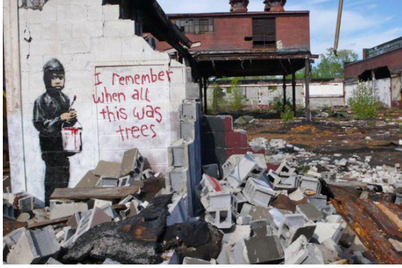
Resim 8. Banksy'nin "I remember when all this was trees" yazılı grafiti çalışması

eseri koruma gerekçesiyle sokaktan almıştır. Ağırlığına ve zorlukla taşınan bir duvar parçası olmasına rağmen duvar alınıp galeriye götürülmüştür. Sanatçı ve şehir halkının tepkilerine rağmen galeri yöneticileri eserin satışı sunulmayacağını ve her isteyen galeri alanında ücretsiz olarak ziyaret edebileceğini belirtmiştir (Koçak, 2020,s.26).