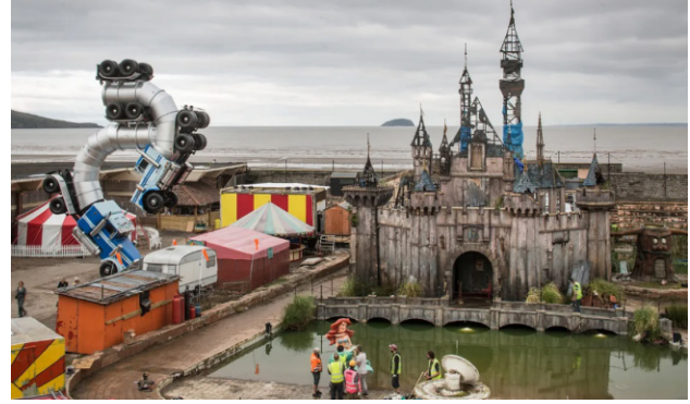
Resim 6. "Dismaland – Bemusement Park"adlı enstalasyon alanı

Dismaland'da gezmekte olan bir balon satıcısının elindeki siyah helyum balonlarının üzerinde "I am an imbecile (Ben bir embesilim)" yazmaktadır. İnsanların bu balonları para vererek almaları ve bu balonların hala çerçevesiz satılıyor olması da dünya toplumunun hâline bir ironi olarak sunulmuştur (Koçak, 2020,s.26).