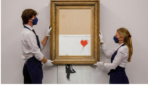
Resim 11. Banksy "Love is in the Bin (Çöpteki Aşk)"

Sanatçının, 2002 yılında Londra'da bir duvara "Her Zaman Umut Var" yazısıyla birlikte kırmızı bir balonu tutmaya çalışan bir kız çocuğunu resmettiği, daha sonra şehrin farklı yerlerinde tekrarladığı bilinmektedir. Müzayedede satılan bu eseri özellikle mi 2002 yılında duvara resmettiği eserin konusundan seçtiği konusu da incelenmeye değerdir.