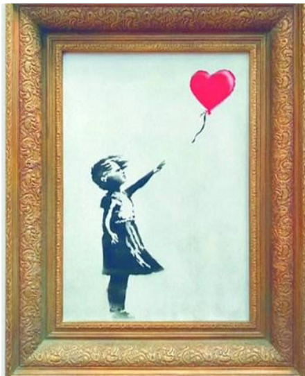
Resim 9. Banksy "Girl With Baloon(Kırmızı Balonlu Kız)"

Banksy'nin tüm dünyanın ilgisini çektiği Kırmızı Balonlu Kız adlı eseri ise çok farklı, daha önce rastlanmamış ve hâlâ tartışılmaya devam eden bir süreçle karşımıza çıkmıştır(Resim – 9). "Girl With Baloon (Kırmızı Balonlu Kız)" adlı eser, 2018 yılında Sothebys Londra'da müzayedede satıldıktan hemen sonra çerçevesinin içinde bulunan kağıt kesme cihazıyla kendi kendini yok ederek sanat dünyasında büyük bir şaşkınlığa sebep olmuştur.