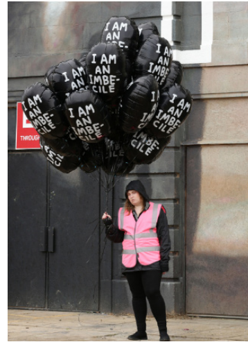
Resim 7. Dismaland – Bemusement Park'ta "I am an imbecile" yazılı balonlar

Sanatçı her ne kadar sanat eserleri ile iç içe geçmekte olan ticari sistemi eleştirse de eserlerini bu sisteme dâhil olma sürecini farklı örneklerle izlemeye devam etmekteyiz. Banksy'nin 2010 yılında Detroit'te bir duvara yaptığı bir grafiti, sanatçının isteği dışında yine bir galeri aracılığıyla ticari denkleme dönüştürülmüştür.