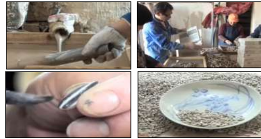
Resim 14. Ai Weiwei "Sunflower Seeds (Ayçekirdekleri)" üretim süreci (Görsel Kaynak: http://www.khanacademy.org.tr/sosyal-bilimler-ve-sanat/sanat-tarihi/global-cagdas-sanat/21.-yuzyilda-global-modernizm/ai-weiwei-aycicegi-cekirdekleri/9006 )

Ayçekirdekleri , eski zamanlarda imparatorluk için porselenler üreten Jingdezhen kasabasında, porselen kilinin geleneksel yöntemlerle elde edilmesinden, şekillendirmesine, pişirilip renklendirilmesine ve son pişiriminin yapılarak gerçek bir porselen eser yöntemlerinin izlendiği bir süreçten geçmektedir. Farklı ve şaşırtıcı bir eseri, geleneksel yöntemlerle gerçekleştirip yine küresel ölçekte ticarileştiren Weiwei, bu eserin düşünsel alt yapısını da kendine özgü olarak kurgulamıştır.