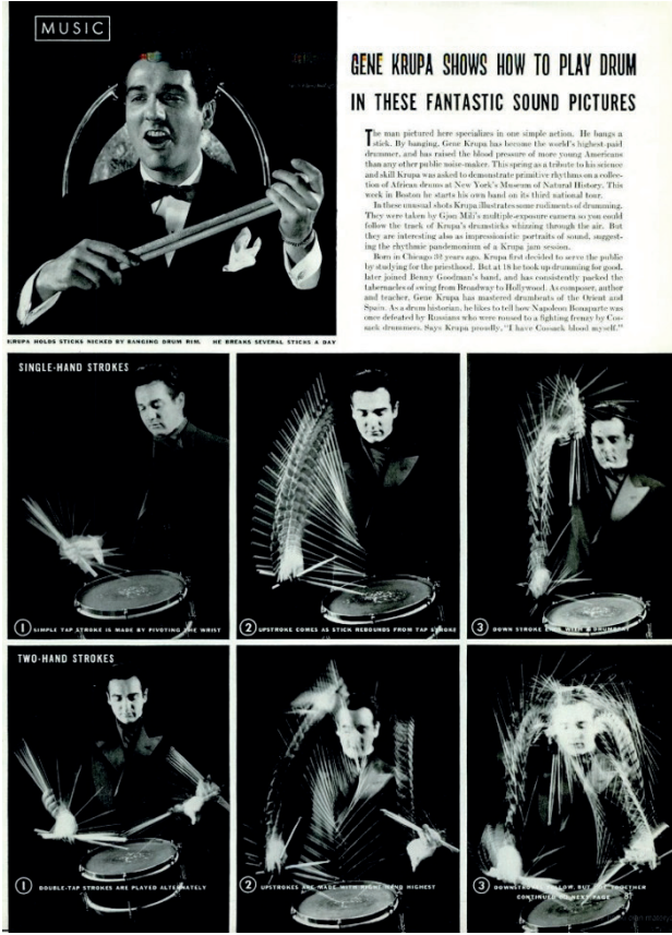
Resim 5: Life Magazine, 9 Haziran 1941.

da sınıfa göre yayın yapmamaya özen gösterdiklerini ve “bu türden engelleri kaldırmak için” uğraştıklarını belirtmiş; şöyle devam etmişti: “(...) Bekâr bir kadın, otomobili olan bir adam, bir banliyö sakini, bir zenci ya da beyaz olarak değil; sizleri yalnızca insan olarak görmeye çalıştık ve insanlık deneyimlerimizi paylaşmak istedik” (1972:96). Diğer taraftan Life’ın bu noktaya ulaşmasındaki en büyük pay elbette ki derginin fotoğrafçılarına aittir. Life, haber /