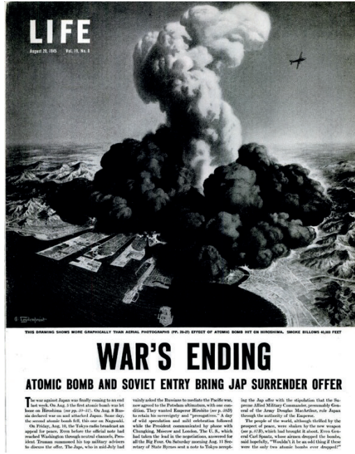
Resim 2: Life Magazine, 20 Ağustos 1945.