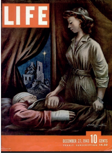
Resim 1: Life Magazine, 27 Aralık 1943.

Çek halkına (ve Sovyetler'e ılımlı olan tüm Doğu Avrupa'ya), Komünizm'in elinden kurtulun çağrısıdır. Dergi, sanatı ve sanatçıyı yücelterek ABD'nin yeni misyonunu ilan etmektedir: Batı uygarlığının kollayıcısı bundan böyle Birleşik Devletler'dir.