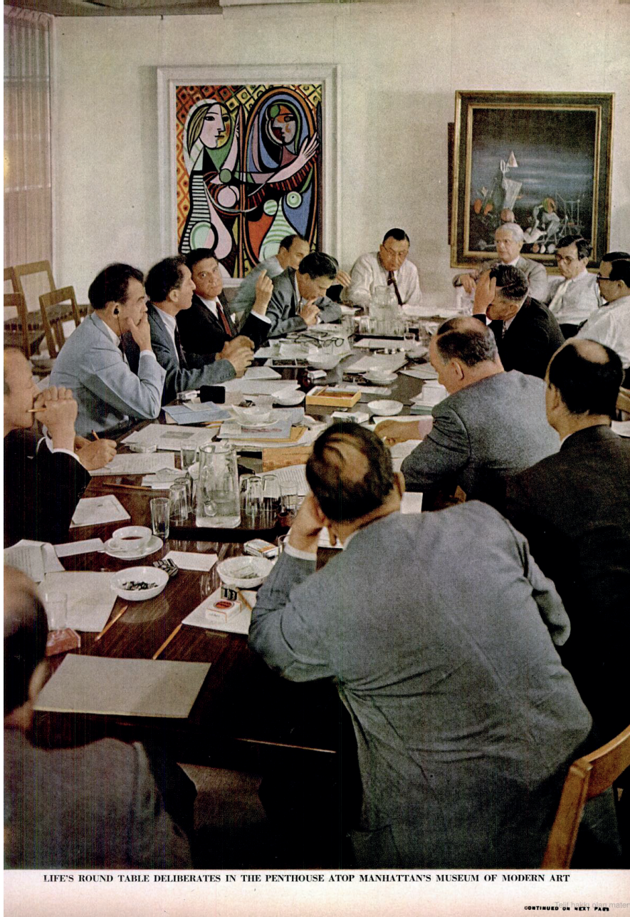
Resim 4: Life Magazine, 11 Ekim 1948.