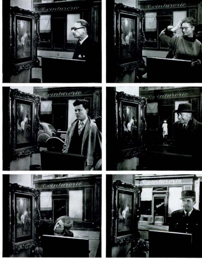
Resim 6: Life Magazine, 23 Mayıs 1949.