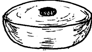
Şekil 1. İğ Ağırşığı.