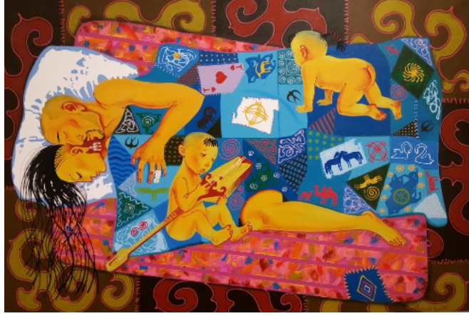
Şekil 55. Askarov Kuat «Tath Uyku» 2010 (K.C.MilliMüzesi, 2016)