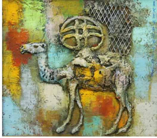
Şekil 26. Akanayev Timur "Bahar Nefesi" 2010 (Arvest Art Gallery, 2017)