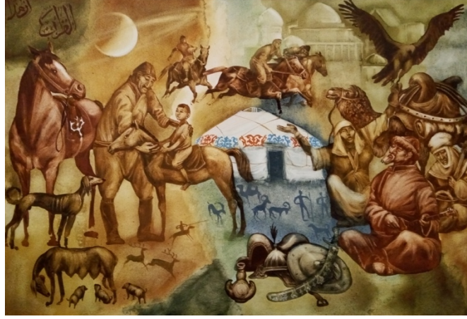
Şekil 53. Askarov "Bata – Hayır Duası" 2013 (K.C.MilliMüzesi, 2016)