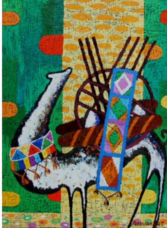
Şekil 36. Muratbayev Abduahat «Gelin Kervanı» 2012 (Arvest Art Gallery, 2017)