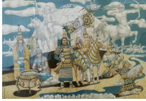
Şekil 61. Taynov "Tengri Göğün Altında" 2016 (Kasteyev Müzesi, 2016)