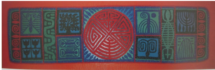
Şekil 10. Gvozdyov Vladimir «Erkek ve Kadın Sembolleri» 2005 (Şalabayeva G. , 2008, s. 99)

Sanatçı Gvozdyov, neredeyse birebir aynı iki eser olan "Erkek ve Kadın Semboller" (Şekil 10. Gvozdyov Vladimir «Erkek ve Kadın Sembolleri» 2005), «Şanırak» (Şekil 11.) ve "Şanırak" (Şekil 12.) ve eserlerinde de şanırak motifini merkezi olarak ele almaktadır. Şanırak eril ve dişil başlangıcın brliğini simgeleyen işaretlerlerden oluşturulmuş, aileyi ve birliğı simgeleyen bir motif olarak şeklinde ele alınmıştır.