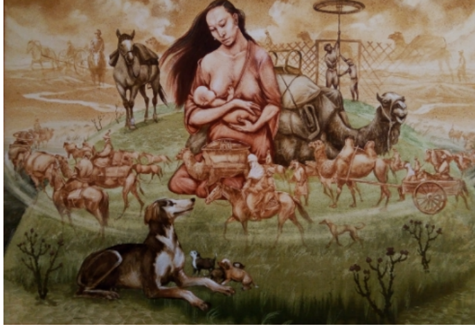
Şekil 46. Askarov Kuat «Bozkır Madonnası» 2013 (K.C.MilliMüzesi, 2016)