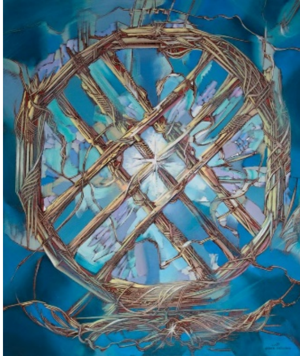
Şekil 8. Begalin Aybek “Şanırak”2014 (Айбек Безалин, 2022)