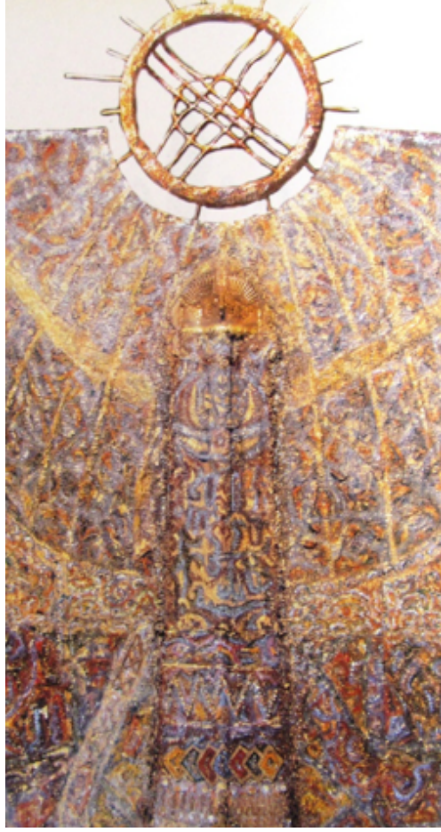
Şekil 39. Akanayev Amandos "Saukele" 2003 (Nurpeisova & Urazbekova, 2005, s. 126)