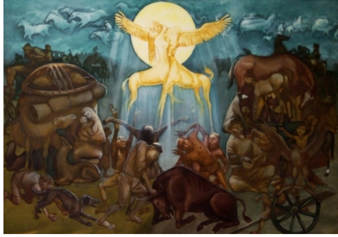
Şekil 17. Askarov Kuat «Dolunay» 2013 (K.C.MilliMüzesi, 2016)