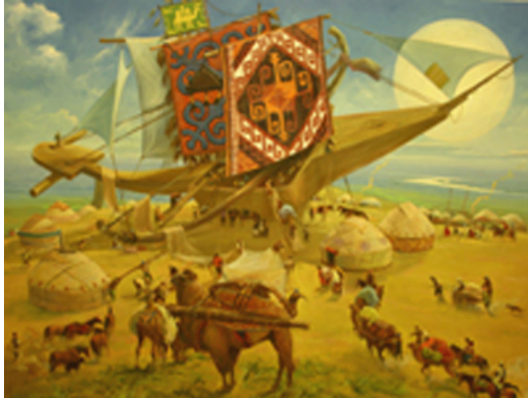
Şekil 16. Askarov Kuat «Boskır İkar'ı» 2008 (K.C.MilliMüzesi, 2016)