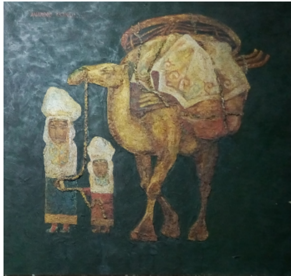
Şekil 31. Akanayev Amandos "Deve İle Kompozisyon" (Kasteyev Müzesi, 2016)