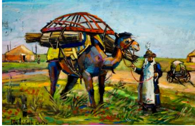
Şekil 30. Rozakov "Şanırak" 2007 (Arvest Art Gallery, 2017)