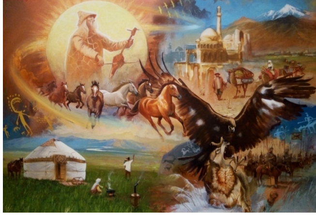
Şekil 52. Askarov "Yüzyılların Altın Telleri"2014 (K.C.MilliMüzesi, 2016)