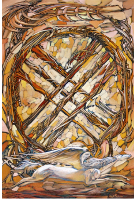
Şekil 5. Begalin Aybek «Şanırak» 2011 (Айбек Бегалин, 2022)