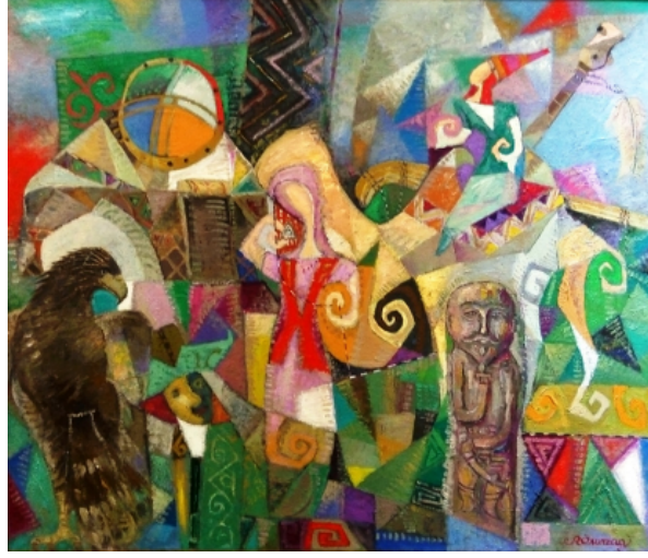
Şekil 32. Rıstan Omurzak "Göç" 2015 (Kasteyev Müzesi, 2016)