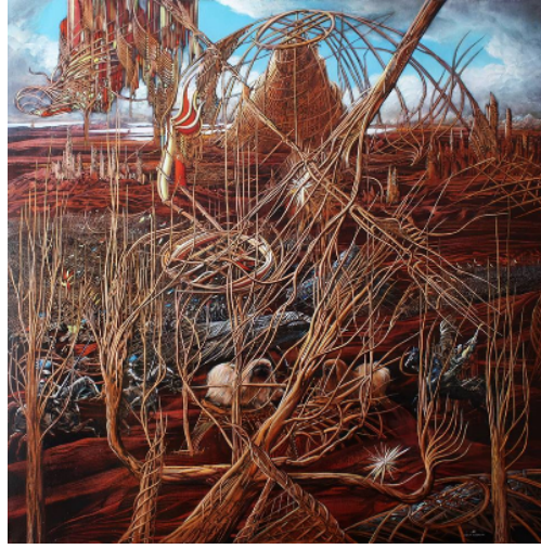
Şekil 56. Begalin Aybek «İrek Yolu» 2014 (Айбек Бегалин, 2022)