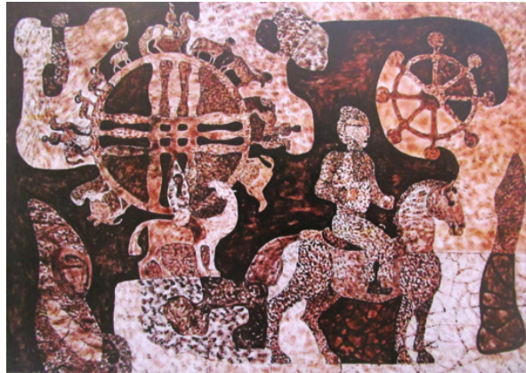
Şekil 60. Taynov "Avrasya Göçebeleri" 2010 (Şalabayeva G. , "Çok Yüzlü Avrasya" sergi katalogu, 2010)