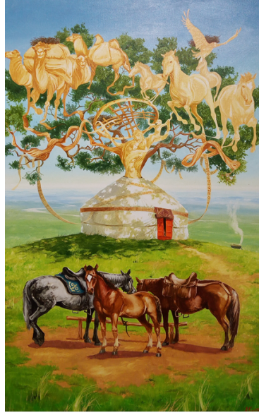
Şekil 50. Askarov Kuat «Hayat Ağacı - 2» 2013 (K.C.MilliMüzesi, 2016)