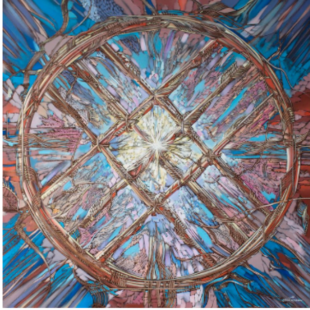
Şekil 7. Begalin Aybek «Şanırak» 2014 (Айбек Безалин, 2022)