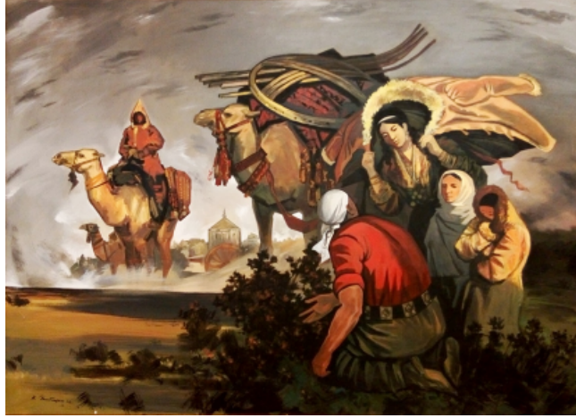
Şekil 21. Ajibekov Kazibek "Adıraspan" 2012 (KasteyevMüzesi, 2016)