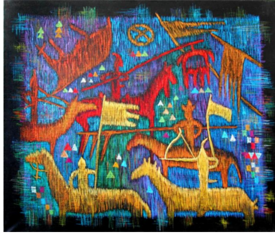
Şekil 59. Muratbayev Abduahat "Tuğ Tutanlar" (Arvest Art Gallery, 2017)