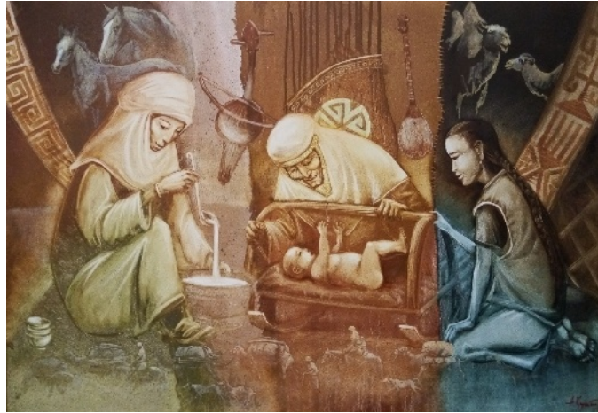
Şekil 19. Askarov “Altın Beşik”2013 (K.C.MilliMüzesi, 2016)