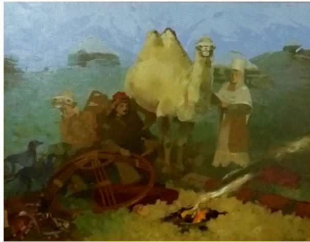
Şekil 34. Jakıpbek Aset "Düğün Geleneği" 2009 (Kasteyev Müzesi, 2016)