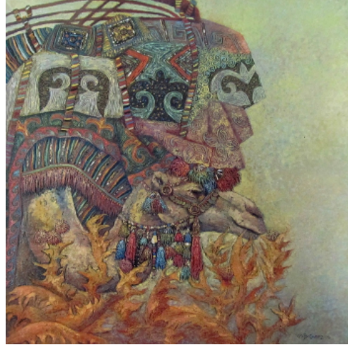
Şekil 27. Akanayeva Botagöz "Bahar" 2006 (Şalabayeva G. , 2008)