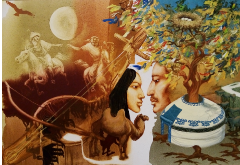
Şekil 38. Askarov Kuat «Sütle Beslenip Büyüyenler» 2013 (K.C.MilliMüzesi, 2016)

Şanırak motifin doğurganlık, kadın ve üreme, çocuk doğurma fikriyle ilişkili olduğunun yansımaları Askarov'un «Sütle Beslenip Büyüyenler» (Şekil 38.), A. Akanayev'in "Saukele" (Şekil 39.), "Saukele" (Şekil 40.), Mekebayev'in "Kör İhtiyar Kadın" (Şekil 41.) eserlerinde görmek mümkündür. "Yurt kenarları (şanırak), üreme sembolü olan Kazak ulusal konutunun en saygın detaylarından biridir." (Yegizbayeva, 2016).