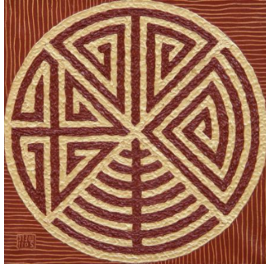
Şekil 12. Goozdyov Vladimir / Şege "Şanırak" 2011 (Vladimir Goozdev Şege web sitesi, 2017)

Yeni kurulmakta olan yurt çadırın mavi gök fonunda yakın planda resmedilmiş şanırak motifi görüntüsü şeklinde Katsyuba'nın "Şanırak" (Şekil 13.) adlı eserinde görmek mümkündür. Muratbayev'in "Dolunay" (Şekil 14.) adlı eserinde şanırak motifi dekoratif bir şekilde tasvir edilmiş olup, çalışması çadırın içinden gökyüzüne bakış açısını sunmaktadır.