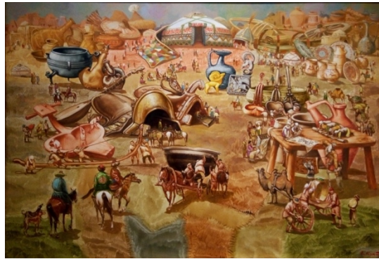
Şekil 51. Askarov "Ustalar Şehri" 2014 (K.C.MilliMüzesi, 2016)