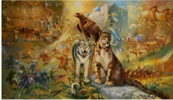
Şekil 47. Askarov Kuat «Pelin Otu Kokusu – Üç Jüz» 2016 (K.C.MilliMüzesi, 2016)