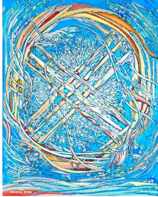
Şekil 4. Begalin Aybek «Şanırak» 2010 (Айбек Бегалин, 2022)