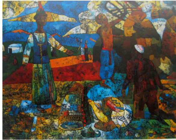
Şekil 33. Yesdaulet Askar "Başlangıç" 1999 (Arvest Art Gallery, 2017)