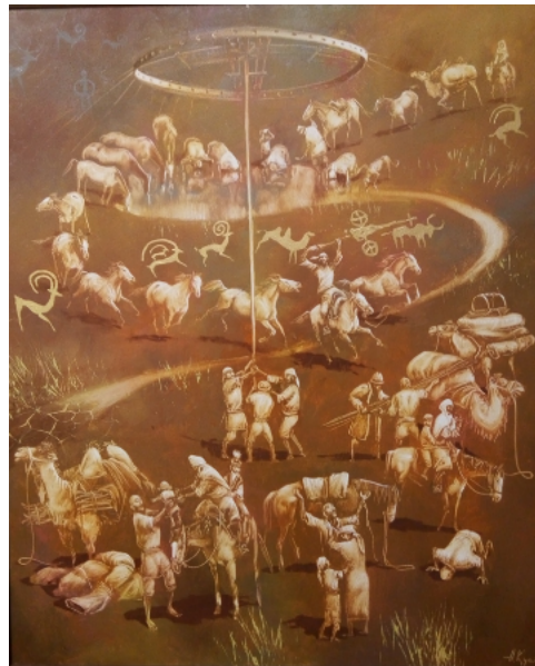
Şekil 45. Askarov Kuart Triptik «Ayın Doğuşu» 2016 (K.C.MilliMüzesi, 2016)