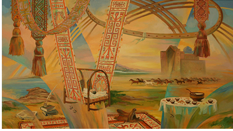
Şekil 64. Kalmahanov Madihan "Bozkir Beşiği" 2012 (Sağınğali & Aktayeva, 2010)