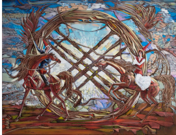
Şekil 2. Begalin Aybek “Şiirsel Tartışma/Atış” 2014 (Айбек Бегалин, 2022)