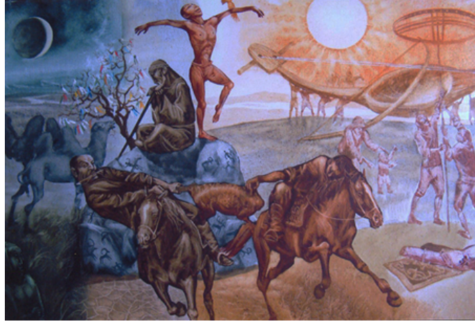
Şekil 43. Askarov Kuart «Kartalla Dans Eden» 2013 (K.C.MilliMüzesi, 2016)