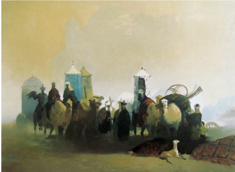
Şekil 23. Ajibekov Kazıbek "Ata Yurdu" 1998 (Şalabayeva G., Asırların Geçişinde Kazakistan Resim Sanatı. Katalog, 2000)