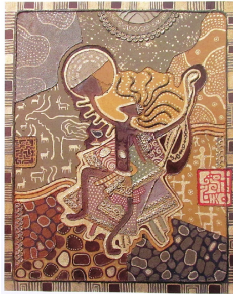
Şekil 63. Kamitkanov Nurdan "Baksı/Şaman" 2006 (Şalabayeva G. , 2008)