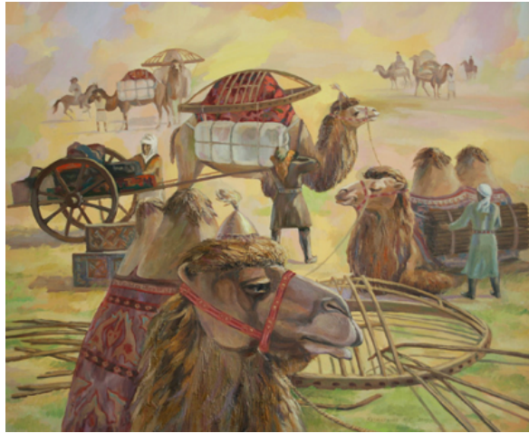
Şekil 28. Kalmahanov Madihan "Göç" 2010 (Kasteyev Müzesi, 2016)