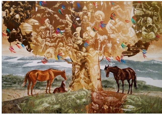
Şekil 54. Askarov "Hayat Ağacı" 2014 (K.C.MilliMüzesi, 2016)