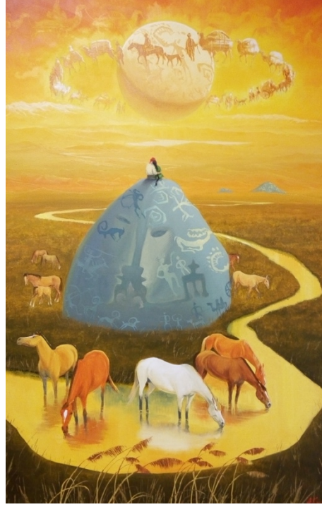
Şekil 20. Askarov "Cevher taş"2015 (K.C.MilliMüzesi, 2016)