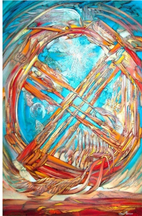
Şekil 6. Begalin Aybek «Şanırak» 2009 (Айбек Бегалин, 2022)