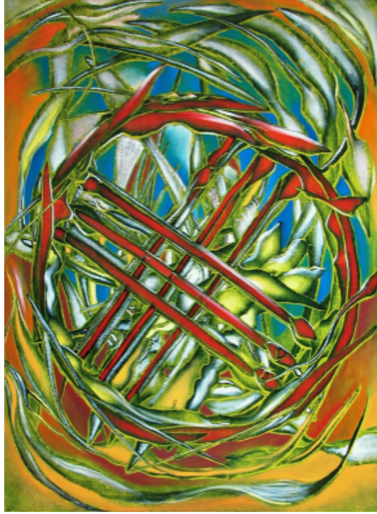
Şekil 3. Begalin Aybek «Şanırak» 2004 (Айбек Бегалин, 2022)