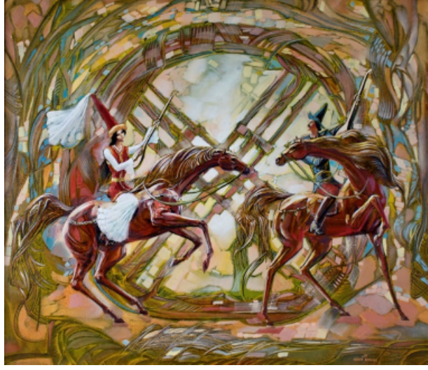
Şekil 1. Begalin Aybek “Şiirsel Tartışma/Atış” 2011 (Айбек Бегалин, 2022)

Şanırak motifini direkt olarak ve resim kompozisyonlarında merkezi olarak ele alan sanatçılardan biri Begalin. “Şiirsel tartışma / atış (aytıs)” (Şekil 1. ve Şekil 2.), “Şanırak”(Şekil 3 - 9.), adlı eserlerinde Şanırak motifi tabloların tümünü kaplamakta ve şanırakın merkezi tablonun merkezine denk gelmektedir. Şanırakın yapısı üzerine doğru bir mandala olduğu ile ilgili fikrini süren Zira Naurzbayeva’nın sözlerini hatırlamaktayız. Sanatçı bir mandala üzerine odaklanıp meditasyon yaparmışçasına şanırakın hakikatine ulaşmaya çalışmakta gibidir. Neredeyse aynı kompozisyon farklı eserlerde çeşitli versiyonlarda tekrarlanmaktadır. “Şiirsel tartışma / atış (aytıs)” resimlerinde kadın ve erkek başlangıcının birliğini simgeleyen şanırak motifi karşımıza çıkmaktadır.