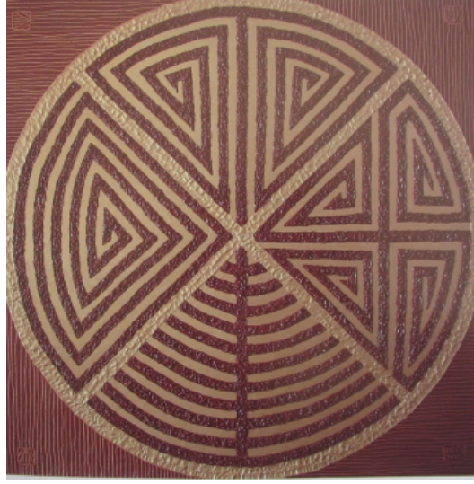
Şekil 11. Goozdyov Vladimir / Şege "Şanırak" 2006 ( (Şalabayeva G. , 2008, s. 101)