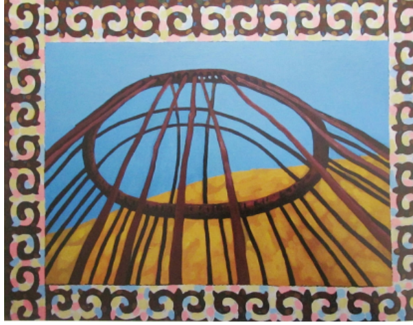
Şekil 13. Katsyuba Olga "Şanırak" 2007 (Şalabayeva G. , 2008, s. 138)