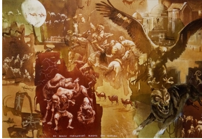
Şekil 18. Askarov “Kanatlarımı Açan” 2013 (K.C.MilliMüzesi, 2016)