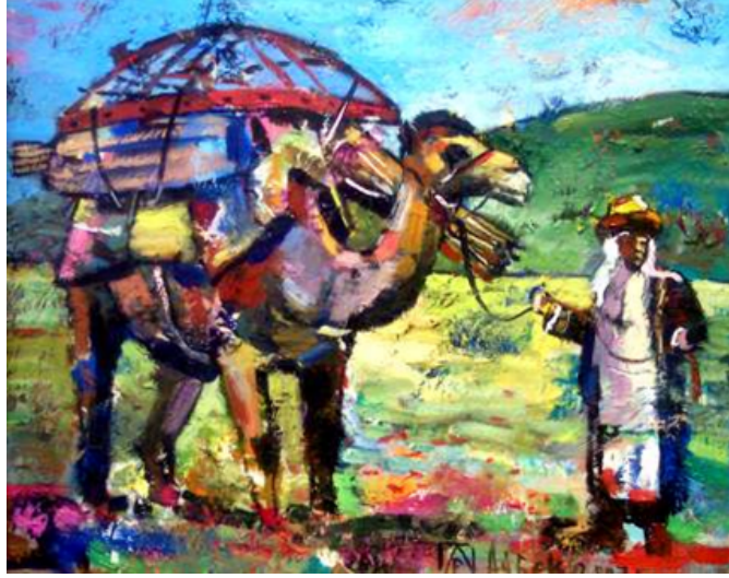
Şekil 29. Rozakov Aybek "Şanırak" 2007 (Arvest Art Gallery, 2017)