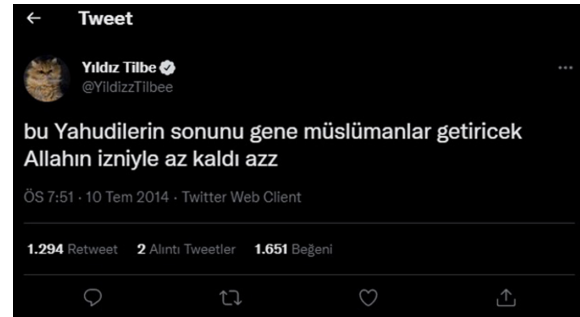
Şekil 13. Dine Yönelik Nefret Söylemi İçeren Tweet (Tilbe, 2014)