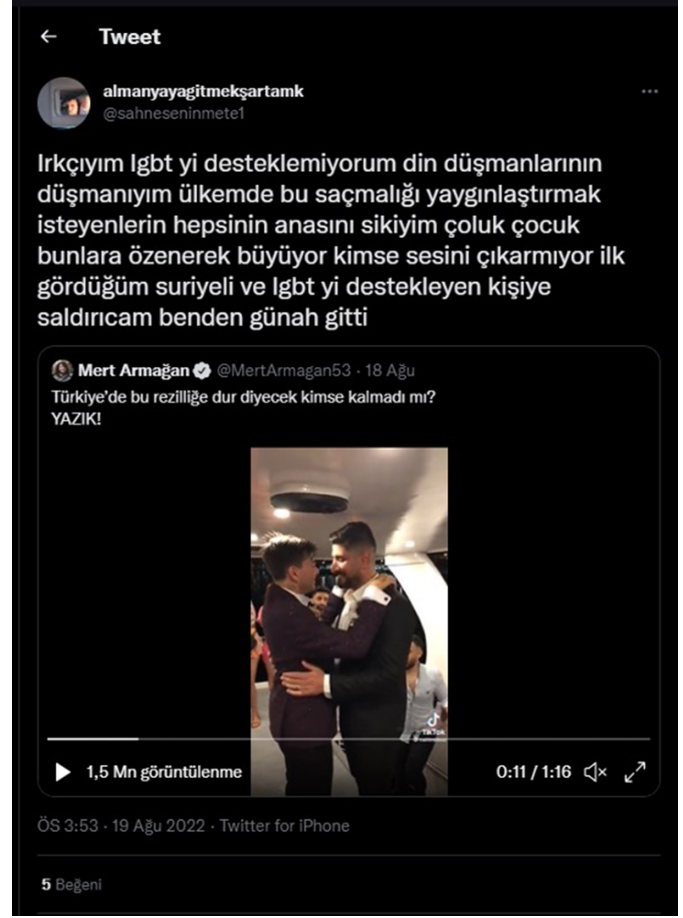
Şekil 7. Cinsel Kimliğe Yönelik Nefret Söylemi İçeren Tweet 2 (Almanyayagitmekşartamk, 2022)