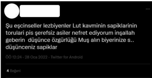
Şekil 6. Cinsel Kimliğe Yönelik Nefret Söylemi İçeren Tweet (Demirel, 2022)

Şekil 9'da ırkçılığa yönelik nefret söylemi içeren tweet görülmektedir. Dünyayı sarsan Covid-19 salgınının Çin merkezli bir virüs olarak kabul edilmiştir. Bu durum insanların Çin devletine karşı nefret kazanmalarına yol açmıştır. Yukarıdaki tweette ise Çin'in yeryüzünden silinmesi gerektiği ifade edilmektedir. Bu durum ırkçılık içeren bir nefret söylemi olarak nitelendirilebilir.