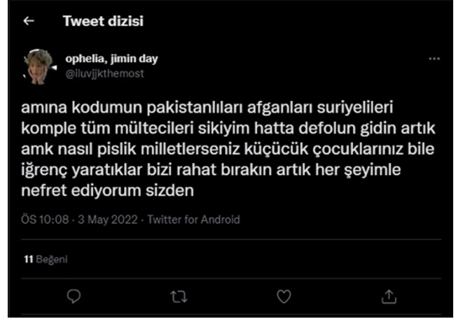
Şekil 11. İrkçılık ve Mültecilere Yönelik Nefret Söylemi İçeren Tweet (Ophelia, 2022)