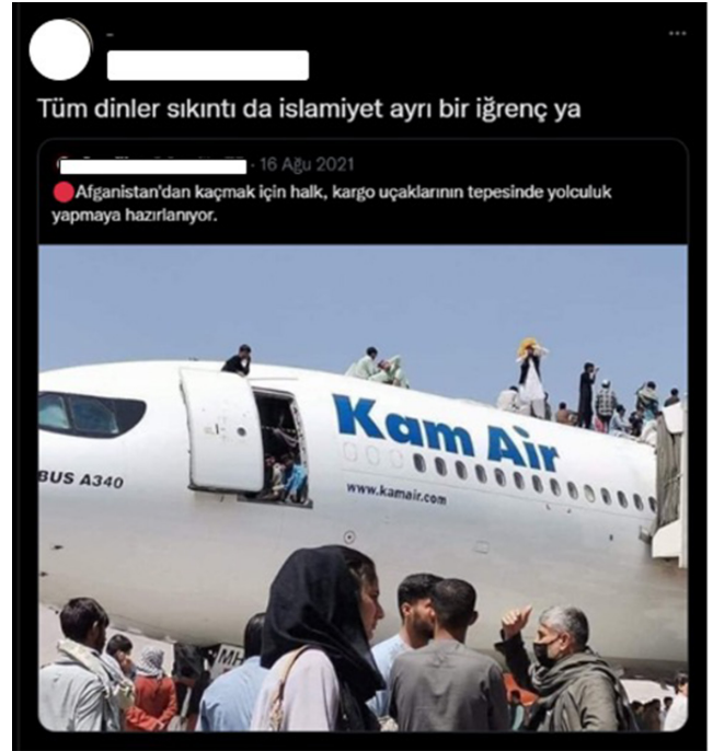
Şekil 12. Dine Yönelik Nefret Söylemi İçeren Tweet (Kiddo, 2021)