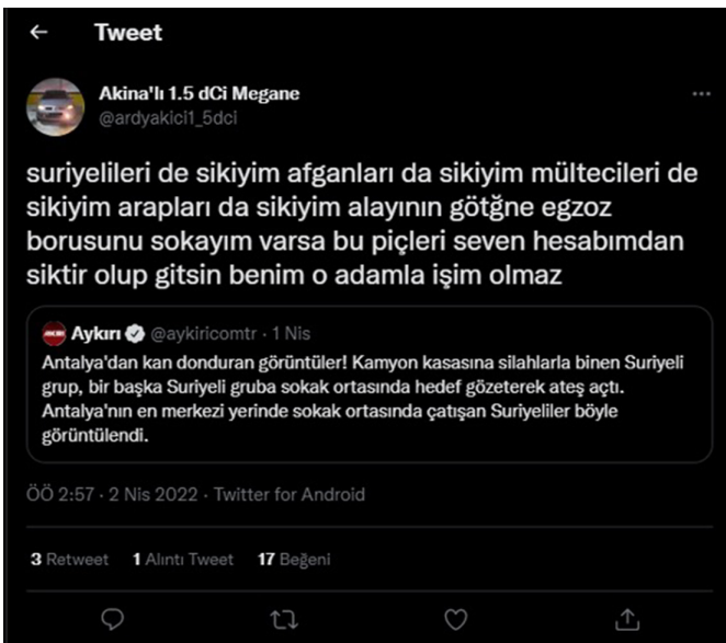
Şekil 2. Mülteci Karşıtlığı ve Irkçılık İçeren Tweet (Akına'lı 1.5 dCi Megane, 2022)

Şekil 5'te yer alan tweette ise "travesti" bireylere karşı iğrenç ve aşağılık kelimelerinin kullanıldığı görülmektedir. Tweetin beğeni sayısı düşük olsa dahi toplum içerisinde bulunan farklı bireylere karşı ve onları destekleyen kişilere karşı "iğrenç ve aşağılık" gibi