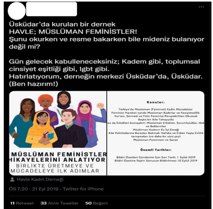
Şekil 8. Kadın Derneklerine Yönelik Nefret Söylemi İçeren Tweet (Yıldırım, 2019)