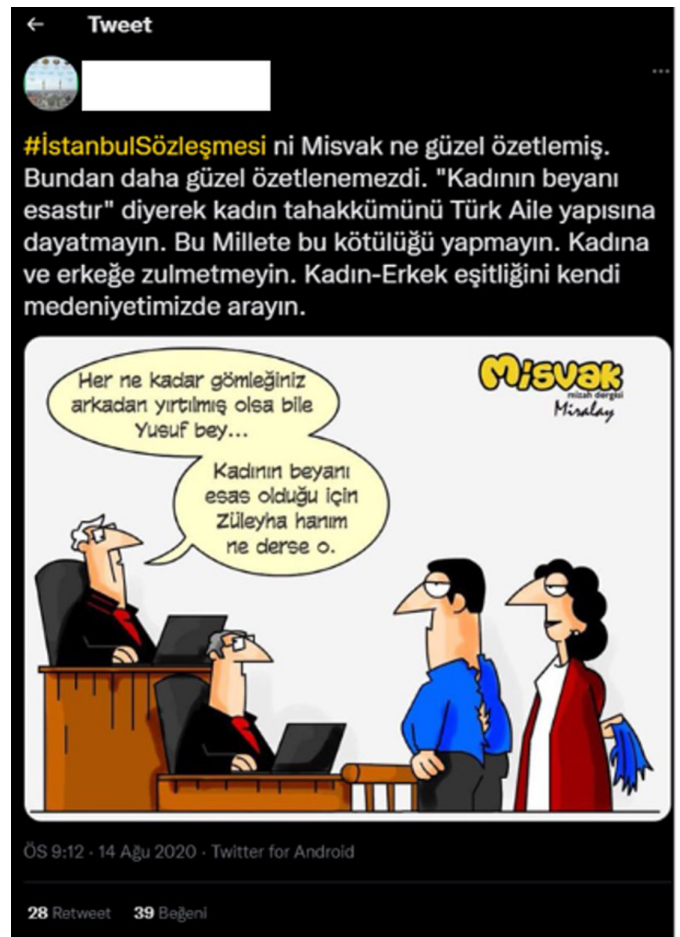
Şekil 4. Kadın Haklarına Yönelik Nefret Söylemi İçeren Tweet (Misvak Caps, 2021)