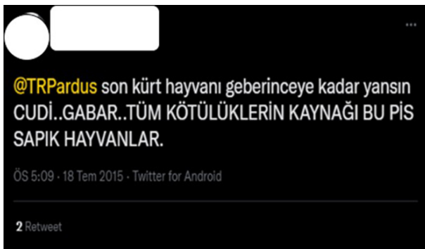
Şekil 10. İrkçılığa Yönelik Nefret Söylemi İçeren Tweet 2 (Altıparmak, 2015)

Şekil 13'te yer alan paylaşımına bakıldığında dine yönelik bir nefret söylemi olduğu görülmektedir. Bu paylaşımın içeriği ele