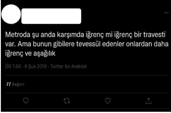
Şekil 5. Cinsel Yönelime Karşı Nefret Söylemi İçeren Tweet (Ozmumcu, 2022)

nefret söylemlerinin internet üzerinde yaygın olduğunu söylemek mümkündür.