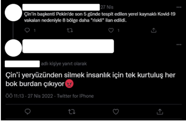
Şekil 9. İrkçılığa Yönelik Nefret Söylemi İçeren Tweet 1 (Türkiye*Fenerbahçe, 2022)

Şekil 10'da yer alan tweette yukarıdaki örnek gibi bir ırkçılık söz konusudur. Paylaşımında bahsi geçen durum 15 Temmuz 2015 tarihinde Şırnak Cudi Dağında yüzlerce hektarlık ormanlık alanın yanması ile gerçekleşen bir yangını içermektedir. Kullanıcı çıkan bu yangına karşı mutluluk duyduğunu ve bu bölgede Kürt halkının yoğun yaşaması dolayısıyla bu insanların ölmesi gereken hayvan olduklarını ifade etmektedir. Öte yandan paylaşımında Kürtlere karşı bir aşağılama ve hakaret olduğu ve bütün Kürtlerin yok olması temennisini içeren bir nefret söylemi olduğu görülmektedir.