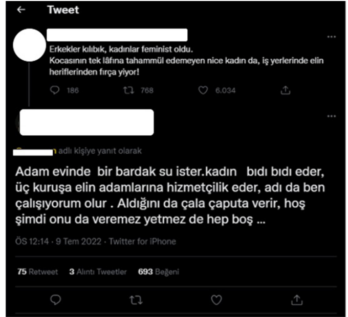
Şekil 3. Kadınlara Yönelik Nefret Söylemi İçeren Tweet (Arseven, 2022)