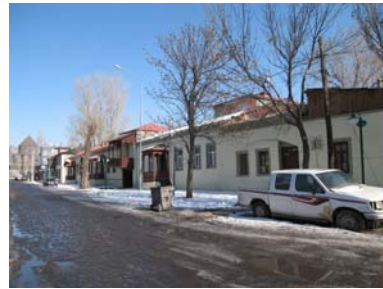
Foto.30- Bitişik nizamdaki evlerden