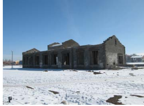
Foto.10- Revizörlük'ten bir görünüm