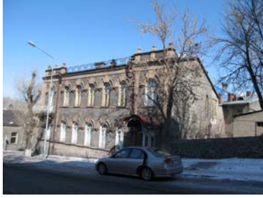
Foto.45- Eski Rus Konsolosluğu Binası