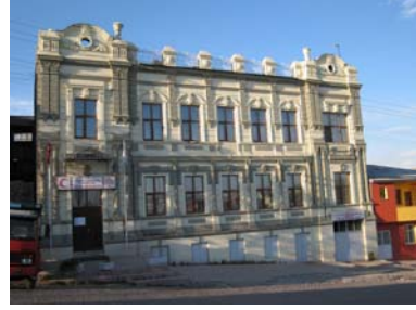
Foto.26- İl Sağlık Müdürlüğü