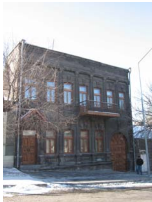
Foto.47- Bir sivil mimarlık örneği