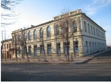
Foto.25- Resmi binalardan biri