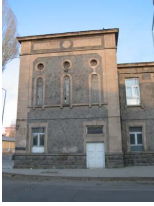
Foto.19-Anadolu Lisesi'nden ayrıntı