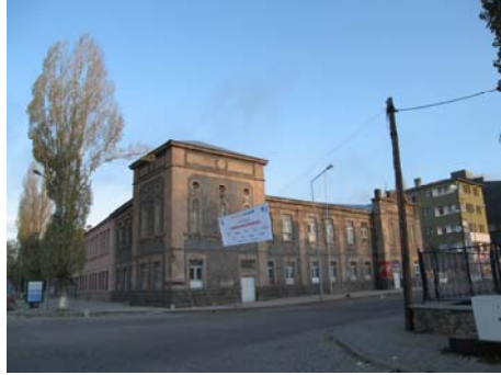
Foto.17- Kars Anadolu Lisesi