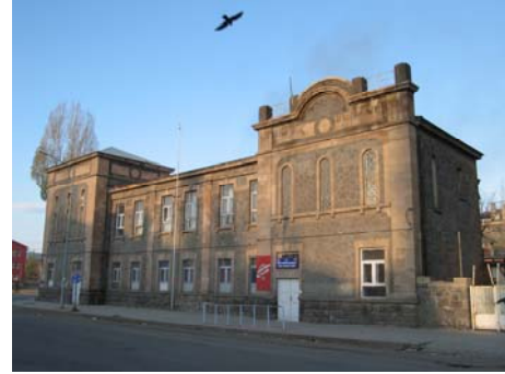
Foto.18- Kars Anadolu Lisesi