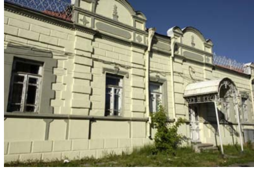
Foto.40- Kars'taki Konut örneklerinden