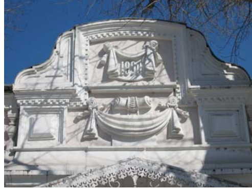
Foto.56- Giriş kapısı üstündeki plastik uygulamalar