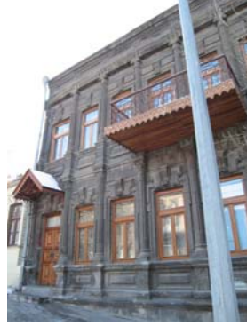
Foto.52- Giriş cephesi ile bir konut