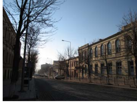
Foto.22- Kars'taki ana caddelerden biri