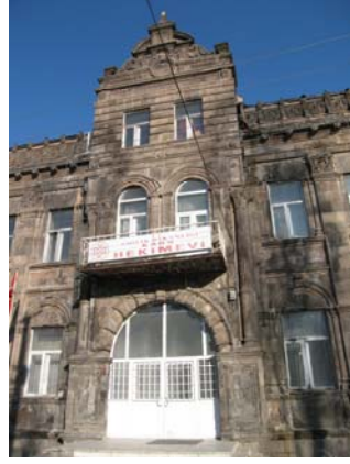
Foto.38- Kars Hekimevi orta bölüm