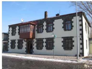
Foto.60- Rustika taşlardan oluşturulmuş pencereleriyle bir konut