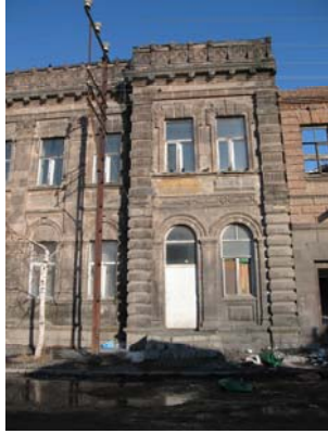
Foto.39- Hekimevi yan cephe