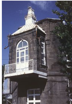
Foto.41- Baltık Tarzı balkon ve bacalar