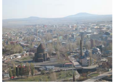
Foto.4- Günümüz Kars'ından bir görünüm