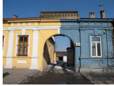
Foto.32- Bir Evin Arka girişi