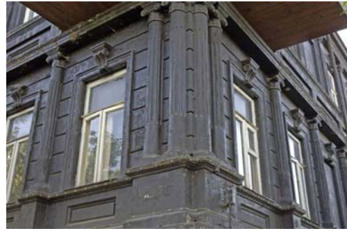
Foto.42- Konutlarda kat sistemi ve plastrlar