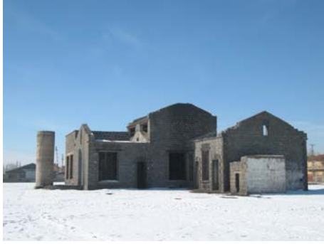
Foto.9- İstasyon Revizörlük Binası