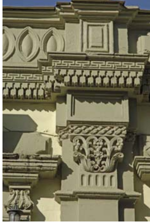
Foto.43- Taşıyıcı unsurların üst bölümü