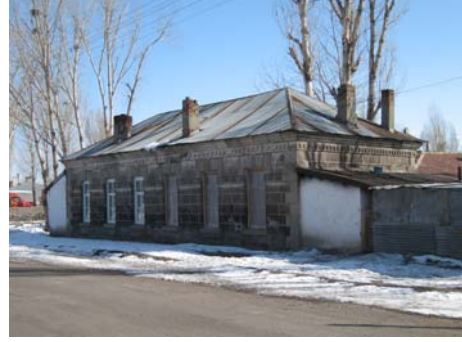
Foto.14- Lojmanlardan bir görünüm