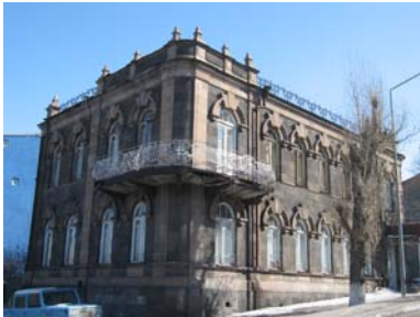
Foto.53- Rus Konsolosluk Binası'nın köşesi