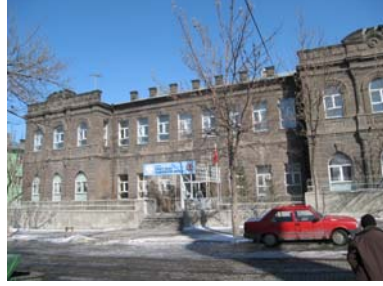
Foto.50- İlköğretim Okulu'nun yandan görünüşü