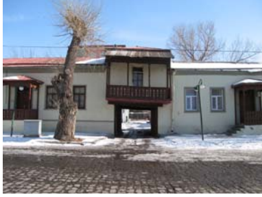
Foto.33- Konut örneklerinden