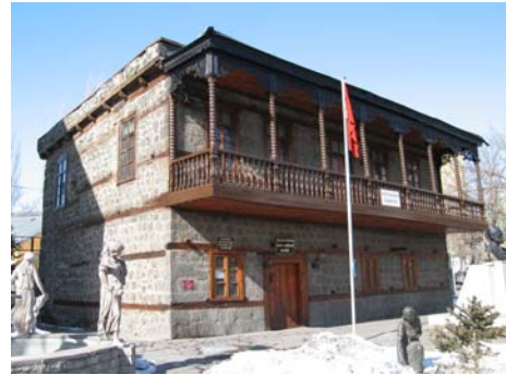
Foto.6- Karargah Binası'nın güneybatıdan görünüşü