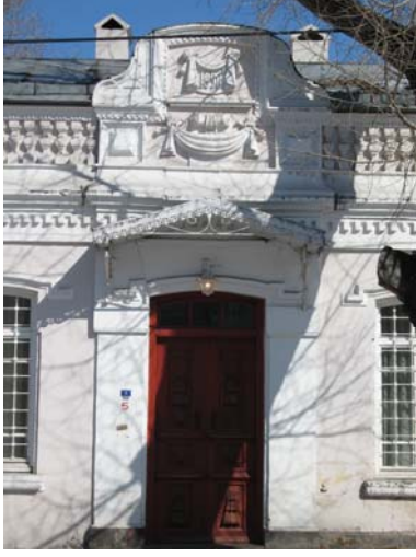
Foto.55- Özel şahsa ait evden ayrıntı