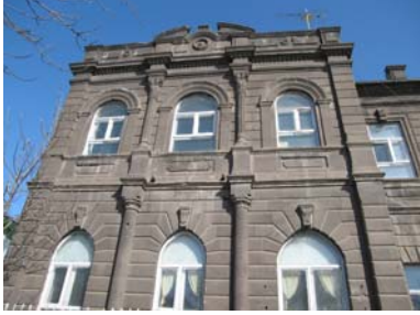
Foto.51- Okulun cephesinden ayrıntı