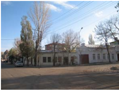
Foto.29- Bitişik düzendeki konutlardan biri