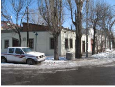
Foto.31- Konut örneklerinden