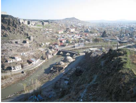
Foto.3- Kars Kalesi ve eski yerleşim