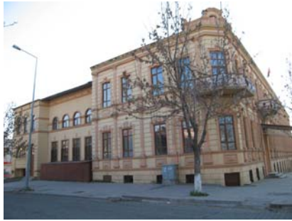
Foto.23- Eski Defterdarlık