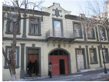
Foto.58- Cephe ortası ve giriş