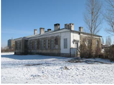
Foto.13- Lojmanlardan bir görünüm