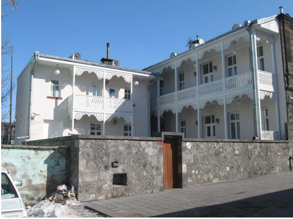
Foto.61- Kar's Oteli'nin günümüzdeki durumu