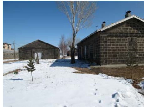
Foto.12- Gümrük Anbarları