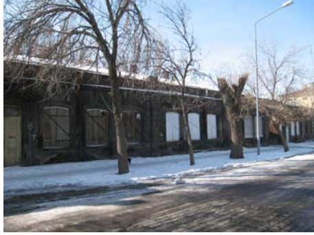
Foto.15- Kars'ta bir cadde ve bitişik nizamda evler