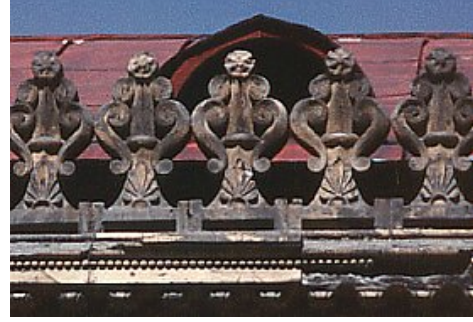
Foto.44- Kornişlerden ayrıntı