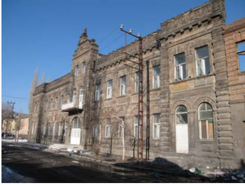
Foto.37- Kars Hekimevi