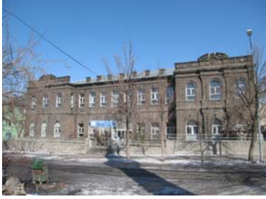
Foto.49- İsmet Paşa İlköğretim Okulu