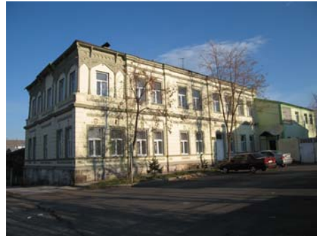
Foto.24- Defterdarlık Misafirhanesi