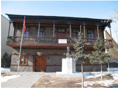
Foto.5- Kars'ta Türk Karargah Binası