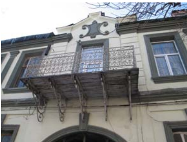
Foto.59- Giriş üstündeki balkon ve alınlık