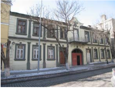
Foto.57- Caddeye bakan cephesiyle bir sivil mimarlık örneği