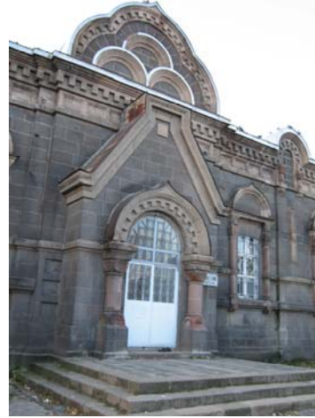
Foto.36- Fethiye Camii'nin güney kapısı