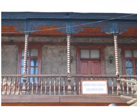
Foto.7- Karargah Binası balkonundan ayrıntı