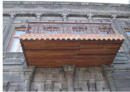
Foto.48- Aynı evden balkon ayrıntısı