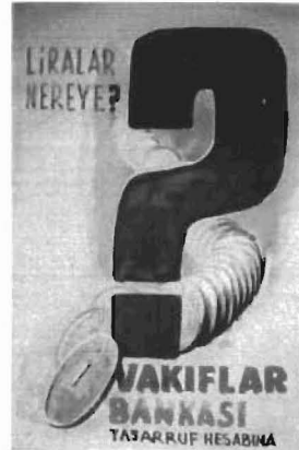
Resim 7: Bozuk paraların aynı şekilde istiflenmiş hali olan Vakıflar Bankası Afişi

Yine başka bir afişle genelleme yaptığımızda