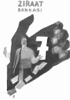
Resim 4: El ve ihtiyar figürlü afiş resmi

Hemen oracıkta yanımda taşıdığım profesyonel minolta fotoğraf makinesi ile üç afişin,ikişer poz fotoğraflarını çektim.