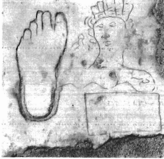
Resim 1: İzmir/Efes'te Selsus Kütüphanesinden Tiyatroya giderken 150 metre ilerde sol kaldırımında bulunan aşkevinin yerini tarif eden ilk afiş örneği.

Yurdumuzda bilinen ilk afiş örneği İzmir yakınlarında Selçuk ilçemize bağlı Efes'te Selsus Kütüphanesinden Tiyatro'ya giderken 150 metre ilerde, yaya kaldırım üzerine yere işlenmiş olan grafiksel işaretlerden oluşmuş afiştir. Bu afiş örneğinin anlamı; Efeste aşk evinin yerinin tanımını yapmaktadır.