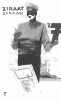
Resim 3: İhtiyar figürlü afiş resmi