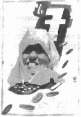
Resim 2: Kadın figürlü afiş resmi