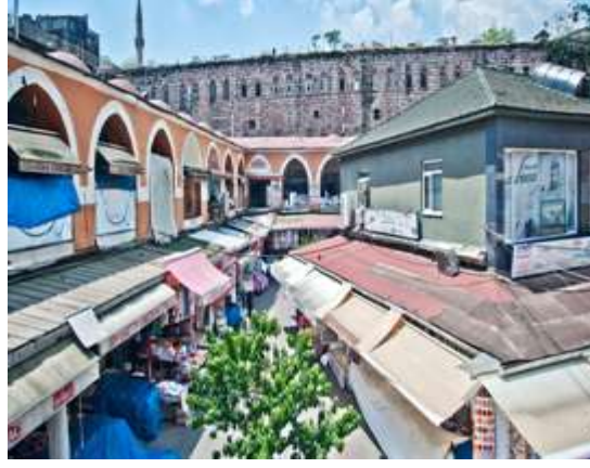
Şekil 3: Kürkçü Han (URL 1) (Shape 3: Kürkçü Han)