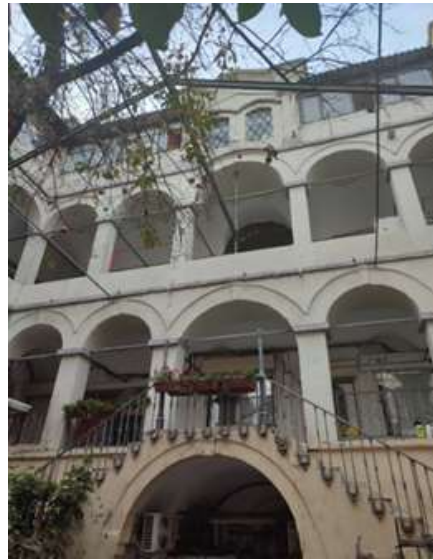
Şekil 6: Büyük Yıldız Han Merdivenleri (Ekşi,2022) (Shape 6: Büyük Yıldız Han's Stairs)

Han yapılarının avlularında gözlemlenen mimari hareketlilik ve estetik detayların aksine cepheler son derece sadedir. Taş ve tuğla karışımı cepheler hanların karakteristik özelliklerini oluşturmaktadır. Girişler cephede çıkıntı yapmayan sade açıklıklar olarak tasarlanmışlardır. 17. yüzyıl sonrası inşa edilen hanlarda bindirmelik gözlemlenir ve bu dönem sonrası hanların çoğunda bu öge mevcuttur. Plan eğrilikleri, üst kat cephelerinde taş konsollar üzerine oturan çıkmalar ile düzeltilerek cephe düzeni sağlanmıştır. Zemin katlarda dış cephe açıklıkları gözlemlenmemekle beraber, pek çok hanın dış cephesinde dükkânlar bulunmaktadır.