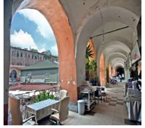
Şekil 4: Kürkçü Han (URL 1) (Shape 4: Kürkçü Han)