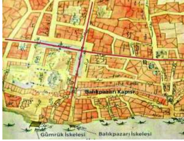
Harita 2: Mısır Çarşısı'nın iki antik aksın üzerinde konumlanması, (Map 2: The location of the Spice Bazaar on two ancient axes), (Kiper, 2022 referans alınarak yazar tarafından düzenlenmiştir), (Ekşi,2022).

Kara surlarından daha alçak ve dayanıksız olan Haliç kıyılarındaki surlar günümüzde mevcut değildir. Ancak o dönemde surların limana yakın olması, sur kapılarının her biri için ayrı iskelenin olması gibi nedenlerle, limana ulaşan malların sur içine aktarımı kolaylıkla sağlanmıştır (Hürel, 2005).