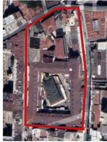
Plan 1: Kürkçü Han (Güran 1976), (Plan 1: Kürkçü Han), (Orijinal plan şeması ve günümüzdeki plan şeması görsel Google eart programından edinilmiştir).