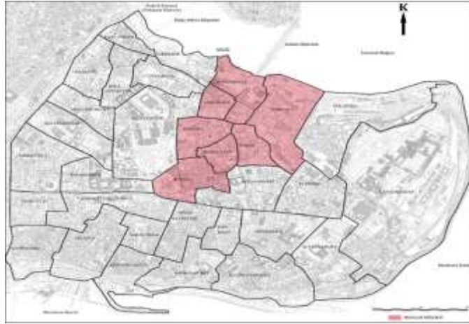
Harita1: Tarihi yarımada haritası ve hanlar bölgesi, çalışma alanı (Map1: Historical peninsula map and inns area, study area), (Ekşi,2022)

Hanlar Bölgesi; İstanbul tarihi Yarımada'nın Eminönü ilçesinde, Haliç limanından Beyazıt yönüne doğru uzanan aksın üzerinde konumlanan alandır. Rüstem Paşa, Tahtakale, Mercan, Sururi, Daya Hatun, Beyazıt mahallelerini kapsar (Harita 1).