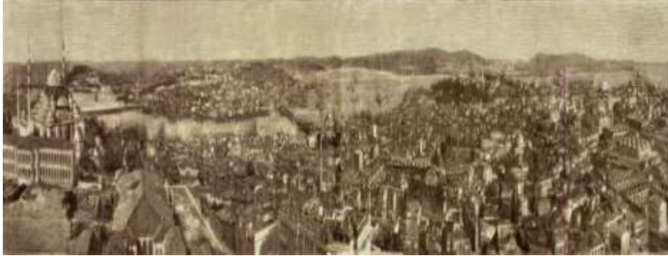
Şekil 1: 19.yüzyılda Hanlar Bölgesi'nin genel görünümü

19. Yüzyıl'da batılılaşma süreciyle birlikte ticaret işleyişte de değişiklikler meydana gelmiştir. 1945 yılında inşa edilen Galata köprüsü ile Eminönü-Galata arası ticari faaliyetler artmıştır (Şekil 1). Sanayileşmenin etkisiyle Sirkeci ve Galata'da yeni rıhtımlar, büyük boyutlu kağıt yapılar, depolar şehrin dokusunu epey değiştirmiştir. Han yapıları özellikle 17. ve 18. yüzyıl aralığında gelişiminin zirvesine ulaşmışlardır ancak XIX. yüzyıl başlarında duraklama dönemine girmiştir. Aynı yüzyılın sonu, 20. yüzyıl başında ise tamamen han dönemi kapanmıştır (Kuban, 2020), (Şekil 1).