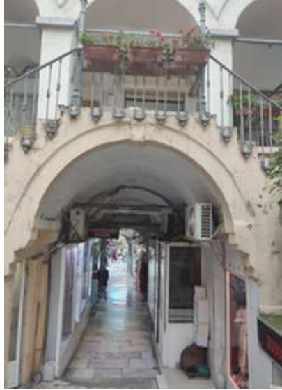
Şekil 5: Büyük Yıldız Han Girişi (Ekşi,2022) (Shape 5: Büyük Yıldız Han Entrance)

Han yapıları, avluyu dört bir yandan çevreleyen revaklı galeriler ve bu galerilere açılan mekanların oluşturduğu plan şemasına sahiptirler. Yapılara giriş, cephede kendini belli eden ancak abartılı olmayan taş kemerli açıklıktan avluya beşik tonoz ile bağlanan koridor ile sağlanmaktadır. Avlu kare veya düzgün dikdörtgen şeklindedir. Zemin katlar depo olarak işlevlendirilmiştir. Mekanların dışarıya açılan pencereleri yoktur. Zeminden üst kata revaklı galerinin girişine yakın konumda olan merdivenlerle ulaşılır. Üst katlar ikamet, büro amaçlı kullanılır. Her kat avluya bakar. Her katta revaklı galeriler mevcuttur. Genel olarak örtü sistemi kalın payeler üzerine oturan beşik tonozdur (Güran, 1978), (Şekil 5), (Şekil 6).