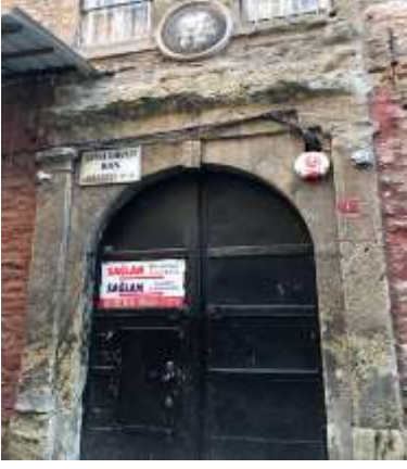
Şekil 2: Şeyh Davut Han (URL 1) (Shape 2: Şeyh Davut Han)