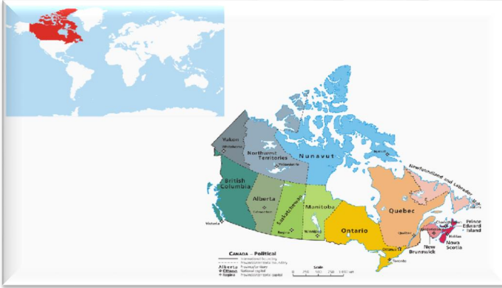
Şekil 1: Kanada Haritası **