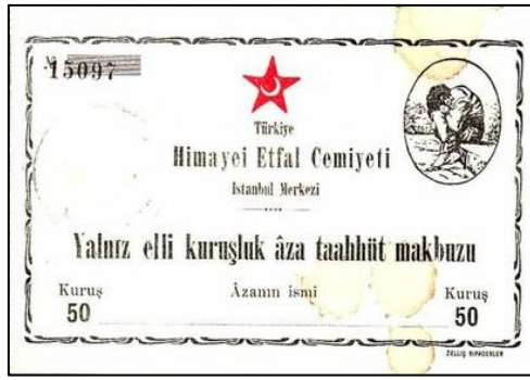
Şekil 1: Hazırlanan Himaye-i Etfal Cemiyetinin Yardım Pulları (Hâkimiyet-i Millîye Gazetesi, 23.5.1924, s.1) 3

“Millet Meclisimizle millî devletimizin Ankara’da ilk teşkil günü olan 23 Nisan Millî Bayramı, Cemiyetimizce çocuk günü olarak tespit edilmiştir. Bize yeni bir vatan ve yeni bir tarih yaratıp bırakan mübarek şehitlerle fedakâr gazilerin yavruları fakir ve ıstırapın evlatları ve nihayet alelittlak bütün muhtacı himaye-i vatan çocukları namına milletin şefkatli ve alicenap hissiyatına müracaat ediyoruz. Kadın, erkek, genç, ihtiyar hatta vakti ve hali müsait çocuklardan mini mini vatandaşlar için yardım bekliyoruz. Her sayfası başka bir şan ve başarı ile dalgalanan milletimizin, yarın azami derecede yardımlaşma göstermekle beraber, çocuk gününün adına yakışır şekilde neşeli ve parlak geçirilmesi için aynı derecede alaka ve destek göstereceğinden emin olan Himaye-i Etfal Cemiyeti, şimdiden şükranlarını arz eder” (Tarih ve Toplum Dergisi, 1987, s. 48).