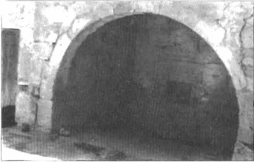
Resim 2: Bor Kale Mahallesi, Kezir Sokak'taki egme