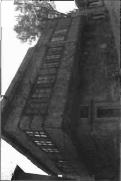
Resim 7. Hanagaşigil Evi