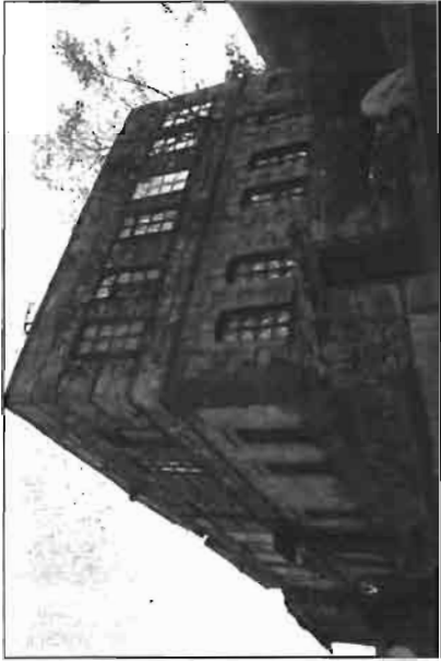
Resim 1. Mücceldiler Evi