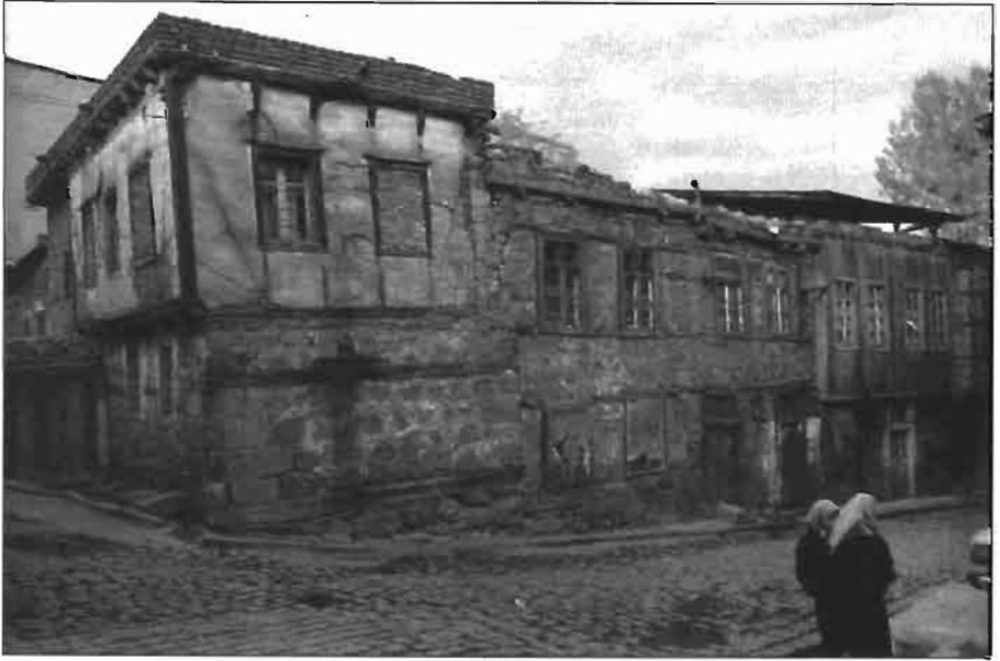
Resim 6. Namanlı Cami Çevresinde Evler