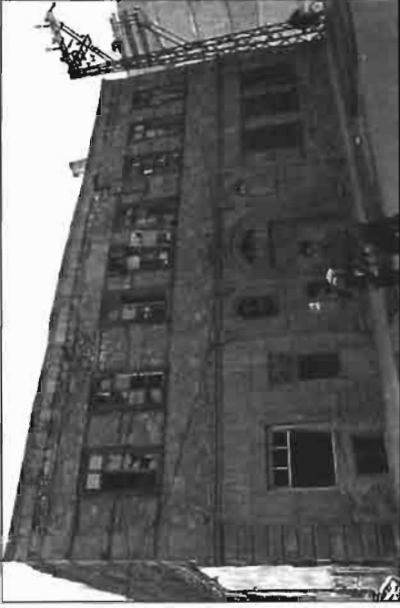
Resim 2. Alemdar Evi