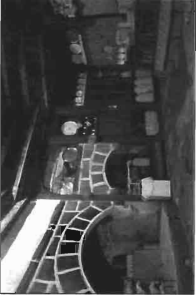
Resim 8. Hanagaşigil Evi'nde Tandırbaşı