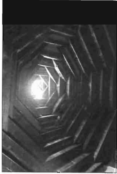
Resim 9. Hanagaşigil Evi Tandırbaşında Kırlangıç Örtü