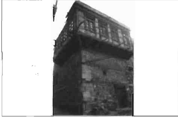
Resim 5. Zırmıklı Vehbi Bey Evi