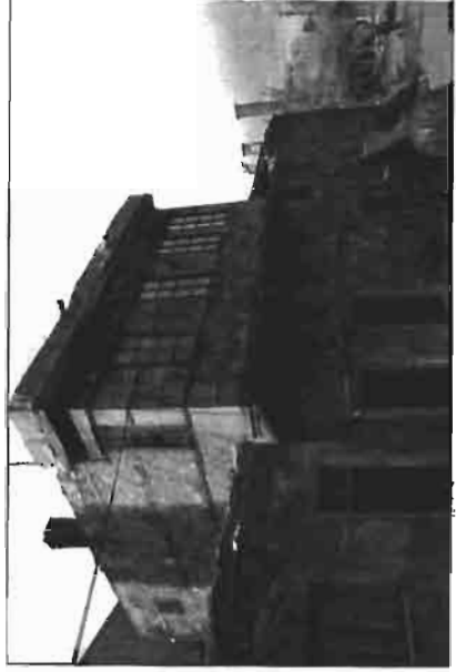
Resim 4. Yaşar İkizler