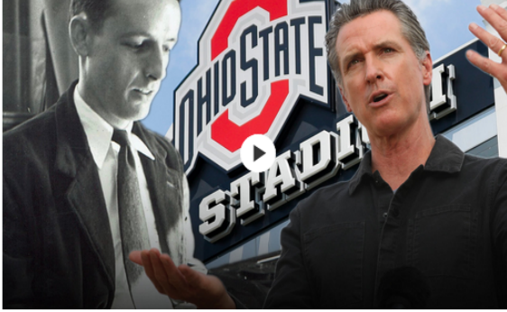
Journal Editorial Report: The week's best and worst from Kim Strezeel, Bill McGurn and Den Henninger.

6 Ekim 2020'de Amerikan Foreign Policy Journal "Türkiye'nin Dağlık Karabağ'daki vekil ordusu Suriyelilerden oluşuyor ..." başlıklı haberinde, Karabağ'a Azerbaycan saflarında savaşmak için Suriyeli paralı asker getirildiğini ve bunların dini propaganda ve para ile kandırılarak Karabağ'da savaşırıldıklarını iddia ederek şu iddialarda bulunmuştur: