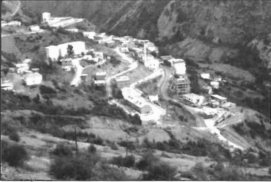
Resim -1 Kürtün İlçesi (Aşağı Bölümü)