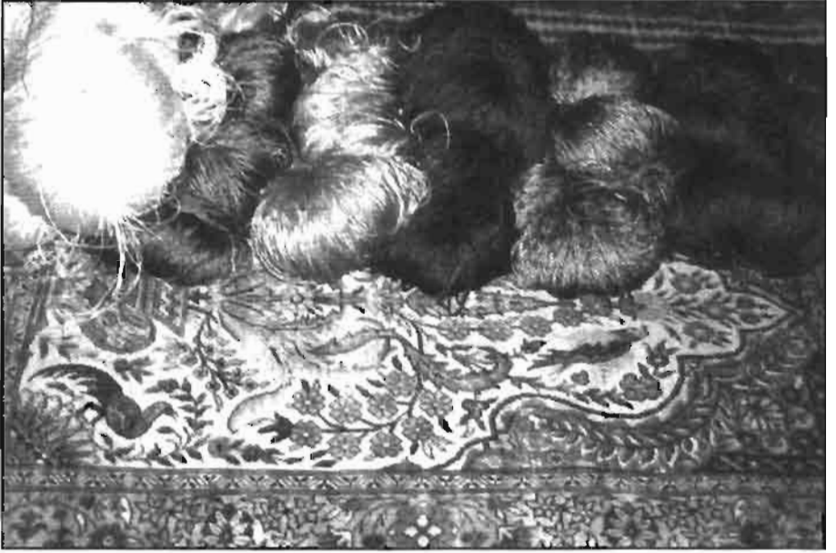
Resim -4 Kürtün'de Dokunan İpek Halıların Hammadesi İplikler ve Halı