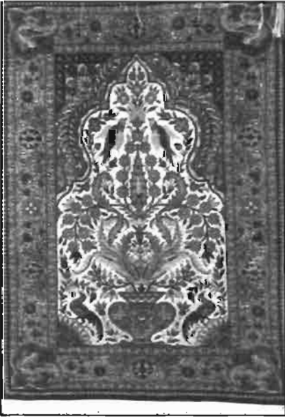
Resim -2 Kürtün'de Dokunmuş İpek Hali Seccade (60x120 cm)