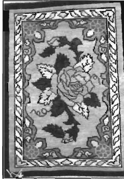
Resim -3 Kürtün'de Bardız Kilimi Desenleriyle Dokunmuş İpek Hali