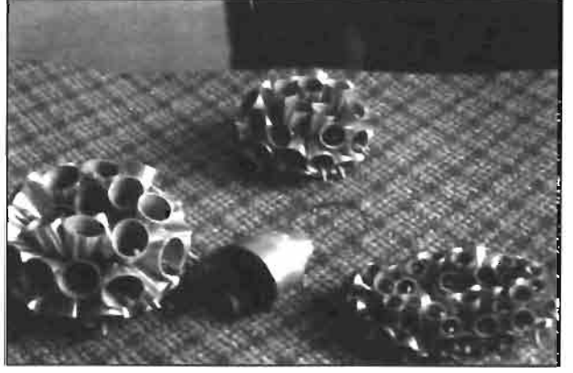
Resim 10: Kürtün'de retilen zillerden bir grnm.