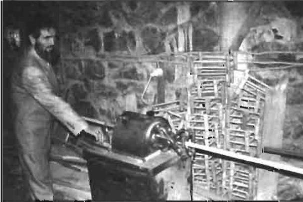
Resim 6: Oklava, sehpa, yürüteç üretiminden bir görünüm.