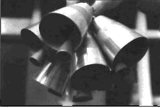
Resim 11: Kürtn'de retilen anlardan bir grnm.