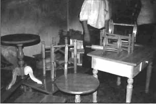
Resim 4: Ahşap atölyesinde üretile küçük mobilya türü eşyalar.