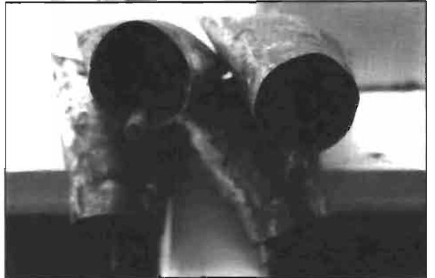
Resim 12: Kürtn'de retilen keleklerden bir grnm.