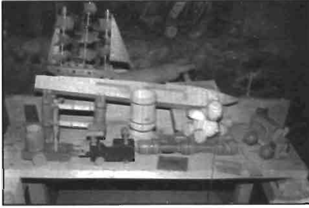
Resim 7: Atölyede üretile oyuncak ve süs eşyaları.