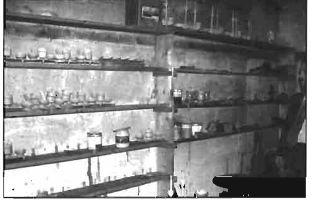
Resim 5: Atölyede üretile araç – gereçten bir görünüm.