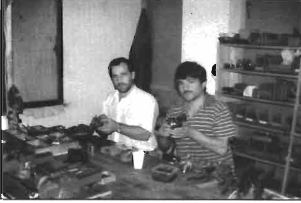
Resim 1: KÜSSAN'da silah üretimi yapılan atölyeden bir görünüş.