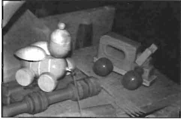
Resim 8: Atölyede üretile oyuncak, tarak ve çataldan bir görünüm.