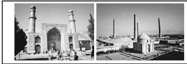
Resim 14-15: Solda Herat'ta Gazneliler tarafından inşa edilmiş (1201) olan Mescid-i Cuma, Sağda: Herat'da Timurular devrinde inşa edilen Musela Minareleri