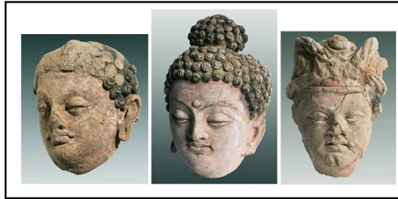
Resim 21-23: Mes Aynak'ta 2004 sonrası kazılarda ele geçen Budha başları MS 4-7. Asır. Kâbil Müzesi, Massodi, 2011