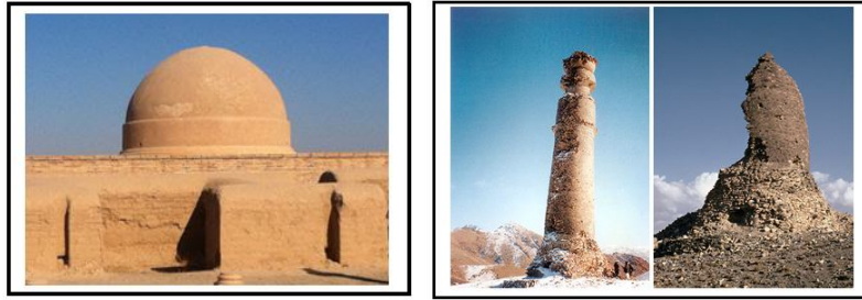
Resim 12-13: Solda: Afganistan-Özbekistan sınırında Amu Derya'nın kuzeyindeki Feyyaz Tepe'de bulunan MS I.Asra ait Budist stupası, İslâmî asırlardaki türbelere ilham kaynağı olmuş örneklerden biri. sağda: MS I. Asra ait Çakari Minaresi'nin saldırıdan önceki ve sonraki hâli