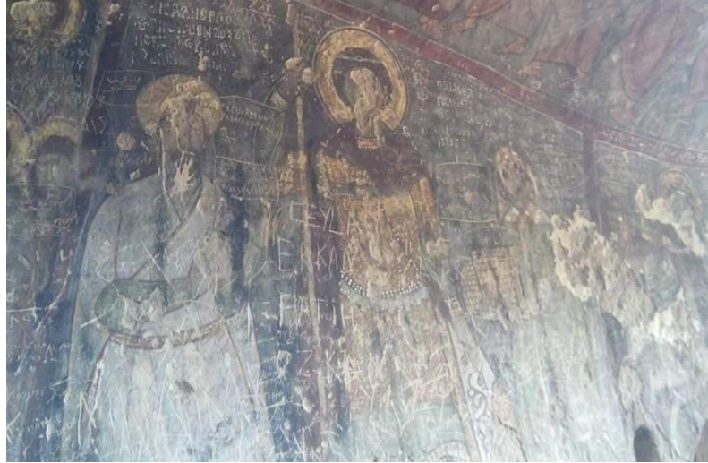
Şekil 4. Bağışçı Freskleri (Fotoğraf Çekimi Aralık 2022)