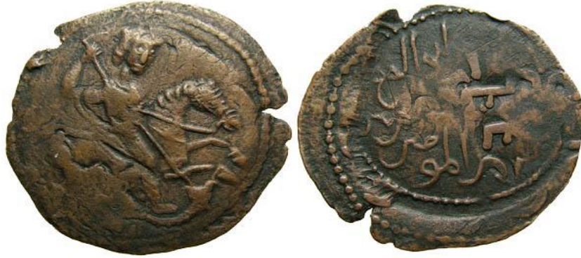
Şekil 5. At üzerinde elinde mızrakla ejderha öldüren Hagios Georgios Tasviri (Dânişmendli Emîri Nâsırüddin Muhammed'in bakır sikkesi)(Teoman ve Teoman, “Malatya’da Basılmış, Danişmendli ve Anadolu Selçuklu Sikkeleri”, 53.)

açısından da ortak değerlere sahip olmanın iki toplumu birbirine yakınlaştırdığı, Hristiyanlar ve Müslümanların ortak değerleri daha çok vurgulayarak bir arada yaşamı mümkün kıldıkları görülmektedir. 48