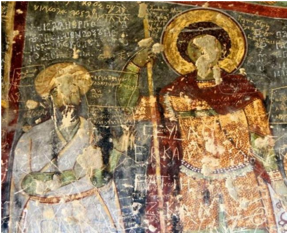
Şekil 3. Bağışçı Freskleri (Fotoğraf Çekimi Aralık 2022) 43

( https://www.kulturportali.gov.tr/turkiye/aksaray/gezilecekler/kirkdamalti-klisesi )