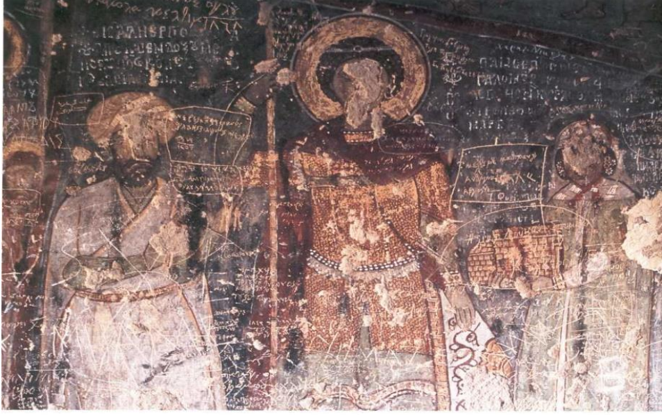
Şekil 2. Bağışçı Freskleri

( https://www.kulturportali.gov.tr/turkiye/aksaray/gezilecekler/kirkdamalti-klisesi )