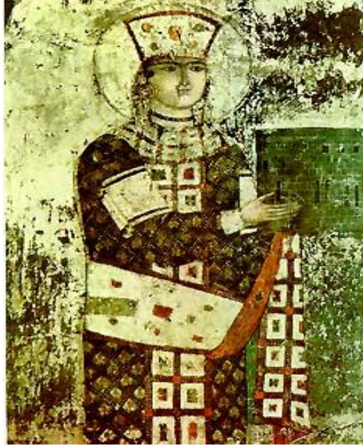
Şekil 6. Gürcü Kraliçesi Thamar'ın Vardzia'da (Gürcistan) Dormition Kilisesi'ndeki freski. ( https://jenikirbyhistory.getarchive.net/amp/topics/tamar+of+georgia )

Ayrıca Kraliçe Thamar'ın Gürcistan'ın Aspindza Bölgesinde, Kür Irmağının sol tarafında Vardzia Köyünde bulunan ve UNESCO dünya mirası listesinde yer alan kaya manastır kompleksindeki 1184-1186 yıllarında yapıldığı tahmin edilen Dormition Kilisesi'nde bir freskinin bulunması önemli bir ayrıntıdır. Bu freskle görülmektedir ki hem Gürcistan'da hem de Kapadokya bölgesinde iki Thamar neredeyse aynı duruşla başışçı olarak kiliselere resmedilmiştir. 54 Bu durum Kraliçe Thamar'ın Gürcü kadınları üzerinde sadece isim olarak değil uygulamalarıyla da örnek alındığını ve coğrafi mesafeye karşın kültürel hafızanın devamını göstermektedir.