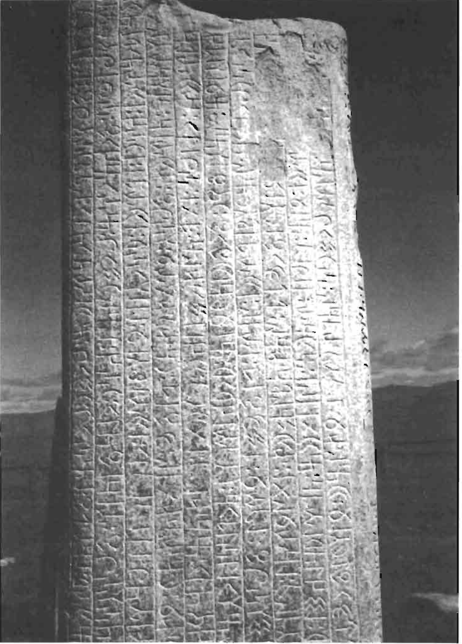
Resim : 2- Tonyukuk Anıtı'ndan ayrıntı (C. Alyılmaz'dan)