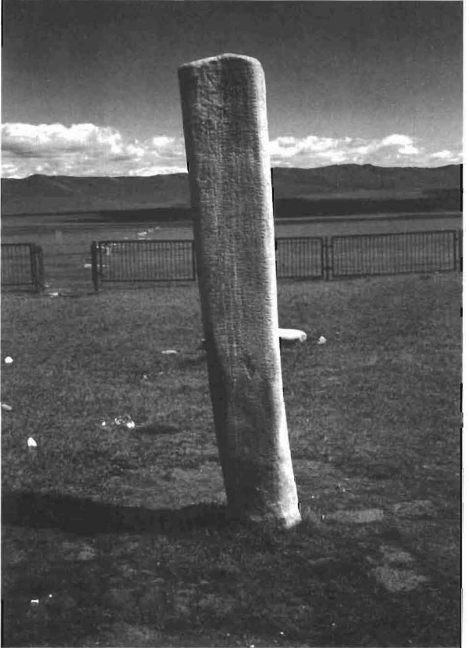
Resim : 1- Tonyukuk Anıtı (C. Alyılmaz'dan)