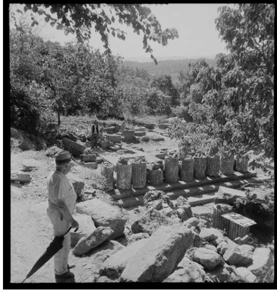
Fotoğraf 4: Prof. Dr. Axel Waldemar Persson Labraunda Kazısı'nda (1948).

Labraunda Antik Kenti'ne en yakın yerleşim yeri Kargıcak köyüdür. Ancak buradan Labraunda'ya ulaşan bir yol olmadığı için tüm kazı ekipmanlarının at ve eşeklerle taşınması gerekmiştir. Önce bir keşif gezisi yapılmış ve sekiz kişiden oluşan İsveçli ekip sahada, çadırlarda yaşamıştır. Bunun yanı sıra kazı faaliyetleri için 50 işçi istihdam edilmiştir. Haziran ve temmuz aylarında çalışmalar yoğun bir şekilde devam etmiştir. Kazının maliyeti 40.000 İsveç kronu olmuştur. 85