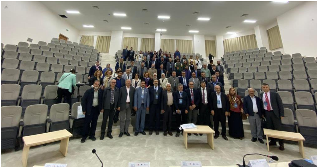
Görsel 6. Sempzoyum katılımcıları