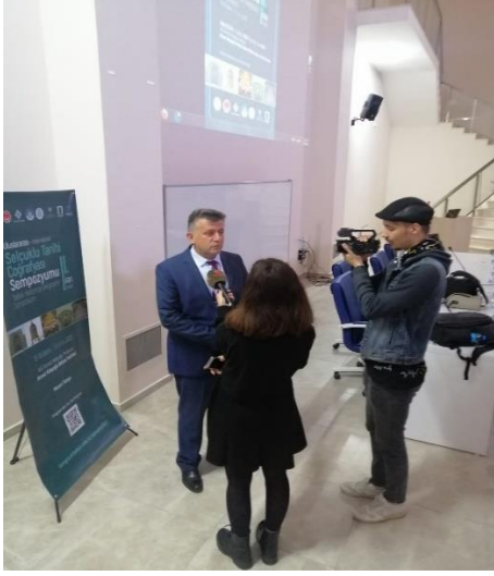
Görsel 1. Sempozyumun basın açıklaması