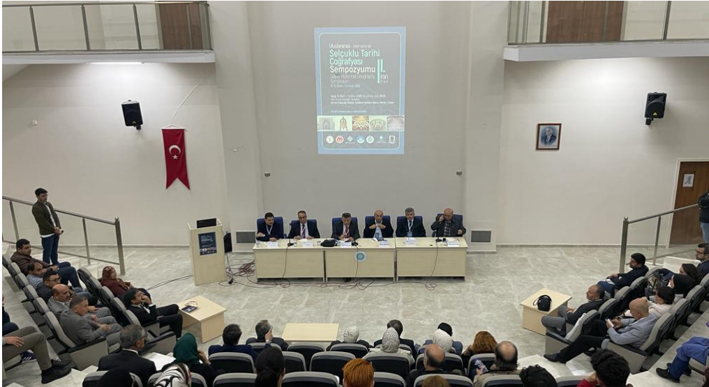
Görsel 5. Kapanış oturumu