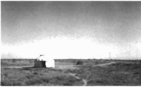
Resim 4 : Otrar-Kızılorda arası bir kazak çadırı ve cöbanlar.