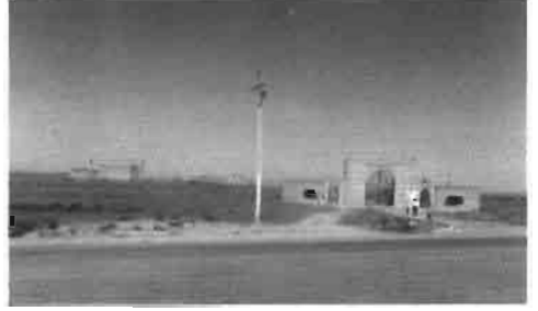
Resim 6 : Türkistan'da bir mezarlık ve türbeler.