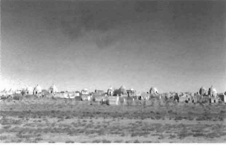
Resim 17 : Kızılıorda girişindeki şehir mezarlığı.