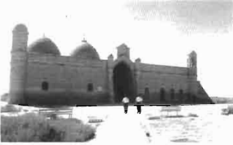
Resim 7 : Türkistan'da Hoca Ahmet Yesevi'nin hocası Arslan Baba Türbe-Zaviyesi.