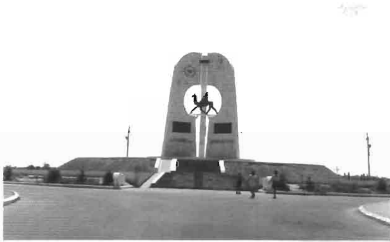
Resim 18 : Kızılıorda'da Siriderya Nehri kıyısındaki Korkut Ata Anıtı.