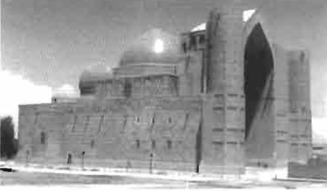
Resim 10 : Hoca Ahmet Yesevi Külliyesi batı cephesi.