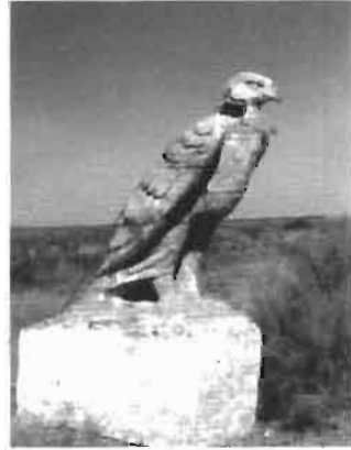
Resim 16 : Şiyeli Avdanı'nda yörede kutsal sayılan Bürküt (Hüma) kuşu heykeli (T. Parlak'tan)