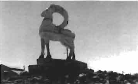
Resim 12 : Janakorgan'da bir dağ keçisi heykeli (T. Parlak'tan)