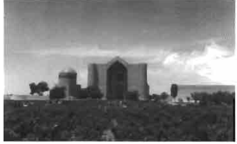
Resim 9 : Yesi'deki Hoca Ahmet Yesevi Külliyesi ve önü (Sağda korugan, solda Begüm Sultan Türbesi).