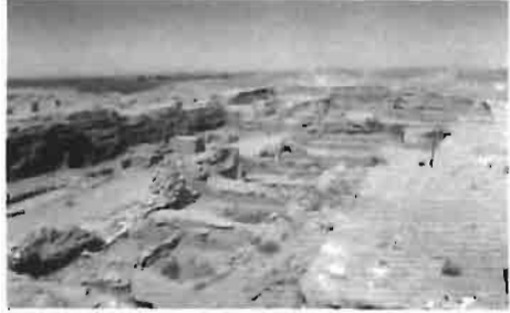
Resim 3 : Otrar kazı alanından bir görünüm.