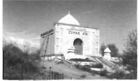
Resim 14 : Sığanak Koruganı yanındaki Sunak Ata Türbesi.