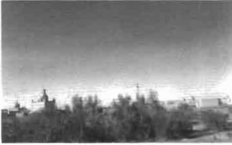
Resim 15 : Kızılorda'ya bağlı Şiyeli yakınlarındaki Okcu Baba Mezarlığı.