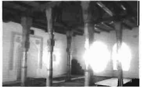
Resim 8 : Arslan Baba Türbe-Zaviyesinden mescidin içi.