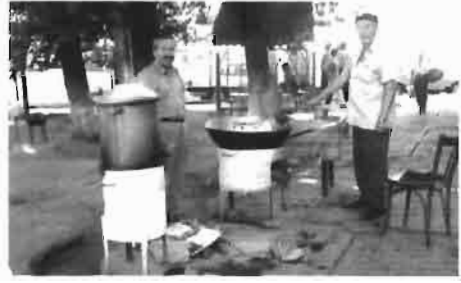
Resim 1 : Çimkent'te Özbek pilavı pişiren bir lokantacı.