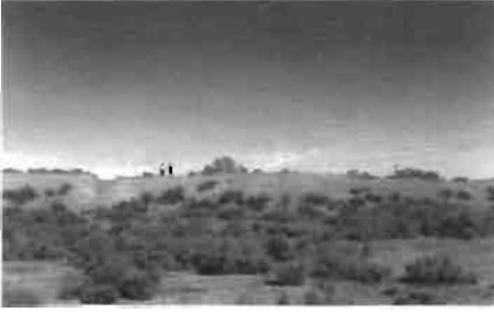
Resim 13 : Sığanak Koruganı'nda yaptığımız incelemeden bir görüntü.