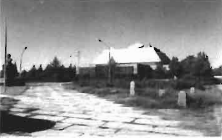
Resim 5 : Farabi Müzesi (Solda Farabi'nin büstü, sağda balballar)