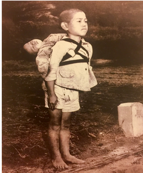
Fotoğraf 2: Joseph Roger O'Donnell /Nagasaki, 1945. https://www.globalsistersreport.org

Bölgede yaşayan bireylerin maruz kaldıkları ırksal ayrımcılık metin göstergelerinin aktardığı söyleme gönderme niteliğindedir. Fotoğrafçı kimlik, çekim noktaları ve çekim açıları bakımından av ve avcı gözünden konuyu çerçevelerken ırkçı tutum da anlam karmaşasında okunabilmektedir. Bölgedeki ekonomik ve sosyal adaletsizlik, yaşam kalitesinin düşüklüğü, insan hakları ihlali gerekçeleriyle bölge insanının mevcut krizlerden etkilenmesi ve çocukların ölüm/yaşam arasındaki çizgide kalması görsel anlatıda gözlemlenmektedir. Fotoğrafçının öteki olarak sunduğu beden; toplumsal cinsiyet, etnik kimlik ve örtük ırkçı söylemin ifadesini oluştururken fotoğrafı okuyan kitlelerin gözünde yabancılaştırılmış bir topluluk ve uzak bir bölgenin teması imkansız kılan yardım çağrışımları, mevcut söylemin ara detaylarını oluşturmaktadır.