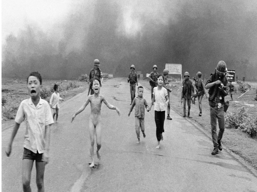
Fotoğraf 5: Nick Ut Cong Huynh /Napalm Kızı, 1972. http://news.bbc.co.uk

kavramına yönelik korku duyulan ve insanların çekindiği bir kimliğinin yeniden tanımlandığı görülmektedir. Polise (güvenlik birimlerine) duyulan güvenin ve imajın olumlu noktaya dönüştüğü bir anın tasviri konu edilmektedir. Çocuğun ellerini birleştirip sevgi dolu duruşu karşısında polis memurunun çocuğa doğru eğilirken otoriteden ve katı duruştan uzaklaştığı ve şefkat dolu duruşuyla bir başka kimliğe dönüşümü aktarılmaktadır.