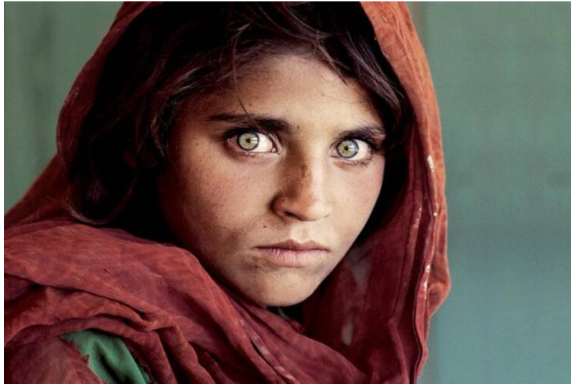
Fotoğraf 3: Steve McCurry /Afgan Kızı, 1984. https://publicdelivery.org