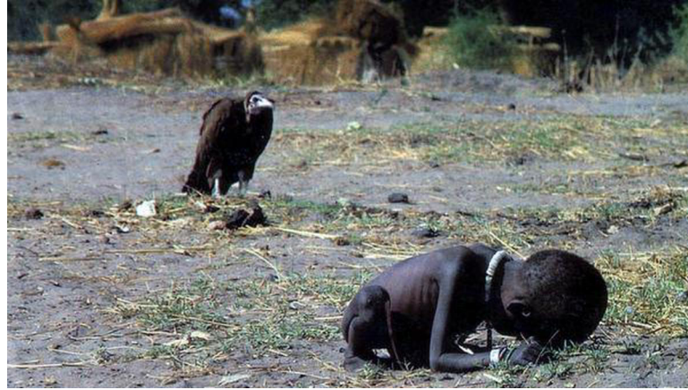
Fotoğraf 1: Kevin Carter /Akbaba ve Çocuk, 1994.