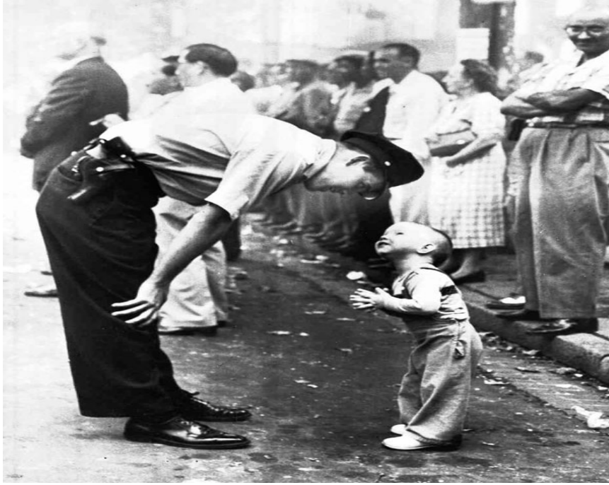
Fotoğraf 4: William C. Beall /İnanç ve Güven, 1958. https://tr.pinterest.com

Fotoğraf milyonlarca zorunlu göç eden insanların yaşadığı ruh halinin en yalın temsili olmakla birlikte hesap soran ve onu buna zorlayan (karşısında olduğunu ve gözlerinin içine baktığı) otoriteye bir başkaldırış ve hesaplaşma içindedir. Genç Afgan kız, kendini güzel ve özenli göstermekten çok yaşadığı travmanın kendisindeki fiziksel görünümünü kitlelere aktarmaktadır.