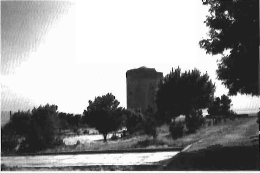
Resim 1 : Nahcivan Mümüne Hatun Kümbeti'nin genel görüntüsü.