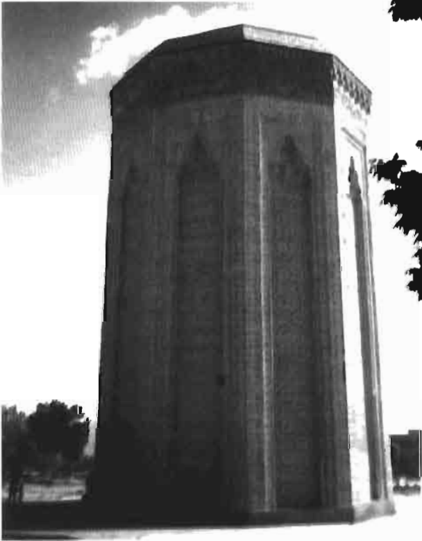
Resim 2 : Nahcivan Mümüne Hatun Kümbeti'nin yakından görünüşü.