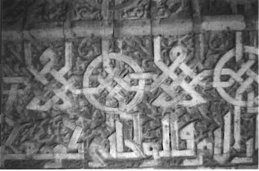
Resim 3 : Kumbetin yüzeylerinde yer alan çiçekli Kufi yazılardan bir ayrıntı.