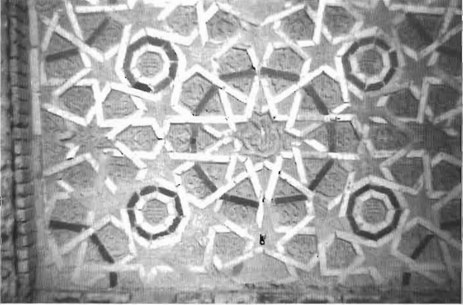
Resim 4 : Çini ve tuğla süslemelerinden bir ayrıntı.