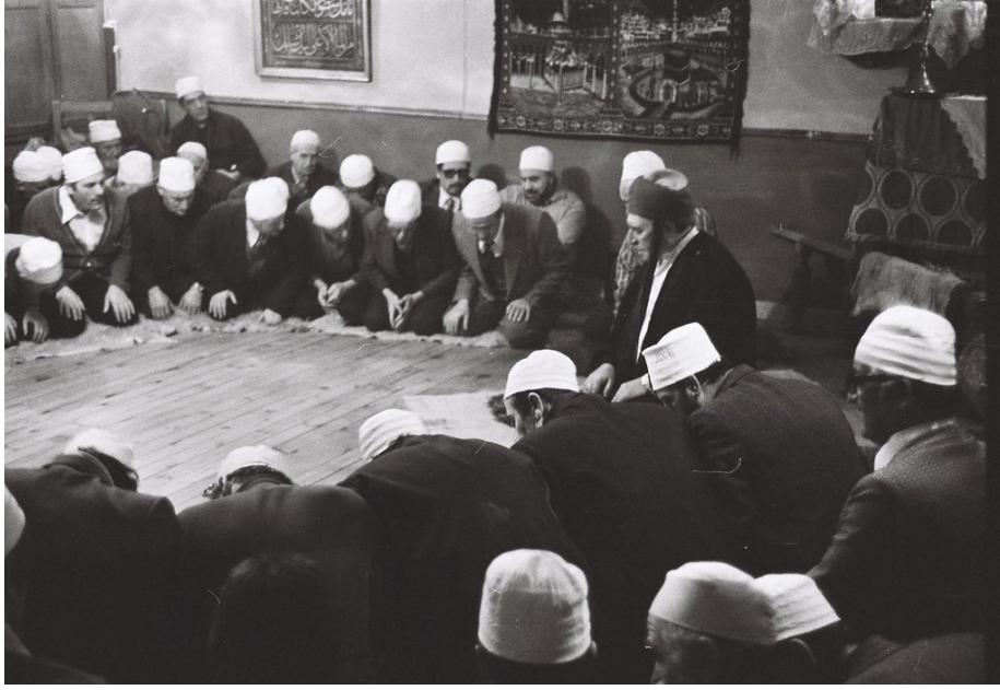
Fotoğraf 1: Kelime-i Tevhid Zikri Esnâsında 15

yüzüncü “Lâ ilâhe illâllah” çekildikten sonra denebilmektedir.