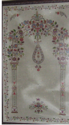
Fotoğraf 7: Konya Sahip Ata Vakıf Müzesinde bulunan keçe seccade.

Keçe Seccade 7: Konya Sahip Ata Vakıf Müzesinde bulunan ve Konya Şemsi Tebrizi Camiinden getirilen keçe seccade, 19. yüzyıla ait olup, 90x153 cm. ölçülerindedir. (Fotoğraf 7) Doğal krem renkli ince keçe üzerinde çeşitli renklerde iplerle işleme tekniğinde yapılmış, iki sütunla taşınan yüksek kemerli gösterişli bir mihrap nişi bulunmaktadır. Sütunların kaideleri ve lale şeklindeki başlıkları detaylı bir şekilde belirtilmiştir. Mihrap kemeri kıvrım dallar üzerinde çeşitli şekillerde çiçeklerle süslenmiştir. Tepede alem niyetine büyük bir çiçek demeti bulunmakta, mihrap içine doğru damla şeklinde iri bir stilize kandil sarkmaktadır. Mihrap köşeliklerinde birer dal ucunda çiçek motifleri, ayaklık kısmında vazo içinde iri bir çiçek demeti yer almaktadır. Seccadenin etrafını bir sıra zikzak dal üzerine işlenmiş çiçek, yaprak, meyve motiflerinin yer aldığı bordür çevirmektedir.