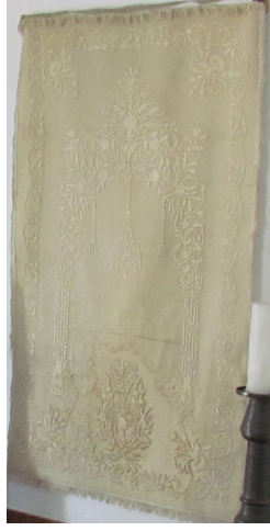
Fotoğraf 11: Budapeşte’deki Gül Baba Türbesinde bulunan keçe seccade.

Keçe Seccade 11: Budapeşte’deki Gül Baba Türbesinde bulunan 19. yüzyıla ait keçe seccadede, doğal krem renkli ince keçe üzerine, keçeyle aynı tonda krem renkli iplerle dival tekniğinde desenler işlenmiştir. (Fotoğraf 11) Ortada ince sütunlarla taşınan ve bitkisel motiflerden oluşan çok zarif bir mihrap motifi, kenarlarda bir sıra halinde bitkisel karakterli bordür ve altta büyük bir çiçek demeti yer alır. Bordürün dört köşesinde içe doğru çiçek demetleri uzanır. Mihrap tepesinden aşağı doğru sarkan büyük bir asma kandil ve yanlarda daha küçük ölçülerde askılar yer alır. 21 Bu seccadenin çok benzeri Konya Etnoğrafya Müzesinde bulunan 2609 envanter numaralı keçe seccadedir. Bu seccade de doğal krem renkli olup üzerindeki bitkisel desenlerden oluşan mihrap motifi de, zeminle aynı krem-sarı renkli çamaşır ipeği ipe ve dival tekniğinde yapılmıştır. 22 Etrafı bir sıra saçakla çevrilmiştir.