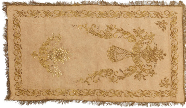
Fotoğraf 14: Ankara Vakıf Eserleri Müzesinde bulunan keçe seccade. (Fotoğraf müze arşivi)

Keçe Seccade 14: Ankara Vakıf Eserleri Müzesinde bulunan 1252 envanter numaralı İnebolu Tevfikiye Camiinden getirilen, 19. yüzyıla ait keçe seccadede, sarı sim ve altın tellerle dival tekniğinde yapılmış bitkisel desenlerden oluşan bir mihrap kemeri ile ayaklık kısmında iri dallar arasında bir vazoda içerisinde çiçek demeti ve bir sıra kenar bordürü bulunmaktadır. (Fotoğraf 14) Mihrap kemeri, kıvrım dal ve üzerinde çeşitli çiçeklerden oluşmaktadır. Tepe kısmında, ayaklık kısmındaki çiçek buketinin aynısı bulunmaktadır. Tepeden mihrap içine doğru süslü bir kandil sarmaktadır. Köşeliklerde birer adet küçük çiçek buketleri yer almaktadır. Sarı simden bir sıra saçakla çevrilidir.