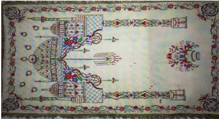
Fotoğraf 5: Konya Etnoğrafya Müzesinde bulunan 6030 envanter numaralı keçe seccade (Emine Nas-Şerife Doğan'dan)

Keçe Seccade 4: Konya Etnoğrafya Müzesinde bulunan 19. yüzyıla ait, 5076 envanter numaralı keçe seccade 95x156 cm. ölçülerindedir. (Fotoğraf 4) Doğal krem renkli tepme keçe üzerine dival işi, Türk işi ve süzeni teknikleri ile desenler işlenmiştir. Sütunlarla taşınan bir mihrap ve mihrap kemeri üzerinde dört minareli bir cami tasviri bulunmaktadır. Mihrap tepesinden aşağıya doğru ikisi küçük, biri büyük 3 adet kandil motifi sarkmakta, ayaklık kısmında vazo içinde bahçe çiçeklerinden oluşan bir buket yer almaktadır. Etrafı sarı renkli ipek saçakla çevrelenmiştir. 19