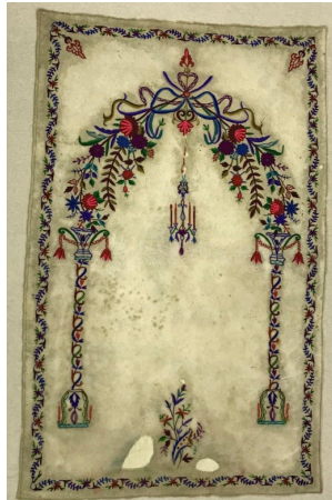
Fotoğraf 8: İstanbul Vakıflar Halı Müzesinde bulunan keçe seccade. (Fotoğraf müze arşivi)

Keçe Seccade 7: Konya Sahip Ata Vakıf Müzesinde bulunan ve Konya Şemsi Tebrizi Camiinden getirilen keçe seccade, 19. yüzyıla ait olup, 90x153 cm. ölçülerindedir. (Fotoğraf 7) Doğal krem renkli ince keçe üzerinde çeşitli renklerde iplerle işleme tekniğinde yapılmış, iki sütunla taşınan yüksek kemerli gösterişli bir mihrap nişi bulunmaktadır. Sütunların kaideleri ve lale şeklindeki başlıkları detaylı bir şekilde belirtilmiştir. Mihrap kemeri kıvrım dallar üzerinde çeşitli şekillerde çiçeklerle süslenmiştir. Tepede alem niyetine büyük bir çiçek demeti bulunmakta, mihrap içine doğru damla şeklinde iri bir stilize kandil sarkmaktadır. Mihrap köşeliklerinde birer dal ucunda çiçek motifleri, ayaklık kısmında vazo içinde iri bir çiçek demeti yer almaktadır. Seccadenin etrafını bir sıra zikzak dal üzerine işlenmiş çiçek, yaprak, meyve motiflerinin yer aldığı bordür çevirmektedir.