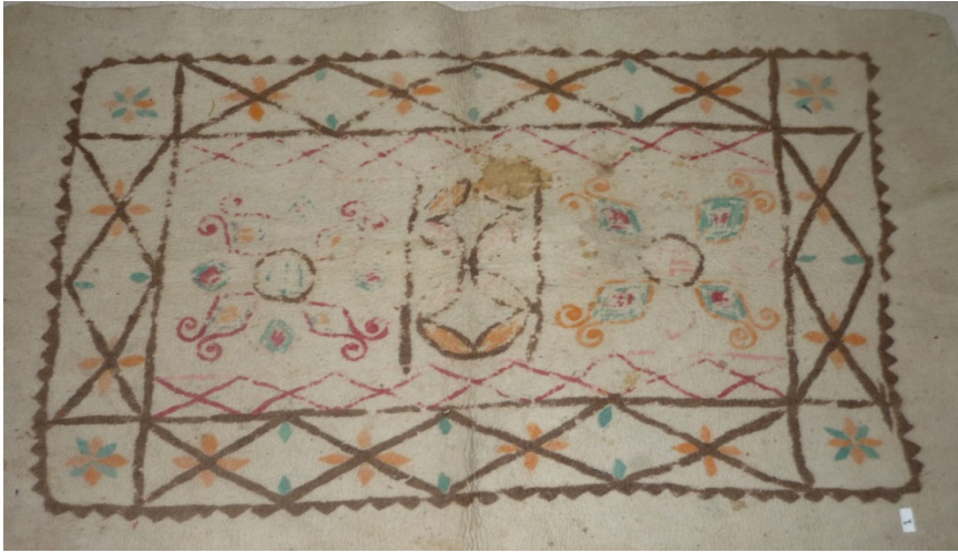
Fotoğraf 18: Bursa Üftade Tekkesinde bulunan keçe seccadede.

bir mihrap kemeri yer almaktadır. 24 Yine aynı müzede bulunan 4063 envanter numaralı keçe seccadede sütunların olduğu yerde birer şamdana benzer motif yapılmışsa da, bunlar taşıyıcı değildir. Sadece mihrabı temsilen bitkisel motiflerden oluşan bir mihrap kemeri bulunmaktadır. Bu örnekte sarı kılıptan kullanılan yerler dival tekniğiyle yapılmıştır. 25 İstanbul Çamlıca'da bulunan İslam Medeniyetleri Müzesindeki Milli Saraylar Koleksiyonuna ait 157/633, 157/634 ve 157/629 numaralı keçe seccadelerde de, sütunsuz bir mihrap kemeri bulunmaktadır. 157/629 numaralı seccade renkli iplerle işleme tekniğinde, 157/633 numaralı seccade sarı sim veya metal iplerle dival tekniğinde, 157/634 numaralı seccade pembe renkli ipele dival tekniğinde yapılmışlardır. 157/633 ve 157/634 numaralı seccadelerin desenleri aynıdır.