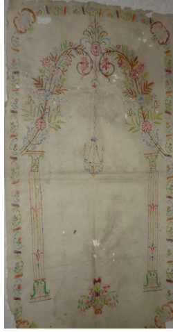
Fotoğraf 9: Bursa Üftade Tekkesinde bulunan keçe seccade.

Keçe Seccade 9: Bursa Üftade Tekkesinde bulunan 19. yüzyıla ait seccadede doğal krem renkli ince keçe üzerine kırmızı, yeşil, mavi, mor, turuncu renkli iplerle mihrap motifi işlenmiştir. (Fotoğraf 9) Mihrap, iki ince sütun üzerine oturan, karşılıklı simetrik, üzerinde çeşitli çiçekler ve yapraklar olan iki kıvrım dalın yer aldığı mihrap kemerinden oluşur. Mihrap kemerinin tepesinde yuvarlak bir çiçekten çıkan kıvrık yaprakların bulunduğu bir demet, bu çiçekten aşağı doğru sarkan üç zincirle bağlı bir asma kandil yer alır. Kandilin üzerinde iki adet zarif mum bulunur. Mihrap nişinin ayaklık kısmında vazo içerisinde simetrik olarak yerleştirilmiş çeşitli çiçekler yer alır. Mihrabı taşıyan sütunların kaide ve başlıkları simetriktir. Seccadeyi bitkisel hatlı bir sıra bordür çevirir.