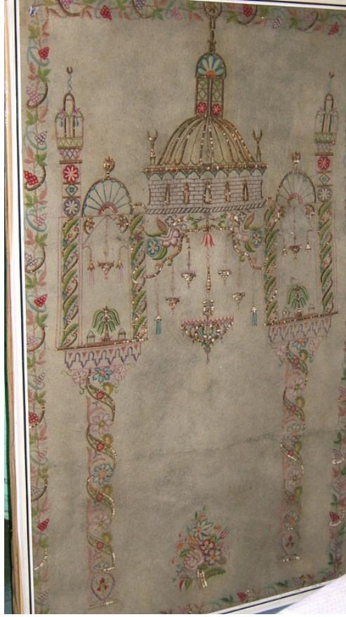
Fotoğraf 1: Bursa Üftade Tekkesinde bulunan keçe seccade.

Keçe Seccade 1: Bursa Üftade Tekkesinde bulunan 19. yüzyıla ait örnekte yünün doğal rengi olan krem renkli ince keçe üzerine çeşitli renklerde ipler ve altın telli iplerle, bitkisel desenler ve cami tasvirinin yer aldığı bir mihrap motifi işlenmiştir. (Fotoğraf 1) İki burmalı sütunla taşınan mihrap kemerinin tepesinden, niş içine doğru ortada bir adet büyük, yanlarda ikişer adet küçük, 5 adet kandil, en kenarda da birer küçük askı sarmaktadır. Ayak kısmında ise lale, şakayık, rozet çiçekleri ve kıvrık yapraklardan oluşan bir demet yer alır. Çiçek ve yapraklar sütunlara sarılarak yükselmiş ve sütunlara burmalı görünümünü vermiştir. Sütun başlıklarının mukarnaslı olduğu farkedilmektedir. Sütunların ve mihrap kemerinin üstünde yer alan cami, üç sahnı bir iç mekâna sahiptir. Sütunların üstüne gelen yan sahnılar dar, kubbenin altına gelen orta sahnı geniştir. Orta sahnı üzerini örten kubbe, yüksek kasnaklı ve dilimlidir. Kasnakta pencereler bulunur. Kenarları sütunlarla kaplanmış yan sahnıların tepesinden de birer kandille ikişer askı sarmaktadır. Zemin kısmında palmiyeye benzeyen birer ağaç, üstlerinde kubbe ve alemler bulunur. En dıştaki sütunların üzerinde şerefe ve külahıyla birer minare tasvir edilmiştir. Seccadenin etrafını bir sıra dal, yaprak ve üzüm salkımlarından oluşan bordür çevirir. Gerek cami ve gerekse çiçeklerin üslubundan 19. yüzyıla ait olduğu anlaşılmaktadır. 17