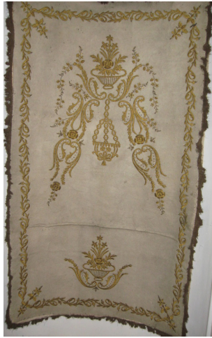
Fotoğraf 15: İstanbul Üsküdar Özbekler Tekkesinde bulunan keçe seccade.

Keçe Seccade 14: Ankara Vakıf Eserleri Müzesinde bulunan 1252 envanter numaralı İnebolu Tevfikiye Camiinden getirilen, 19. yüzyıla ait keçe seccadede, sarı sim ve altın tellerle dival tekniğinde yapılmış bitkisel desenlerden oluşan bir mihrap kemeri ile ayaklık kısmında iri dallar arasında bir vazoda içerisinde çiçek demeti ve bir sıra kenar bordürü bulunmaktadır. (Fotoğraf 14) Mihrap kemeri, kıvrım dal ve üzerinde çeşitli çiçeklerden oluşmaktadır. Tepe kısmında, ayaklık kısmındaki çiçek buketinin aynısı bulunmaktadır. Tepeden mihrap içine doğru süslü bir kandil sarmaktadır. Köşeliklerde birer adet küçük çiçek buketleri yer almaktadır. Sarı simden bir sıra saçakla çevrilidir.