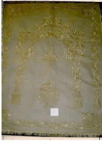
Fotoğraf 12: İstanbul Vakıflar Halı Müzesinde bulunan keçe seccade.

Keçe Seccade 11: Budapeşte’deki Gül Baba Türbesinde bulunan 19. yüzyıla ait keçe seccadede, doğal krem renkli ince keçe üzerine, keçeyle aynı tonda krem renkli iplerle dival tekniğinde desenler işlenmiştir. (Fotoğraf 11) Ortada ince sütunlarla taşınan ve bitkisel motiflerden oluşan çok zarif bir mihrap motifi, kenarlarda bir sıra halinde bitkisel karakterli bordür ve altta büyük bir çiçek demeti yer alır. Bordürün dört köşesinde içe doğru çiçek demetleri uzanır. Mihrap tepesinden aşağı doğru sarkan büyük bir asma kandil ve yanlarda daha küçük ölçülerde askılar yer alır. 21 Bu seccadenin çok benzeri Konya Etnoğrafya Müzesinde bulunan 2609 envanter numaralı keçe seccadedir. Bu seccade de doğal krem renkli olup üzerindeki bitkisel desenlerden oluşan mihrap motifi de, zeminle aynı krem-sarı renkli çamaşır ipeği ipe ve dival tekniğinde yapılmıştır. 22 Etrafı bir sıra saçakla çevrilmiştir.