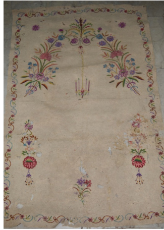
Fotoğraf 17: İstanbul Vakıflar Halı Müzesinde bulunan keçe seccade (Fotoğraf müze arşivi)

Keçe Seccade 16: İstanbul Vakıflar Halı Müzesinde bulunan 19. yüzyıla ait, 308 envanter numaralı, 157x98 cm. ölçülerindeki, İstanbul Fatih Camiinden getirilmiş olan keçe seccadede, üçerden altı adet çiçek demetinin oluşturduğu mihrap kemerinin temsil ettiği mihrap nişi bulunmaktadır. (Fotoğraf 16) Niş tepesinde alem niteliğinde bir çiçek demeti, buradan aşağı sarkan ikili askı, kemerin başlangıç noktalarından sarkan ikişer adet üçlü askı ve ayaklık kısmı ile köşeliklerde birer demet çiçek yer alır. Seccadeyi bir sıra kıvrım dal, yaprak ve çiçeklerden oluşan bitkisel desenli bordür çevirir.