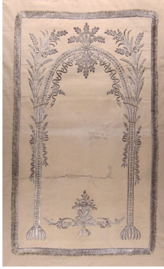
Fotoğraf 13: İstanbul Vakıflar Halı Müzesinde bulunan keçe seccade.

üzerine, sarı renkli sim veya metal iplerle dival tekniğinde desenler işlenmiştir. (Fotoğraf 12) Zeminde ince sütunlarla taşınan süslü bir mihrap motifi, kenarlarda bir sıra halinde zikzak dal üzerinde ince yaprak ve çiçeklerden oluşan bordür ve altta vazo içerisinde büyük bir çiçek demeti yer alır. Bordürün dört köşesinde içe doğru çiçek demetleri uzanır. Sütunların kaideleri kafes şeklinde dekore edilmiştir. Mihrap kemeri ince kıvrım dallar, çiçekler ve yapraklarla süslüdür. Mihrap tepesinden aşağı doğru sarkan büyük bir asma kandil ve yanlarda daha küçük ölçülerde askılar yer alır. Müzede aynı özelliklere sahip 4 adet keçe seccade daha bulunmaktadır.