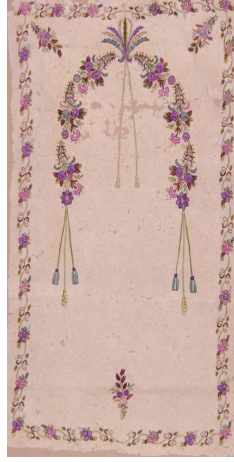
Fotoğraf 16: İstanbul Vakıflar Halı Müzesinde bulunan keçe seccade

Keçe Seccade 16: İstanbul Vakıflar Halı Müzesinde bulunan 19. yüzyıla ait, 308 envanter numaralı, 157x98 cm. ölçülerindeki, İstanbul Fatih Camiinden getirilmiş olan keçe seccadede, üçerden altı adet çiçek demetinin oluşturduğu mihrap kemerinin temsil ettiği mihrap nişi bulunmaktadır. (Fotoğraf 16) Niş tepesinde alem niteliğinde bir çiçek demeti, buradan aşağı sarkan ikili askı, kemerin başlangıç noktalarından sarkan ikişer adet üçlü askı ve ayaklık kısmı ile köşeliklerde birer demet çiçek yer alır. Seccadeyi bir sıra kıvrım dal, yaprak ve çiçeklerden oluşan bitkisel desenli bordür çevirir.