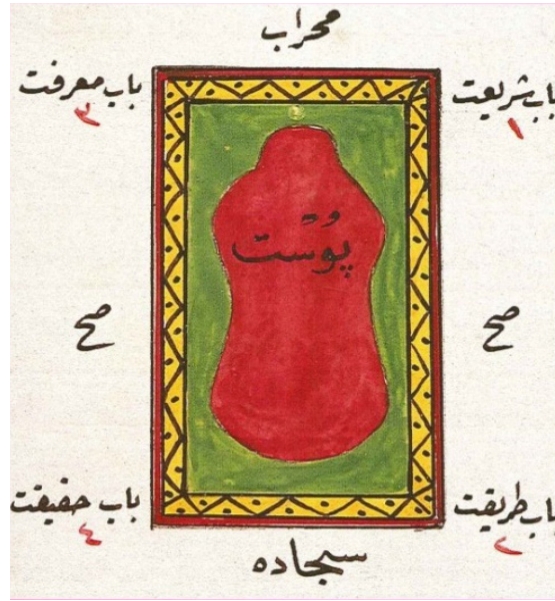
Çizim 1: Seccade Üzerinde Post. (Nurhan Atasoy'dan)

Agâh Efendi, “postun aslı hakkında bazı rivayetler vardır” demektedir. İbrahim’in oğlu İsmail’i kurban ederken “Cebrail tarafından İsmail’in yerine gönderilen koç, Âdem’in oğlu Habil’in tövbesinin karşılığında adadığı ve Allah katında kabul edilip göğe çıkan koçtur” diyerek böylece postun kutsallık kazandığını ve post üzerine oturmanın İbrahim ve İsmail’in sünneti olduğunu açıklamaktadır. 7