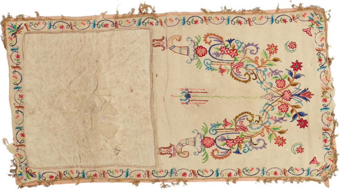
Fotoğraf 6: Ankara Vakıf Eserleri Müzesi'nde bulunan 174 envanter numaralı keçe seccade

İkinci Grupta yer alan süslü sütunlarla taşınan mihrap nişinin olduğu örnekler, sayı olarak diğerlerine göre daha fazladır.