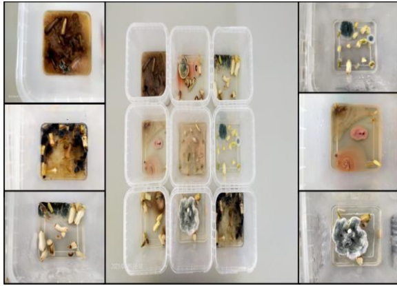
Şekil 4. Soğancıklarda fungus oluşumu

olarak değiştirilmiştir. Bu durumu takiben 10'uncu hafta sonunda soğancıkların gövdeleri endojenik olarak kaynaklandığı düşünülen yoğun fungus oluşumları ile kaplı olduğu görülmüştür (Şekil 4).