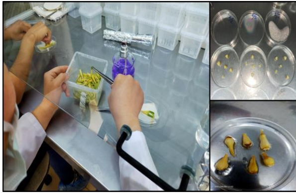
Şekil 2. Muş lalesinin pistlin organın kültüre alınması

Besin ortamlarının sterilizasyonu dijital kontrollü otoklav ile 121°C ve 1.2 atm. basınç altında 20 dk. süreyle yapılmıştır. Otoklavdan çıkarılan besin ortamları laminar hava akışlı kabin içerisinde katılaşmasından hemen önce steril petri kaplarına (90 x 17 mm) 40'ar ml. olarak dağıtılmıştır. Her petride 5'er adet eksplant olacak şekilde tüm kombinasyonlar 3'er tekrar halinde hazırlanmıştır (Şekil 2).