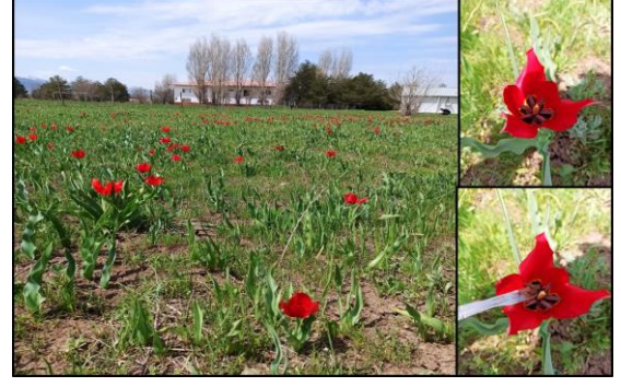
Şekil 1. Doğal yayılış alanında Muş lalesi

Ülkemizde, doğal olarak yetişen 15 lale ( Tulipa spp.) türü bulunmaktadır. Dünyada sadece Anadolu'ya endemik olan Muş lalesi, Muş ili dışında Erzurum, Ağrı, Kahramanmaraş, Gaziantep, Siirt ve Hakkâri'de yetişmektedir. Ancak en büyük popülasyon alanları Muş ve Bulanık ovalarıdır. Muş ovasında bahar mevsimi başlangıcı Nisan ayı sonu ile Mayıs ayı başlarında topraktan çıkarak çiçeklenmektedir. Ancak bu çiçeklerin 15-20 gün süren kısa bir ömrü vardır. Doğal yaşam ortamı genellikle tarlalar ve çayırlıklardır. Muş lalesi, doğal görünüşüyle kültür lalelerinden çok daha gösterişlidir (Koyuncu ve Tekin, 2003) (Şekil 1).