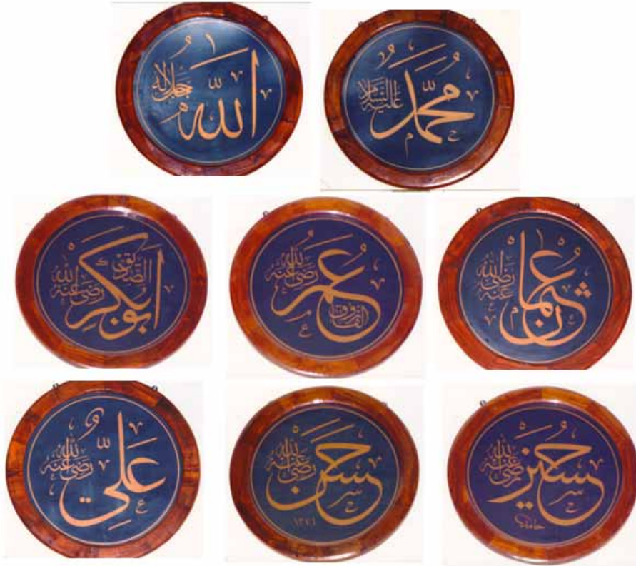
Foto-2: İsm-i Celâl, İsm-i Nebî, Çihâr-ı Yâr, Hasan ve Hüseyin Levhaları.