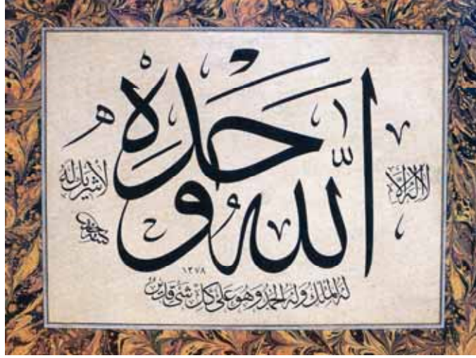
Foto- 6: Hâmit Aytaç'ın Evâsıt Dönemi Eseri (Hamit Aytaç Anma Paneli Kitabından)