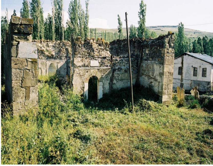
Foto.3- Şarkışla Hardal Köyü Camisi'nin Kuzey Cephesi.