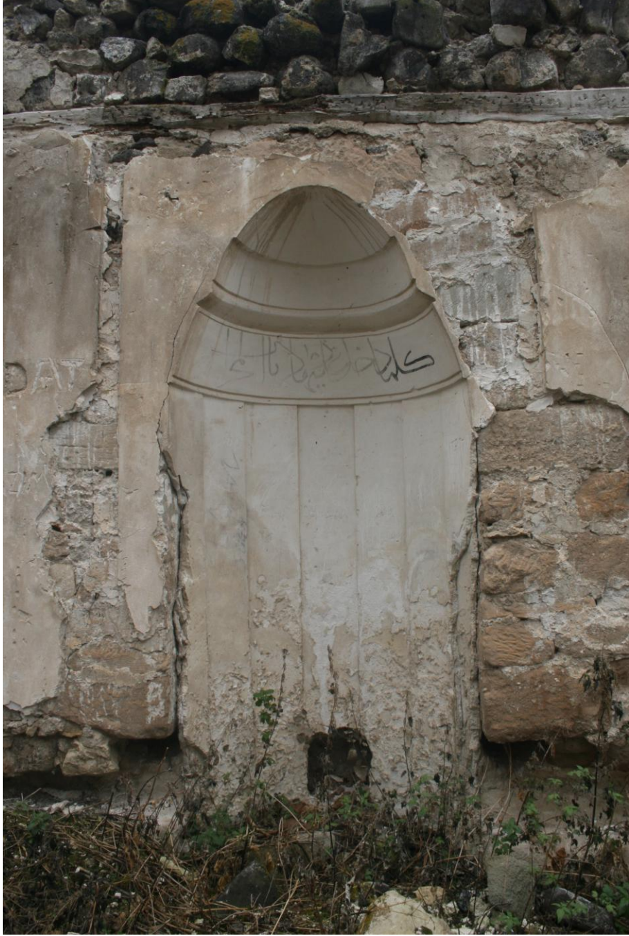
Foto.5- Şarkışla Hardal Köyü Camisi'nin Mihrabı.