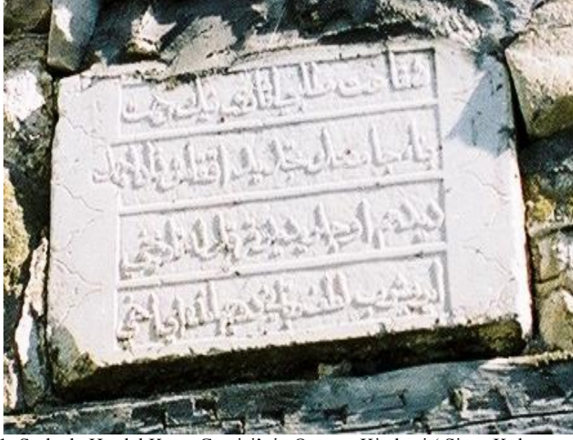
Foto.1- Şarkışla Hardal Köyü Camisi'nin Onarım Kitabesi