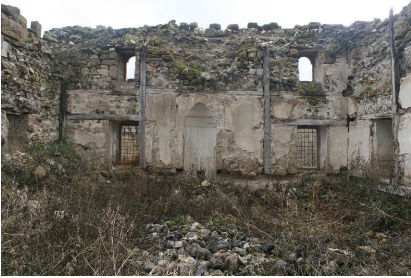
Foto.4- Şarkışla Hardal Köyü Camisi'nin İç Mekânı.