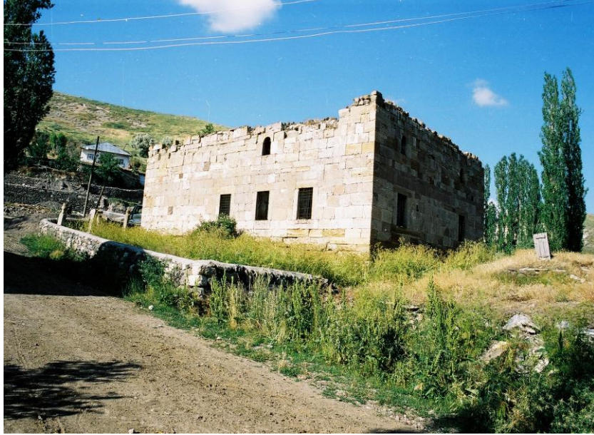
Foto.2- Şarkışla Hardal Köyü Camisi'nin Genel Görünüşü.