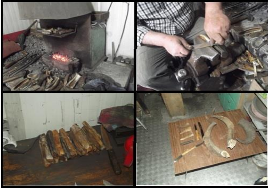
Fotoğraf 3: Hayvan boynuzlarından imal edilen kemik sap üretim aşamaları

Kemik sap ise keçi, sığır ve manda gibi hayvanların boynuzları kullanılarak yapılmaktadır. Geleneksel Sivas yapımı bıçaklar arasında hayvan boynuzu kullanılarak yapılan bıçaklardır ve müşteri tarafından tercih edilen bir bıçak türüdür. Yapımı ve işlenmesi bakımından diğer saplara oranla hem zahmetli hem de bulunması daha zordur. Kemik saplar gösterişli olduğundan dolayı sadece cep bıçaklarında ve sipariş üzerine özel olarak üretilen hançer ve kılıçlarda kullanılır. Bıçak yapımında kullanılacak boynuz, içindeki özünün yaş olması nedeniyle herhangi bir işleme tabi tutulmadan belirli bir süre kurumaya bırakılması gerekir. Aksi halde hayvandan yeni çıkarılan boynuzdan yapılacak sap kısa süre içinde eğrilerek kullanılmaz hale gelir. Bu yüzden kemik sap işlemi tam olarak kurumuş boynuzun öncelikle ocakta defalarca ısıtılıp mengeneyle sıkıştırılıp tesviye edilmesi ve son olarak çarka vurularak sap şekli verilmesiyle tamamlanır ( Fotoğraf 3).