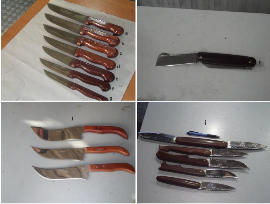
Fotoğraf 6: Sivas'ta imal edilen bıçak çeşitlerinin bir bölümü a-Kesim Bıçağı(Kurban), b-Kasap Bıçağı, c-Kıyma Bıçağı, d-Ekmek Bıçağı, e- Yüzme Bıçağı, f- Salata Bıçağı, g- Meyve Bıçağı, h-aşı bıçağı, ı-av bıçağı ve i-cep bıçakları