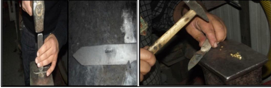
Fotoğraf 5: Bıçağın namlusuna soğuk damga ile isim çakılması ve perçinleme işlemi

bıçağın ağzı açılır ve bilenir. Son aşamada ise çarka takılan çaputlar kullanılarak çelik parlatma işi yapıldıktan sonra bıçak ağzının son kez keskinleştirilmesi ile ağızda kalan küçük bozuklukların iye taşında ya da kılağı makinesinde giderilmesi ile bıçak kullanıma hazır hale gelir.