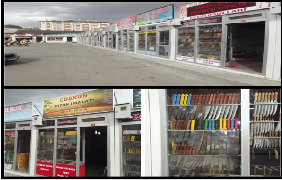
Fotoğraf 1: Sivas şehrinde bıçak imalatı ve satışı yapan işyerleri bıçakçılar çarşında hizmet vermektedir

işlemden sonra namlusunun takılmasının ardından çarkta boyanarak son şeklini almaktadır (Fotoğraf 2).