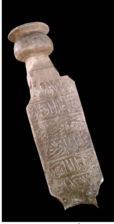
Huve'l-Hallâku'l-Bârî Yahyâhî Ağanın oğlu Merhûm ve Mağfûr Veli Ağa rûhuna Bihurmeti'l-fâtiha Sene 1207

7 Nolu Mezar: Bu mezarın, 'Âişe adındaki bir kadına ait olduğu üzerindeki yazıttan anlaşılmaktadır. Mezarın alt kısmı toprak altında kaldığı için mezar tipi belirlenememiştir. Mezar taşı tipi olarak dikdörtgen planlı olup gövde kısmı aşağıdan yukarıya doğru hafif genişleyerek yükselmekte ve ters v şeklinde son bulmaktadır. Başlık tipi cami tasvirli mezar taşları içerisinde yer alır 4 . Ters v şeklinde son bulan gövdenin tepelik kısmı bir minare motifi ile ortadan ikiye bölünmüştür. Tepeliğin sol bölümüne, üç kademeli ve kabartma tekniğinde kubbe ile örtülü bir cami yerleştirilmiştir. En alt kademede ortada giriş, yanlarda pencere açıklıkları görülür. Üç açıklık da yuvarlak kemerli olarak işlenmiştir. Giriş açıklığı, iki kanatlı işlenirken iki yandaki pencerelerin içerisi baklava motifleri ile dolgulanmıştır. Aynı pencere uygulaması ikinci kademede iki ve son olarak da bir adet açıklık olarak devam ettirilmiştir. Kubbe dilimli olarak tasvir edilmiştir. Caminin solunda külah örtülü iki katlı bir mimari tasvir daha yer alır. Buranın bir