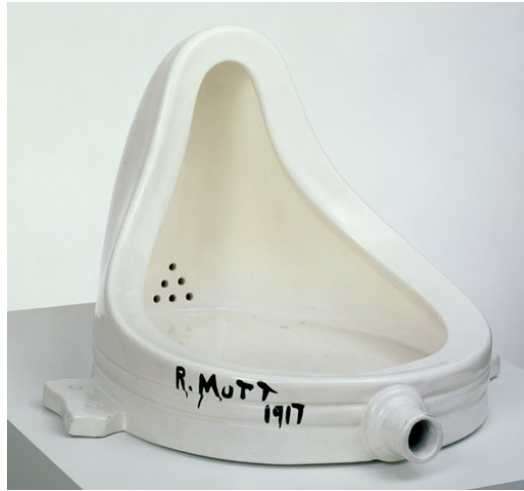
Foto. 4: Marcel Duchamp, Fountain, 1917 http://www.sfmoma.org/explore/collection/artwork (Erişim tarihi:Nisan2012)

Her ne kadar farklı ve hazır malzeme Picasso ile görülse de, Duchamp'ın Dadaizm etkisinde yapmış olduğu Ready Made eserler ile ilk defa bu kadar çok gündeme gelmiştir. Dumhamp'ın 'M. Rutt, 1917' imzalı Pisuar'ının ortaya çıkması ile beraber seramikte ürüne bakış tamamı ile değişmiştir. Burada hazır nesne sanat eserinin bir parçası değil birebir kendisi olmuştur.