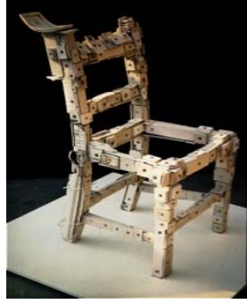
Foto. 6: Paul Astbury, Chair I, 1984 httpwww.paulastbury.co.uk (Erişim tarihi:Nisan2012)

ürünlerin üzerine seramik eklemeler yapan ilk sanatçılardan biri olarak karşımıza çıkmıştır.