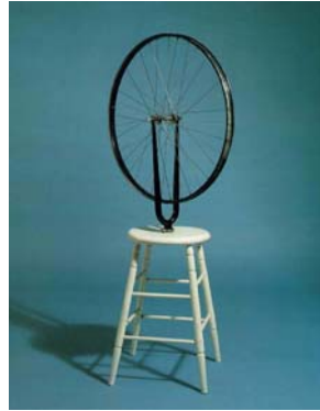
Foto. 2: Marcel Duchamp, Bicycle Wheel, 1913 httpwww.beatmuseum.orgduchampbicycle.html (Erişim tarihi:Nisan2012)

Sanatta kullanılan geleneksel malzemenin dışında, hazır ürün nesnelerin kullanımı ilk defa o dönemde Marcel Duchamp ile estetik değer kazandığı kabul edilmesine rağmen, Duchamp hazır nesnelere estetik kaygı ile yaklaşmaması gerektiğini savunmaktadır. “Daha 1913’te bisiklet tekerleğini mutfak taburesine takmak ve onun dönüşünü seyretmek gibi eşsiz bir düşünceye kapılmıştım... (Batur, 1997: 322) diyen Duchamp aynı zamanda ready-made çalışmaları için “...aynı andaki tam bir zevklilik ya da zevksizlik yokluğuyla... aslında tam bir uyumsuzluk olgusuyla uygunluk içinde olan görsel bir kayıtsızlık üstünde temelleşti.”(Batur, 1997: 322) demektedir.