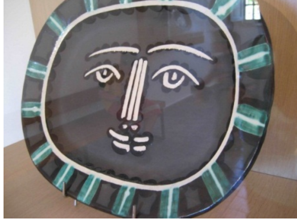
Fotoğraf 3: Pablo Picasso, Seramik Tabak httpkansehri.blogspot.com200707picasso.html (Erişim tarihi:Nisan2012)

Her ne kadar farklı ve hazır malzeme Picasso ile görülse de, Duchamp'ın Dadaizm etkisinde yapmış olduğu Ready Made eserler ile ilk defa bu kadar çok gündeme gelmiştir. Dumhamp'ın 'M. Rutt, 1917' imzalı Pisuar'ının ortaya çıkması ile beraber seramikte ürüne bakış tamamı ile değişmiştir. Burada hazır nesne sanat eserinin bir parçası değil birebir kendisi olmuştur.