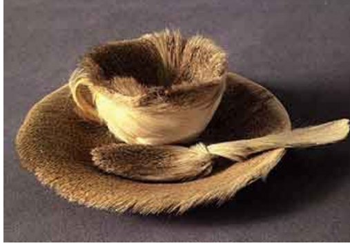
Foto. 1: Meret Oppenheim, “Kürkle Kaplı Fincan ve Tabağı”, 1923 http://www.surrealists.co.uk/oppenheim.php ,(Erişim tarihi:Mayıs 2012)

Sanatta kullanılan geleneksel malzemenin dışında, hazır ürün nesnelerin kullanımı ilk defa o dönemde Marcel Duchamp ile estetik değer kazandığı kabul edilmesine rağmen, Duchamp hazır nesnelere estetik kaygı ile yaklaşmaması gerektiğini savunmaktadır. “Daha 1913’te bisiklet tekerleğini mutfak taburesine takmak ve onun dönüşünü seyretmek gibi eşsiz bir düşünceye kapılmıştım... (Batur, 1997: 322) diyen Duchamp aynı zamanda ready-made çalışmaları için “...aynı andaki tam bir zevklilik ya da zevksizlik yokluğuyla... aslında tam bir uyumsuzluk olgusuyla uygunluk içinde olan görsel bir kayıtsızlık üstünde temelleşti.”(Batur, 1997: 322) demektedir.