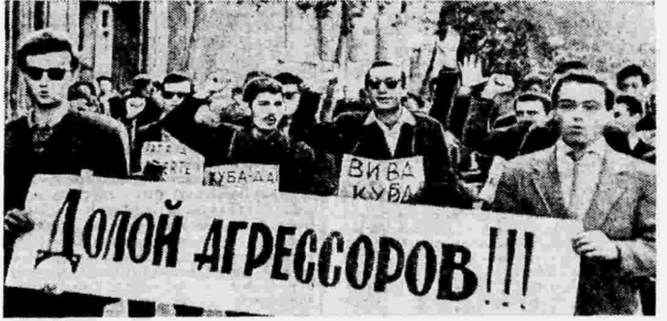
Şekil 7. ABD'nin Küba Cumhuriyeti'ne yönelik saldırgan eylemlerini protesto amacıyla Bakü'de Öğrenci Gösterisi Düzenlenmiştir (Pravda , 1962).