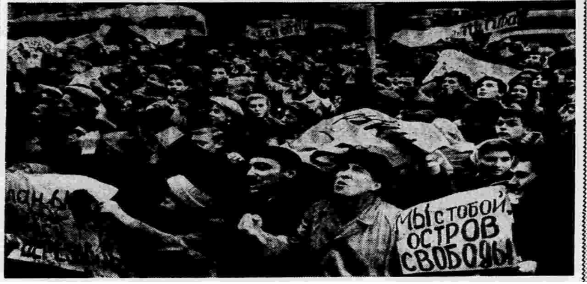
Şekil: 6. Moskova’da ABD Büyükelçiliğinin Karşısında Küba’ya Destek Mitingi (Pravda , 1962).

Miting İkinci Dünya Savaşında olduğu gibi Küba Krizinde etkili bir yöntem olarak kullanılmıştır. 26 Ekim tarihinde çıkan haberde ise: BM Genel Sekreteri U Thant’a N. KRUŞÇEV’in cevabı: ‘Sayın U Thant, Talebinizi aldım ve burada yer alan teklifi dikkatlice inceledim. Girişiminizi memnuniyetle karşılıyorum. Karayip Denizi’ndeki durumla ilgili endişelerinizi anlıyorum, çünkü Sovyet Hükümeti de bu durumu çok tehlikeli buluyor ve Birleşmiş Milletler ‘in acil müdahalesini gerektiriyor. (Pravda , 1962)