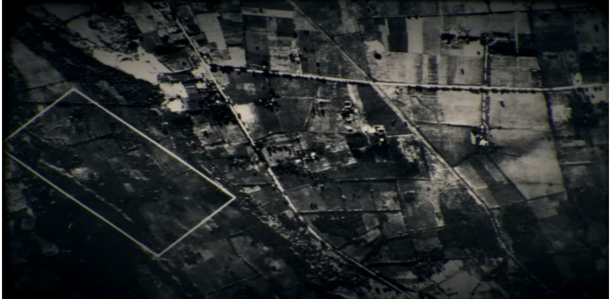
Şekil 1: ABD İstihbaratının Küba'da Çektirdiği İlk Fotoğraf- 'Rusların Futbol Meydanı' (Enstitüsü, 2022)