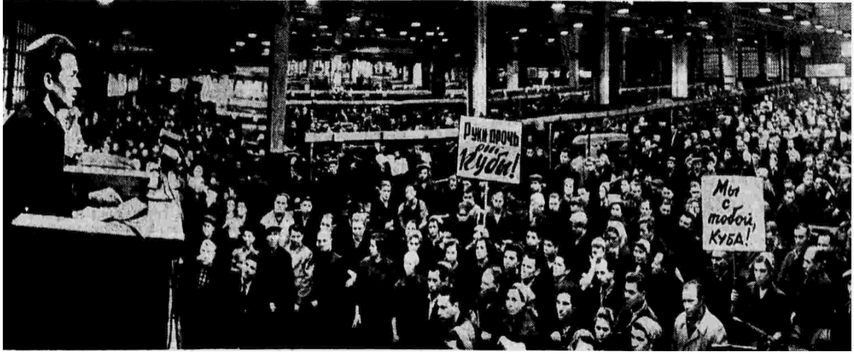
Şekil: 5. Likhachev Moskova Otomobil Fabrikası işçileri, çalışanları, mühendisleri ve teknisyenlerinin 'Küba Halkını Destekleyen' mitingi (Pravda, 1962)

cevap vereceği ve Kennedy'nin meşhur 22 Ekim halka müracaatı anlatılmaktadır. Diğer çok önemli husus ise Küba'da nükleer silahların bulundurulmasına karşı çıkan ABD'ye hak kazandırmasıdır.