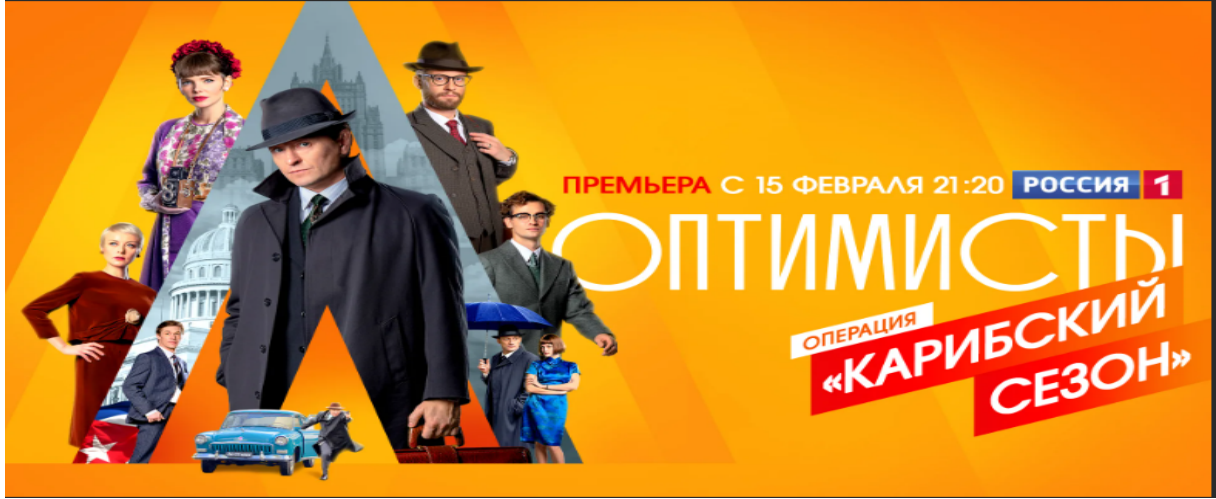
Şekil 3: 'Rosiyya' Devlet Kanalında 'Optimistler- Küba Krizi' İsimli Tarihi Dizi ( https://www.kinopoisk.ru/series/1367857/ , 2019)