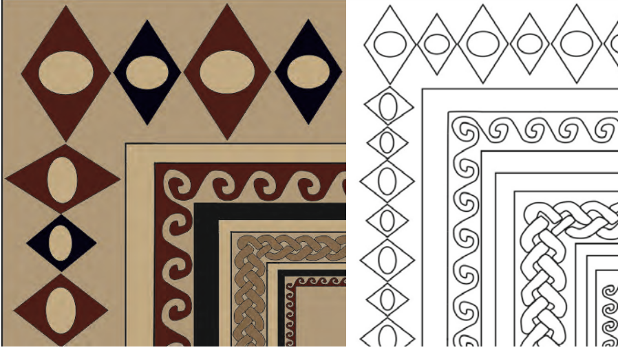
Çiz. 1: Hippokampos Mozađi; Pano.

rastlanılmıřtır (řahin, 2004: 33). Kompozisyon çift sıra kuřakla çevrilmiř, arkasından figürlü zemini çevreleyen dalga bezemesine geçilmiřtir. Bezeme figürlü alan içinde yer alan boyutları farklı, küçük tepelerle toplanmıř perde izlenimi yaratılmıř leke bezemelerle son bulur.