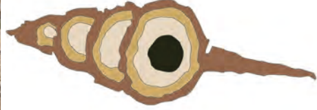
Foto. 5-Çiz. 5 : Hippokampos Mozaïği; Deniz Kabuğu.