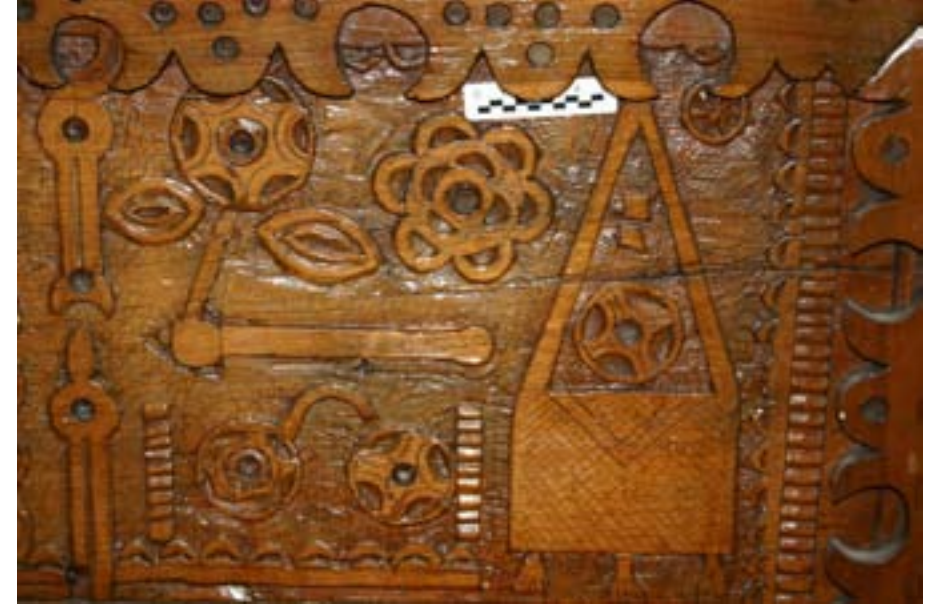
Foto 2: Vaaz Kürsüsünün Batı Yüzünde Kur'an-ı Kerim, Eski Yazı Takımı Hokka Motifi