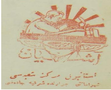
Görsel 3. Aşiyân Mektebi Logosu (2017: 830).

Yine "Yeni Mektep" ideali içerisinde çocuklara resim, musiki dersleri verileceği konusu "Aşiyân Mektepleri"nde de uygulanmışken tahsillerine Avrupa'da devam edeceklerine yönelik bir birim kurulacağı bilgisi de vardır: "Aşiyân Mekteplerinden mezun olanlardan Avrupa'da tahsillerine devam etmek isteyenlerle ilgili özel bir birim kurulacağı belirtilmektedir. Bu birim öğrencilerin ilgi, istek ve kabiliyetlerine göre Avrupa'da hangi okulda eğitim görmeleri konusunda aileleri ile görüşerek en doğru tercihin yapılmasını sağlamayı çalışacaktır" (2017: 833).