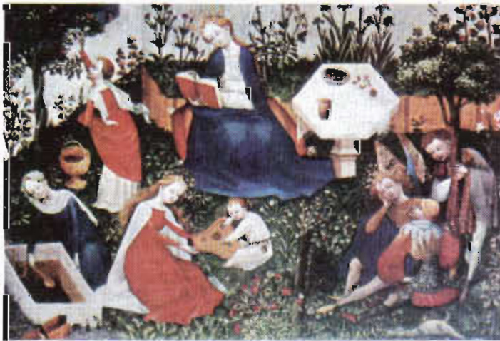
Resim 8. Gothic döneme ait 1420 tarihli bir kır eğlencesi sahnesi.