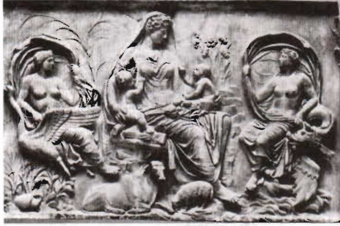
Resim 1. İ.S. Birinci yüzyıl sonlarına doğru toprağın hava ve su ile birlikte gösterildiği Roma'da bir rölyef.