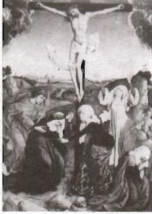
Resim 9. Rogier Van der Weyden'in "İsa'nın Çarmıha Gerilişi" tablosu.