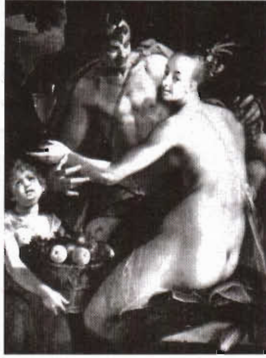
Resim 3. Hans Van Aachen'in Bacchus, Ceres ve Cupid tablosu.