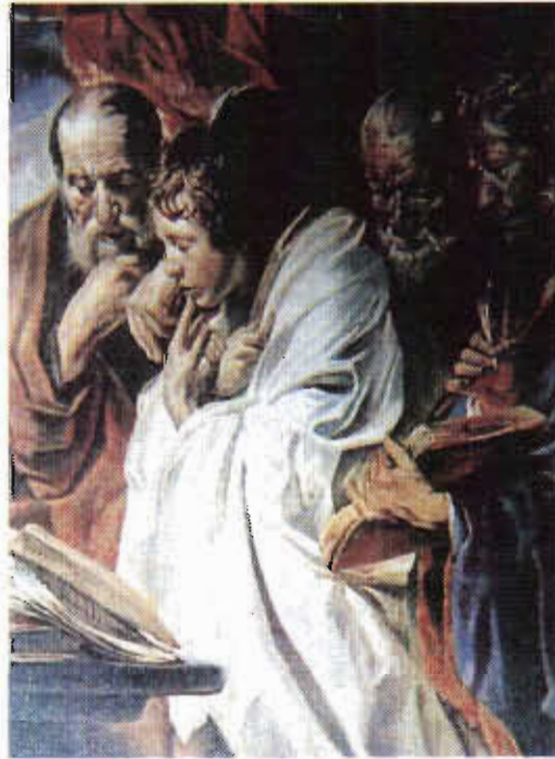
Resim 12. Albert Dürer'in "Dört İncil Yazarı" tablosu.