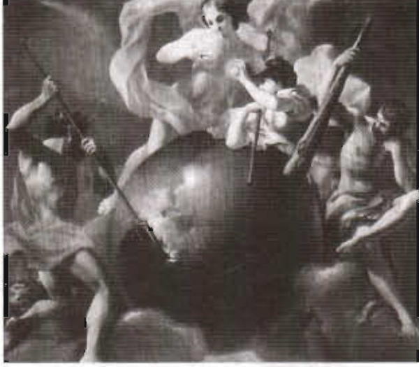
Resim 5. A. Balestra'nın "Toprağın Bolluđu" adlı tablosu.