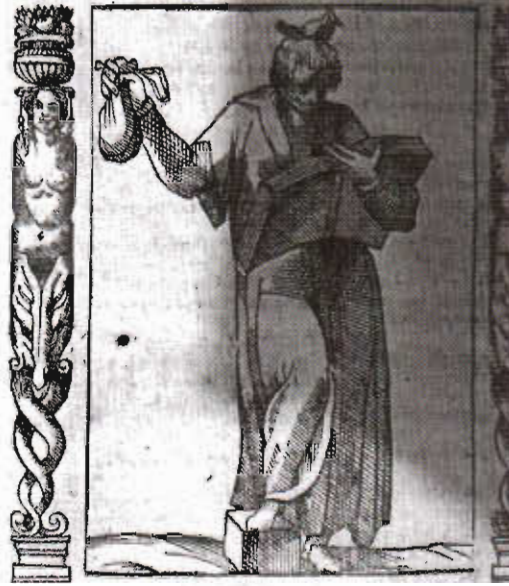
Resim 11. Resim 10'da yer alan toprak atribüsü.