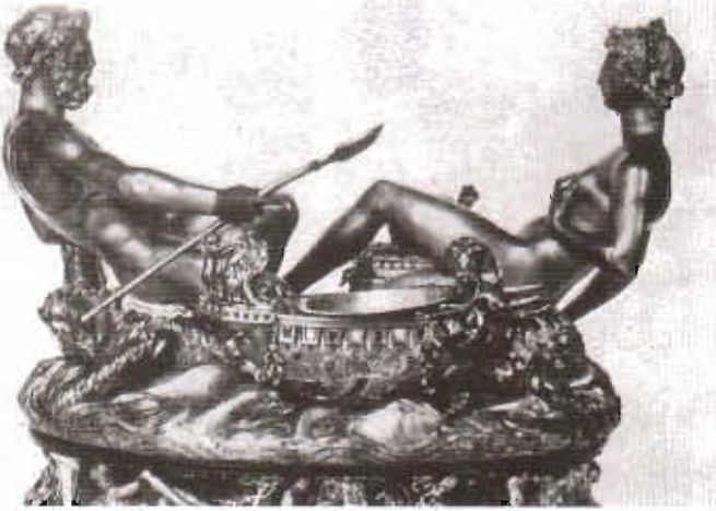
Resim 6. B. Cellini'nin François I'e yaptıđı tuzluk.