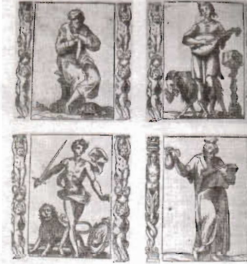
Resim 10. Dört elementin sembolik atribüleri.