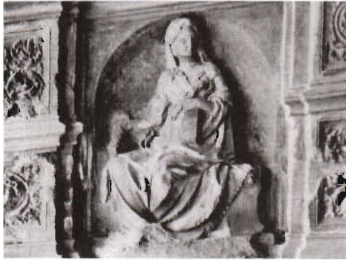
Resim 2. Toprak tanrıçası Gaia'nın Siena'da bulunan bir rölyefi.