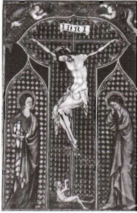
Resim 7. Robert de Lisle'nin 1295 tarihli bir kitap resmi.