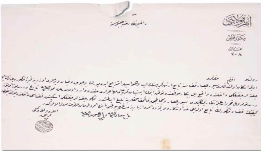
BOA, DH. MKT, N0:1301/2