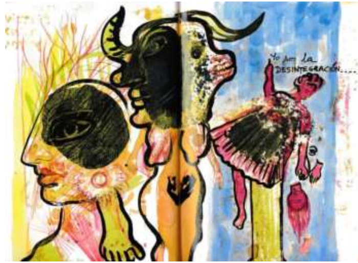
Şekil 3. Frida Kahlo'nun Defteri (Özbay, 2022)

Kolaj ve asamblaj çalışmalarıyla tanınan 21.yy. sanatçılarından Şekil 4'te defterinin görseli verilen, Janice Lowry çocukluğundan itibaren tuttuğu günlükler ile duygu ve düşüncelerini yanı sıra çizimleriyle de sanatsal çalışmalarının alt yapısını oluşturduğu görülmektedir. Sanatçı, defterlerinde yapmayı planladığı listelerini, kişisel düşünce ve tecrübeleri ile döneminin sorunlarına ya da olaylarına da tanıklık ettiği notlarını kaydetmeyi, yaşamı boyunca sürdürmüştür.