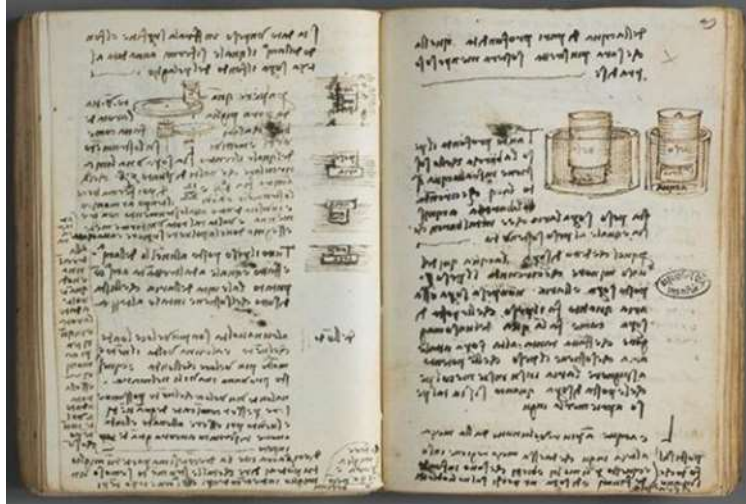
Şekil 1. Leonardo Da Vinci'nin Defteri (Temple, 2012)

Geçmişten günümüze de sanatçıların çalışmalarına eşlik eden, araştırma ve düşüncelerini görsel yolla betimledikleri eskiz defterleri, öneminden hiçbir şey yitirmeden ihtiyaç olmaya devam etmiştir. Hala sanatçıların özgün yapıtlarını ortaya koyabilmek için yoğun gözlem ve zihinsel diyaloglara girdikleri, yaratım süreci boyunca bir dizi taslak ve eskizi defalarca defterlerine çizdikleri, fikirlerini ve projelerini yer yer defter sayfalarına not ettikleri bilinmektedir. Sanatçıların defterleri aracılığıyla, onların hangi yöntemler ile düşünebildiklerini, hangi problemler ile karşılaştıklarını ve bunları nasıl çözümleyip sonuca vardıklarını gösteren pek çok ipucuna bir arada ulaşılması bakımından bu defterlerin, eserlerin yaratım sürecini açıklayıcı önemli kayıtlar içerdiği düşünülmektedir.