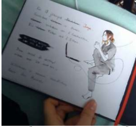
Şekil 9. Öğrenci-B'nin Defteri (Bilici Öztürk, 2022)