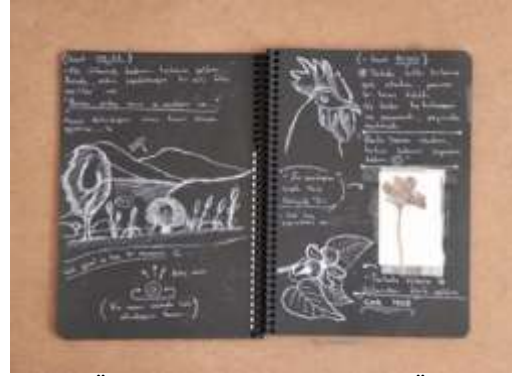
Şekil 6. Öğrenci-A'nın Defteri (Bilici Öztürk, 2022)

Şekil 5 te görüldüğü üzere Öğrenci-A'nın defterinde kendi yaşadığı çevreden, evinden ve kendi yaşamından bahsettiği görülmektedir. Şekil 6 ve Şekil 7 de notlar halinde incelediği korku ve anılarından çıkarımda bulunup Şekil 8 de ise, sanatsal ve estetik düzenlemeye gittiği görülmektedir. Öğrenci A, günlük yazıp çizdiği imgelerden esinlenerek resimsel soyutlamaya giderek duygularını sembollerle resmetmiştir. Bu bakımdan incelendiğinde rutin olarak tutulan yaşam ve sanat defteri, öğrencilerin varolan esin kaynaklarını keşfetmelerini ve sanatsal kavram geliştirebilmelerinde belirleyici öz kaynak görevi üstlenmektedir.