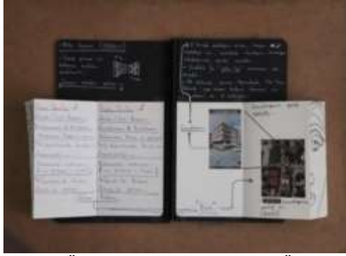
Şekil 5. Öğrenci-A'nın Defteri (Bilici Öztürk, 2022)