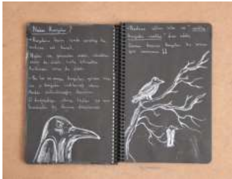
Şekil 7. Öğrenci-A'nın Defteri (Bilici Öztürk, 2022)

Şekil 5 te görüldüğü üzere Öğrenci-A'nın defterinde kendi yaşadığı çevreden, evinden ve kendi yaşamından bahsettiği görülmektedir. Şekil 6 ve Şekil 7 de notlar halinde incelediği korku ve anılarından çıkarımda bulunup Şekil 8 de ise, sanatsal ve estetik düzenlemeye gittiği görülmektedir. Öğrenci A, günlük yazıp çizdiği imgelerden esinlenerek resimsel soyutlamaya giderek duygularını sembollerle resmetmiştir. Bu bakımdan incelendiğinde rutin olarak tutulan yaşam ve sanat defteri, öğrencilerin varolan esin kaynaklarını keşfetmelerini ve sanatsal kavram geliştirebilmelerinde belirleyici öz kaynak görevi üstlenmektedir.