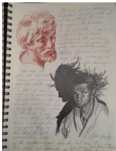
Şekil 12. Öğrenci-C'nin Defteri (Bilici Öztürk, 2022)