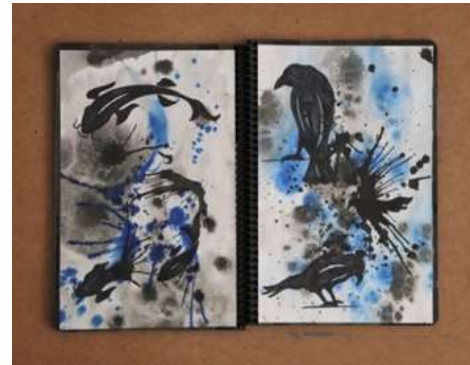
Şekil 8. Öğrenci-A'nın Defteri (Bilici Öztürk, 2022)

Öğrenci B, yaşam ve sanat defterini, Şekil 9 da yaşadığı yeri yanı sıra Şekil 10 'da kendini betimleyen çizimler ile tasarlamıştır. Kullandığı harita ve krokiler ile de defteri kolaj tekniği ile zenginleştiren öğrenci, defterindeki notlarını Almanca olarak kaleme almış zaman zaman sevdiği şarkı sözlerine de defterinde yer verilmiştir. Defterini kendisinden başka kimsenin okumasını istemediği ve yaşadığı duygu ve düşüncelerin okumaya çalışan kişilerce yanlış yorumlanmasından sakındığını dile getirerek defterini kendine özel tutmak istemiştir.