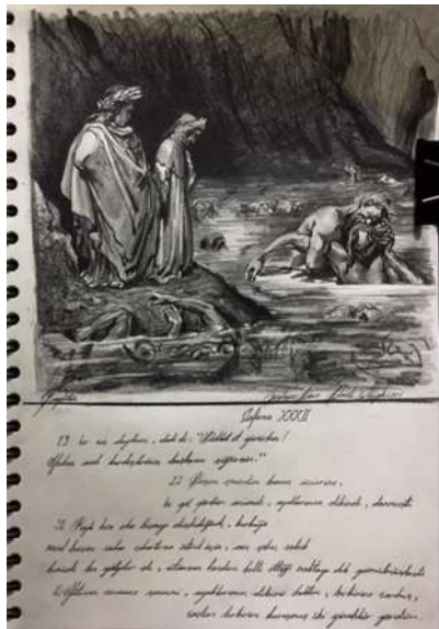
Şekil 11. Öğrenci-C'nin Defteri (Bilici Öztürk, 2022)

Yaşam ve sanat defterlerinin seçilmesinden tasarlanmasına, oluşturulmasından tamamlanmasına kadar süreç, kişinin bireysel farklılık ve ilgilerine göre şekillenmektedir. Bu tercihler ve uyaranlar doğrultusunda ortaya konan ürün de sahibine göre çeşitlilik kazanacağından, öğrencilerin sanat eğitimcileri tarafından tanınmasının ve ayırt edilmesinin kolaylaşacağı tahmin edilmektedir. Her kişinin el yazısı, yeteneği ve sanatsal tavrı defterinin oluşumundaki en büyük belirleyici nokta olacağı için öğrencilerin de ileride yönlendirilebileceği sanat dalları ve meslekler hakkında öğretmene fikir verebileceği düşünülmektedir.