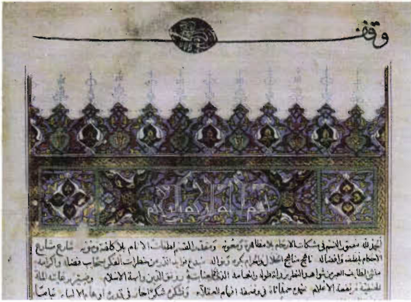
Resim 5. Süleymaniye Kütüphanesi, Şehzade Mehmet Bölümü, No: 28, 1b