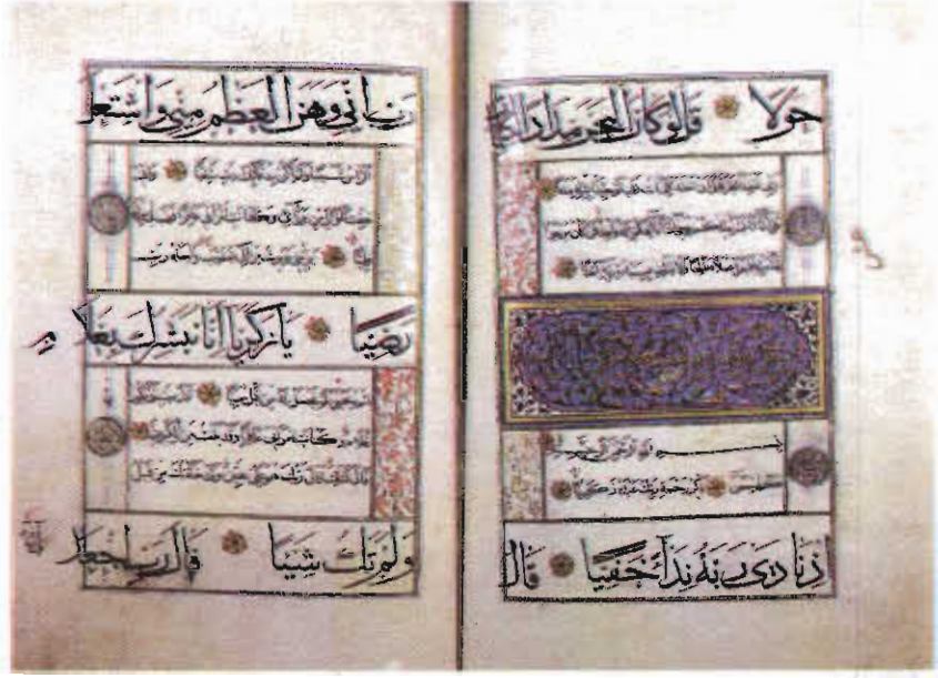
Resim 3. Konya Mevlana Müzesi, Müzelik Eserler Bölümü, No: 18, 273b-274a