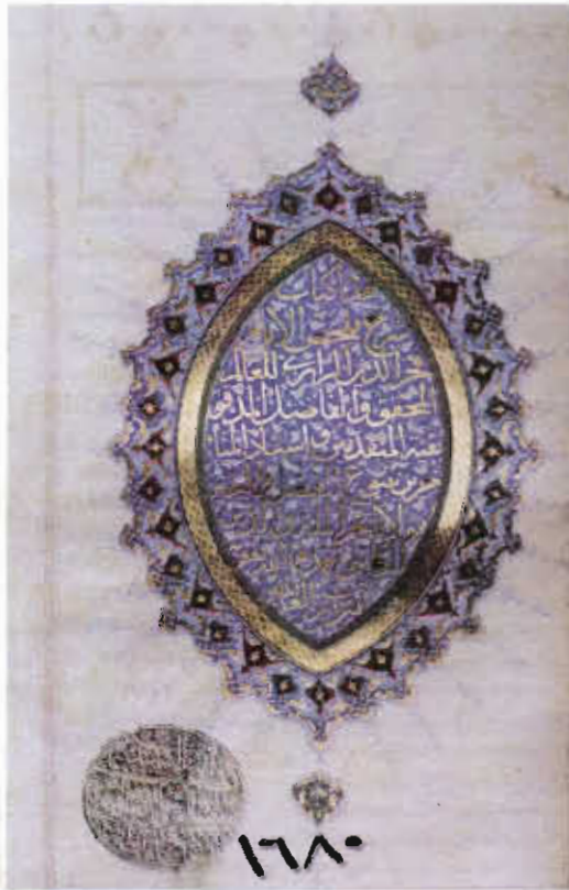
Resim 6. Süleymaniye Kütüphanesi Şehit Ali Paşa Bölümü, No: 1680, 1a