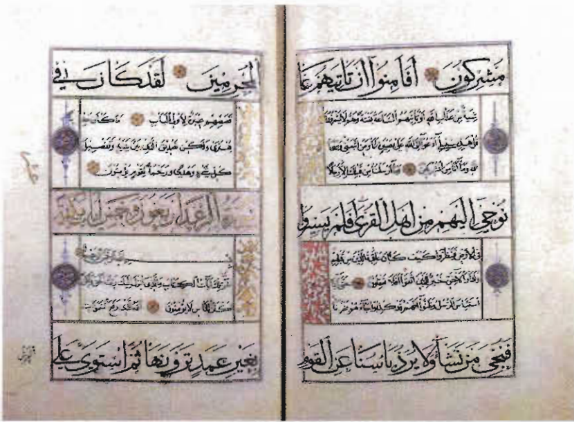
Resim 2. Konya Mevlana Müzesi, Müzelik Eserler Bölümü, No: 18, 222b-223a