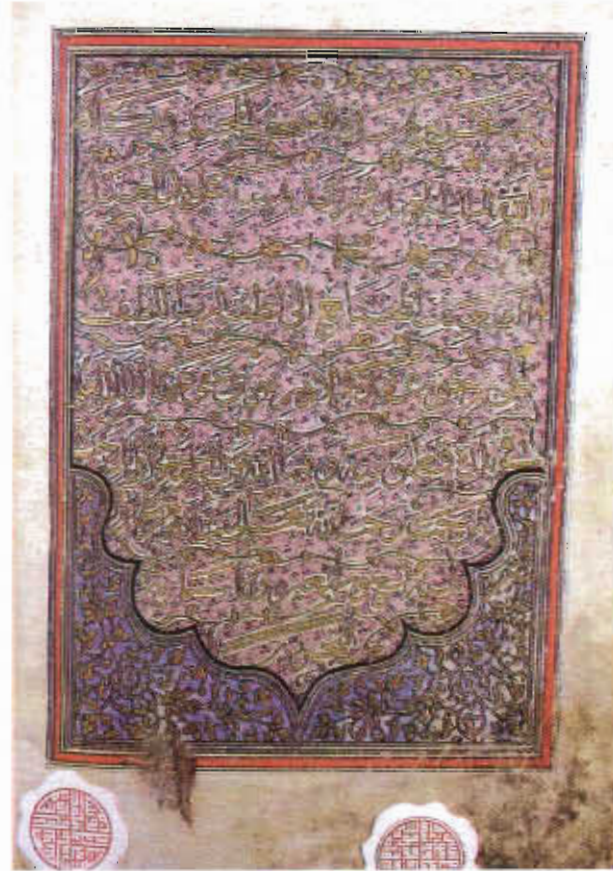
Resim 4. Konya Mevlana Müzesi, Müzelik Eserler Bölümü, No: 18, 538b