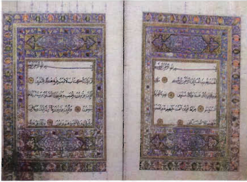
Resim 1. Konya Mevlana Müzesi, Müzelik Eserler Bölümü, No: 18, 1b-2a