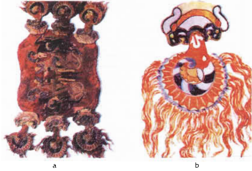
Resim 3. Hun Kurganından çıkmış eğer örtüsü. Pazırık, MÖ V. – III. yüzyıl.