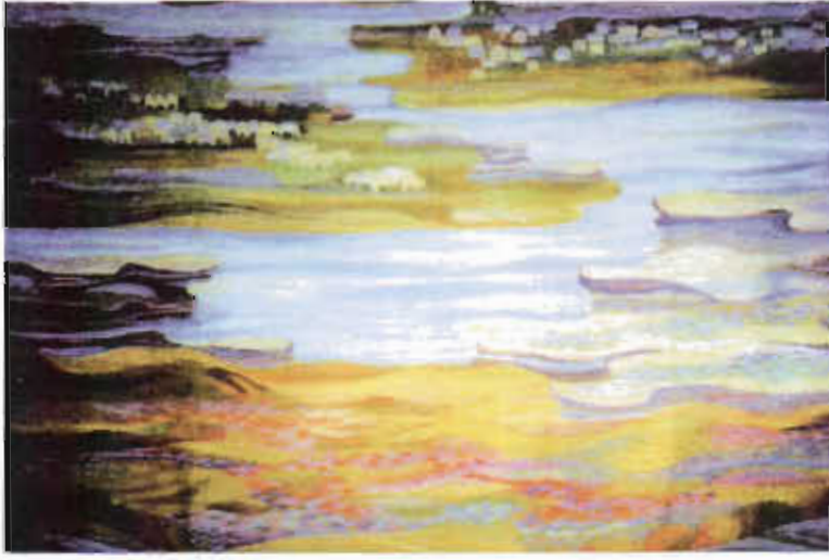
Resim 5. F.Hüseynova. "Güllstan". Yün, 173x229 cm. 1977