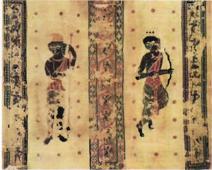
Resim 2. Üzerinde avcı ve savaşçı tasvirleri bulunan tapestry duvar örtüsü. Mısır, V. yüzyıl.

Hun Kurganında bulunmuş kilim parçası. Pazırık, MÖ V. - III. yüzyıl.