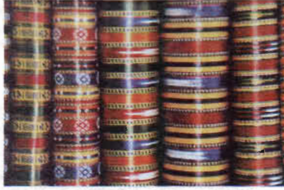
Resim 7. Gaziantep'ten kutnu kumaş örnekleri

Kutnu kumaşlar zamanla ipekten parlak, pamuktan mat çizgiler şeklinde çubuklu olarak dokunmuştur. İpek çizgileri çoğunlukla sarıdır. Zaman zaman renkli olanları da imal edilmiştir. 115 Oluşumlarına göre kutnu kumaşlarının türleri ise; Zincirli Kutnu, Sedefli Kutnu, Danca Kutnu, Kemha Kutnu, Naure (Mecidiye) Kutnu, Demiryolu Kutnu ve Haşhaşlı Kutnu sayılabilir. 116