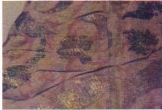
Resim 2. III. Ahmet'in beledi tekniğinde dokunmuş kaftanı (TKSM)

Beledi kumaşlar çift katlı dokumalar grubuna girmekte olup, genellikle geometrik formlardaki desenlerle dokunmaktaydı. Kumaş üzerindeki motifler iki katın kesişmesiyle oluşturulmuştur. Bu kesişmeler aynı zamanda iki katı birbirine bağlar. Katların biri genellikle beyaz ya da krem rengi, diğeri koyu mavi, yeşil, kırmızı ya da sarıdır. Bir yüzde bir tarafta zemin beyaz, motifler renkli; diğeri tarafta zemin renkli, motifler beyazdır. Kumaşın her iki yüzü de kullanılabilir. Belediye kumaşlar günlük yaşamda perde, sedir örtüsü, yorgan, minder, yastık yüzü yapımında kullanılır. Üzerindeki desenlere göre bunların bademli , kutulu , yıldızlı, aynalı gibi adlar almış olanları da vardır. Yaklaşık 40 çerçeveye eskiden dokumalar yapıldığı düşünülüyor. Günümüzde dokunan beledi kumaşlar 24 çerçeveyi aşmaz. 30 Bursa'da dokunanların çözgü ipliği sayısı, 1502 tarihinden önce 1600 adet iken, bu tarihten sonra 1300'e düşer. 31 III. Ahmet'in beledi tekniğinde dokunan ipekli kaftanı, Topkapı Sarayı Müzesi'nde sergilenmektedir (Resim-2).