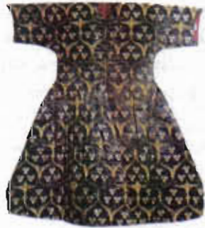
Resim 9. Serenk kumaştan kaftan (TKSM)

Serenk: XV. yüzyılın ikinci yansından itibaren görülen ve ipekle dokunan bu kumaşın motiflerinde sırma ve altın tel yerine sarı ipek kullanılmıştır. Genellikle güvez renk zeminde kendinden desenli süslemeler yer alır. Serenk, üç renkle dokunmuş kumaş anlamına gelir. Çiçekli olanlarına serenk adı verilirken, beneklisine şahbenek , düz olanına ise sade serenk denirdi. 136 Üç renkten fazla dokunanları da olmuştur. Bu kumaş, Osmanlı İmparatorluğu'nun ekonomik durumunun bozulduğu sıralarda altın ve gümüş israfını önlemek için üretilmeye başlanmıştı. Serenk kumaşlar, kemha ve seraserin yerine dokunmuştur (Resim-9). 137