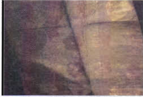
Resim 8. Altın ve gümüş tellerle dokunmuş seraser şalvar (16.yy. TKSM)

renk ipeğe sarılması ile dokunur. En pahalı ve en değerli kumaş olan seraserin çözgüsü ipek olabileceği gibi, atkısı altın alaşımı gümüş veya doğrudan doğruya gümüş ya da altın tel kullanılarak da dokunurdu. Seraser, metal telle, kemha ise kılaptanla dokunurdu. Seraser baştanbaşa anlamına gelir ki bu hem desenin büyüklüğünü, hem de bütün yüzeyde kıymetli tellerin kullanıldığını ifade ederdi. Resim-8 de görülen seraser, XVII. yy.ın güzel örneklerinden biridir. Desen sade fakat kıymetli tellerin görkemiyle dikkati çekmektedir. Seraserden tören ve hilat kaftanları, hediyelik kumaşlar ve yastık yüzü yapılırdı. Bu kumaş, İstanbul'da hükümet kontrolünde, sınırlı sayıda tezgâhlarda fermanlar ışığında dokunmuştur. İstanbul seraseri, düz seraser -I müzehhep gibi çeşitleri vardır. 135