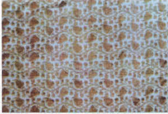
Resim 1. Abani kumaştan kese (19. yy, TKSM)

çok bilinen türleri Akçabeyaz, Palamudl, Halep, Hint abanileri ydi. Kimi zaman düz dokunur, üstü sonradan işlenirdi. Kadın giyimi için kullanılan küçük ve geometrik desenli dokunanları da üretilirdi. 7 Osmanlı'da halk ve tüccarlar, ulema sınıfından ayrılmak için feslerin üzerine abani sarık sarmışlardır. 8 Kese yapımında kullanılmış bir abani kumaş örneği, Topkapı Sarayı müzesinde bulunmaktadır(Resim-1).