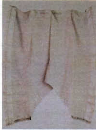
Resim 3. Bürümcük kumaştan diz çakşırı (16.yy. TKSM)

Canfeslerin en kalitelipleri İstanbul ve Bursa'da dokunanlarıydı. Yaklaşık 55-60 cm. eninde dokunan canfeslerden kadın giyiminde elbise, cepken, şalvar, ferace; erkek giyiminde mintan yapılırdı. Ayrıca canfesler yorgan yüzü, bohça vb. eşyaların yapımında da kullanılıyordu. 45 Bunların yanardöner ve kumru göğsü olmak üzere iki türü vardır.