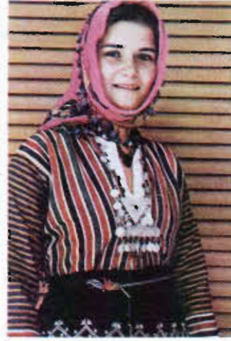
Resim 5. Çubuklu kumaştan elbisesiyle Ege'li Yörük gelini

Çuha: Çözü ve atkısı tek kat yün ipliğinden, genellikle dimi ya da bezayağı örgüyle oldukça sık dokunmuş kalın bir kumaş türüdür. Çuhaya, dokunduktan sonra terbiyelemek amacıyla; dinkleme, fırçalama, makaslama işlemleri uygulanır ve mendenen geçirilerek perdahlanırdı. Çuhanın çözgüsü atkıya oranla daha sıktır.