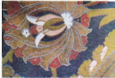
Resim 6. Gülistani kemha kaftandan ayrıntı (16.yy. TKSM)

Kemha: Çatma ve kadifeyle beraber en fazla kullanılan kumaştır. Kemhanın çözüğü ve atkısı ipek, deseni oluşturan takviye atkılar ise gümüş ve altın alaşımli tellerden dokunurdu. Çoğu zaman çözüğü sateni zemin üzerine istenen desenler dokunurdu. Kalın ve sık dokulu bir kumaş olduğu için genelde üst kaftan yapımında kullanılırdı. XV. yy. sonlarına kadar Yezd (İran) ve Frenk (Avrupa) kemhaları sarayda çok kullanılmıştır. Bursa'da dokunan kemhalara dair ilk kayıt 1481-1486 tarihlerinde şehzadelere sancak törenlerinde verilen kumaşlar olarak Kemha-yı Güvezli Bursa, Kemhayı Kırmızı Amasya isimleriyle rastlanır. XVI. yy.da İstanbul'da kemha atölyeleri kurularak üretimin çoğu buraya taşınmıştır. En son olarak 1843'te Hereke fabrikasına ilave edilen kemha dairesi kayıtlarda yer alır. Kemhalar yüzyıllarca Avrupa'da da rağbet görmüş kendine has desen özelliğini korumuştur. 104 En eski kemha Fatih Sultan Mehmet'e ait bir kaftandır. XV-XVI. yy.larda, sekiz çeşit kemha dokunmuştur. Yekrenk, peşuri, müzehhep, dolabi, tâbi, güvez Bursa, kırmızı Amasya, gülistani kemha gibi türleri vardır. 105 Kemhanın bir endeki toplam tel adedi 6000 ile 7000 arasında değişmekteydi. 106 XVI. yy. örneklerinden olan