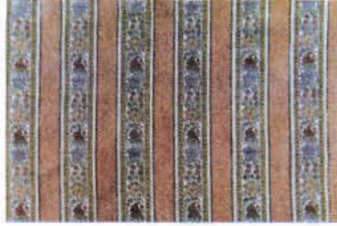
Resim 10. İpekli sevai (19.yy. Yapı Kredi Özel Koleksiyonu)

Sevay: İpek ve kılaptanla dokunmuş bir kumaştır. XVIII. yy. özellikleri taşıyan serpm, bazen de geometrik dizilişe sahip kısa dallı yaprak ve çiçeklerle süslüdür. Genelde kadın elbisesi, şalvar gibi kıyafetlerin yapımında kullanılmıştır. 138 Aynı zamanda Halep ve Şam'da da dokunan sevai, Selimiye kumaşına benzer bir görünüme sahiptir (Resim-10). 139