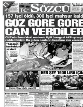
Tepki ve Öfke Söylemi