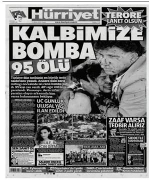
Keder ve Empatik Söylem

Türk medyasında yer alan söylemlerin hangilerinin yoğun kullanıldığını anlatmak bazı gazetelerin birinci sayfalarına ve kullanılan fotoğraf örneklerine yer verilmiştir.