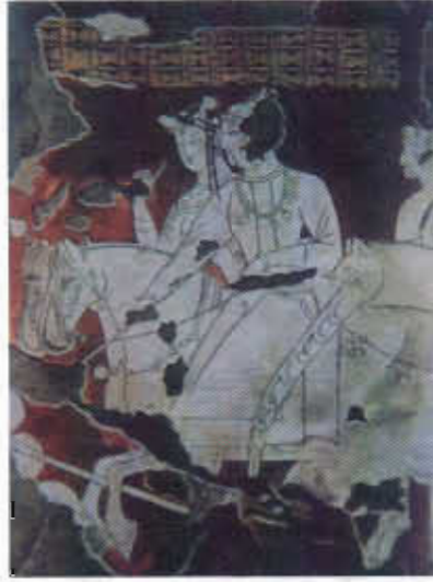
Resim-14: Pencikent'te Türk beyi ve hanımı (T.T.Rice)