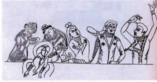
Çizim-4: Göktürk dönemi kaya resimlerinde Yoğ (matem) töreni (E.Esin)