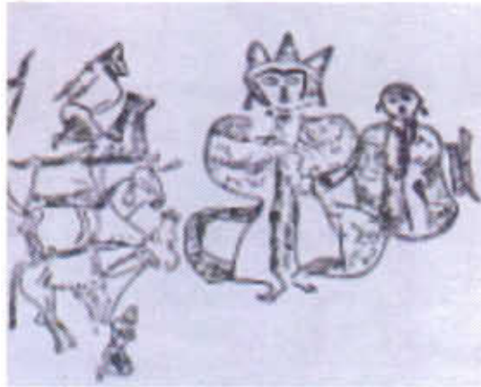
Çizim-3: Kudırge mezarındaki Göktürk dönemi tasvirlerinde Hükümdar ve eşi (E.Esin)