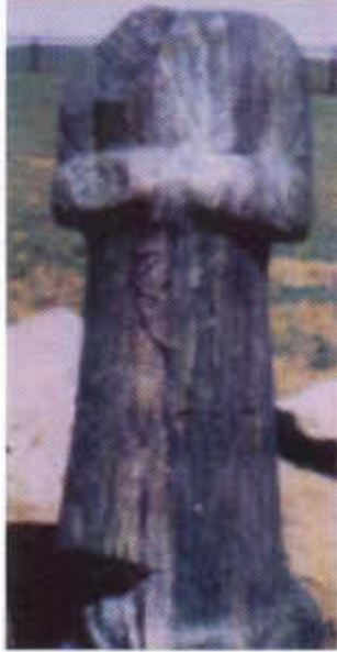
Resim-4: K l Tigin k llyesinde kad n heykeli (O.Sertkaya)