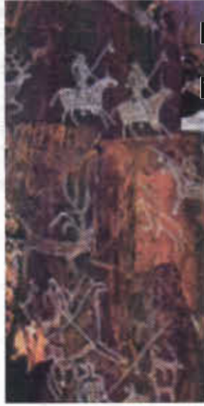
Resim-1: Char Chad'da Göktürk dönemi kaya resimleri (D.Vasiliyev)