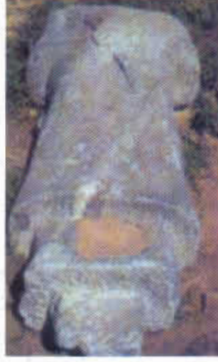
Resim-3: K l Tigin k llyesinde erkek heykeli (O.Sertkaya)