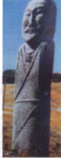
Resim-11: Göktürk döneminden balbal.