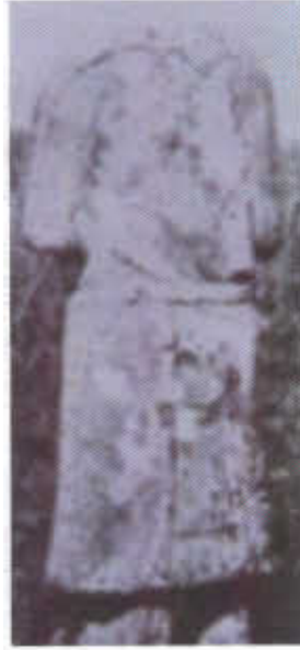
Resim-5/A/B: Kül Tigin külliyesi yakınlarında erkek heykelinin önden (A) ve arkadan (B) görüntüsü (W.Radloff)