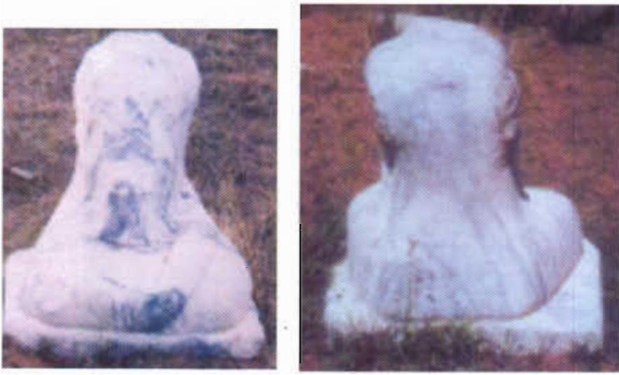
Resim-7/AB: Bilge Kağan'ın eşi