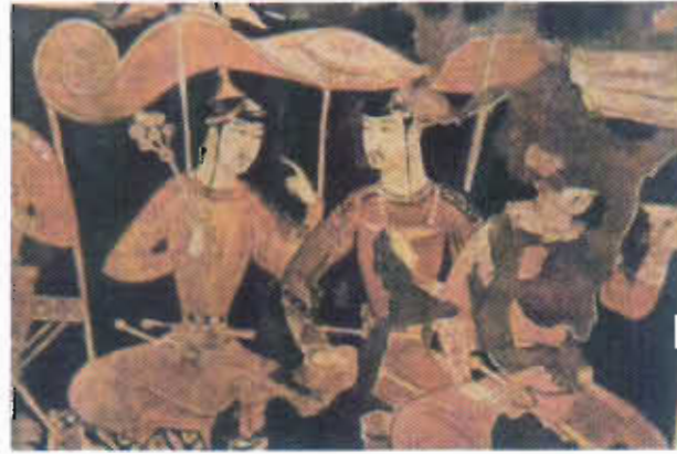
Resim-13: Pencikent'te Göktürk giysili beyler (T.T.Rice)