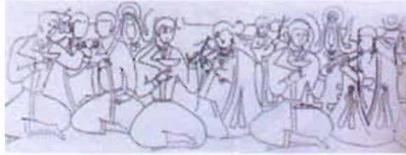
Çizim-8: Balalık-Tepe sarayında Göktürk beyleri (E.Esin)