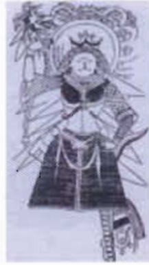
Çizim-5: Kurt başlı bayrağı elinde tutan Göktürk kağanı tasviri (E.Esin)