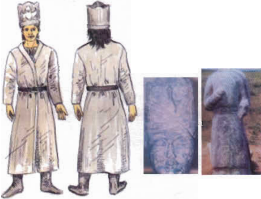
Çizim-1: Kültigin ve Bilge Kağan heykellerinden yararlanılarak çizilmiş Gokturk giysisi (Resim-2 ve 8'den yararlanılmıştır-Çizim: F.Salman)