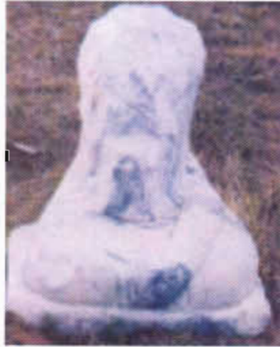
Resim-8: Bilge Kağan'ın kumandanlık heykeli (O.Sertkaya)