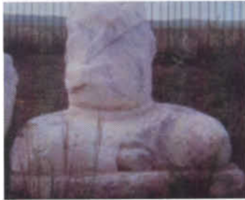
Resim-6: Bilge Kağan'ın heykeli (O.Sertkaya)