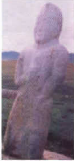
Resim-10: Cagaan Nur'da Göktürk heykeli. (N.Diyarbakırlı)