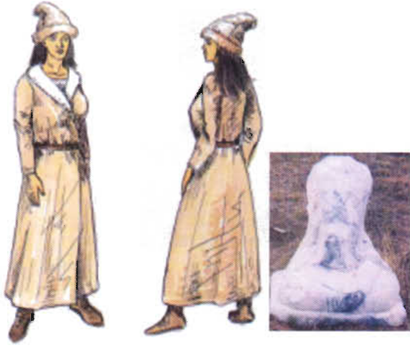
Çizim-2: Bilge Kağanın eşine ait heykelden kadın kıyafeti yorumu (Resim-7'den yararlanılmıştır-Çizim: F.Salman)