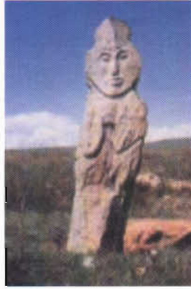
Resim-12: Göktürk mezar külliyelerinde taşbaba.