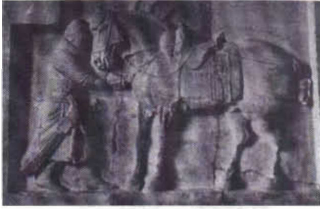
Resim-9: Gök menşeli atıyla bir süvari figürü.