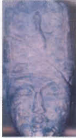
Resim-2: Kül Tigin heykelinin üzerinde çift başlı kartal motifi bulunan büstü (O.Sertkaya)