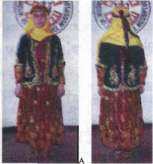
Resim-9/A/B: Mardin yöresi folklor giysisi (Z.B.Erden)

Erkeklerin kullandığı aksesuarlar arasında gümüş zincirli saat (köstek), gümüş saplı hançer ve kamalar, en sık tercih edilen öğelerdir. 34