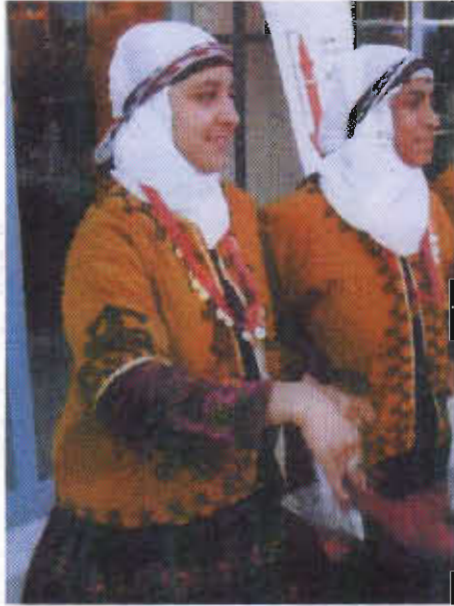
Resim-11. Mardin folklor giysileri.

Benzer tarzdaki bir diğer folklor kıyafetinde beyaz renkli fistan giymiş bir kadın figürü görülmektedir. Fistanın üzerinde baskı yöntemiyle yapılan bitkisel motifler bulunur. Başında koyu yeşil renkli bir hamavi eşarp bağlı olup, onun etrafı yine çember biçiminde siyah renkli bir epri ile çevrelenmiştir. Belinde, üçgen biçiminde katlanarak bağlanmış bir kuşak yer alır. Kuşağa tutturulan kırmızı renkli marhame (mendil) ince tülben tarzındaki bir kumaştan yapılmıştır (Resim-10/A/B). Eprinin uzun kalan uç kısmı, arka tarafta kuşakla birlikte bir düğümle tutturulmuştur. Ayaklarda desenli yün çoraplar ve yemeniler bulunur. Benzer özellikler gösteren çeşitli folklor kıyafetleri de yine Mardin ve yöresinin giyim kültürünü yansıtan özellikler sunar. Bunlardan birinde başında beyaz leçek bulunan ve etrafı epri ile çevrelenen giysiler görülmektedir (Resim-11). Mor renkli desenli fistan giymiş olan kadınların üzerinde, turuncu renkli işlemeli yelekler dikkati çeker. Resim-12'de gördüğümüz folklor kıyafetinde ise baş bağlama yöntemi olarak yine aynı tarzın uygulandığı anlaşılmaktadır. Ancak bu kez epri olarak kırmızı renk tercih edilmiştir. Pembe bir içlik giymiş olan kadının üzerinde üçetek tarzında bir giysi bulunur. Siyah renkli giysinin zemininde, kırmızı renkli desenler vardır. Giysinin ön kenarları belden bir kemerle tutturularak bir araya getirilmiştir. Altta ise sarı renkli bir şalvarı olan kadının ayaklarında, çorap ve yemeniler vardır (Resim-12).