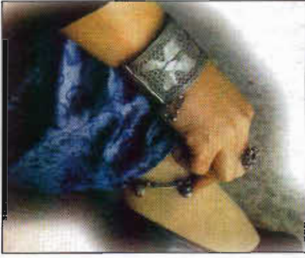
Resim-7: Gümüş bileklik ve balbal.