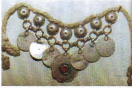
Resim-4: Gümüş Kolye.