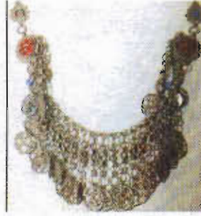
Resim-5: Gümüş Kolye.