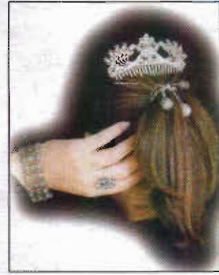
Resim-8: Gümüş tarak ve bileklik.

Amerikan bezi veya buna benzer pamuklu kumaşlardan yapılan iç donu, belden bir uçkurla veya lastikle sarılarak kullanılırdı. Boyu ayak bileklerine kadar uzanan iç donunun paçaları, düğmeli bir manşede son bulurdu. 31 Bugün bu tür iç donlarına rastlamak pek mümkün değildir.