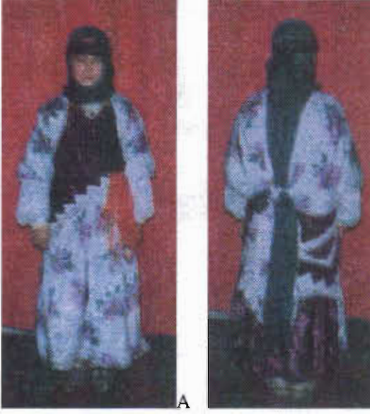
Resim-10/A/B: Mardin yöresi folklor kıyafeti (Z.B.Erden).