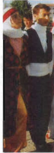
Resim-12. Mardin folklor giysileri.