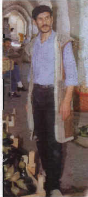
Resim-15: Mardin'e özgü yöresel bir erkek yeleği

Mardin erkeklerinin en çok kullandığı giysilerden biri de önu göğüs hizasına kadar düğmeli olan, boyu ise ayak bileklerine kadar uzanan, genelde de sade renkli olarak kullanılan uzun gömleklere (Resim-14). Özellikle yaz günlerinin sıcak geçtiği Mardin ve civarında bu giysi, şehirlili ya da ova erkekleri tarafından daha fazla tercih edilmektedir. Mardin yöresine özgü bir dokumadan yapılan uzun boylu bir yelek türü de Resim-15'te görülmektedir. Kış günlerinde kullanılan bu yeleklerle beraber, Mardin erkeklerin en çok kullandığı giysi parçalarından biri de başlama sardıkları puşulardır. Kışın soğuktan ve kardan koruyan puşu yazın da sıcaktan ve güneşten koruma görevi taşır (Resim-16).