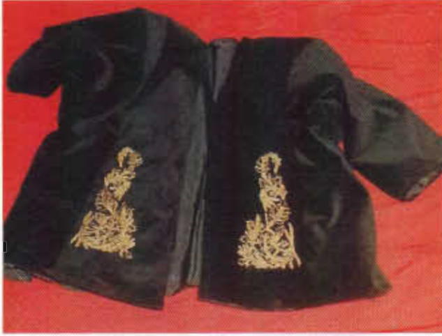
Resim-3. Önleri sırma işlemeli uzun kollu yelek.