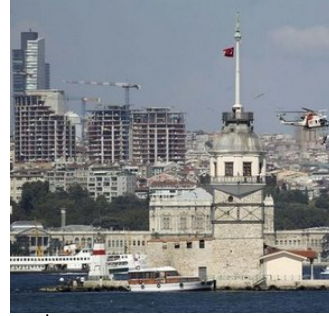
Resim 6. İstanbul'da Siluet Bozan Yapılar -4

İstanbul'da Kentsel dönüşümün uygulandığı sembol yerlerden birisi de Sulukule olarak bilinen Neslişah ve Hatice Sultan mahalleleridir. Neslişah ve Hatice Sultan mahalleleri tarihi yarımada kendine özgü fiziksel ve sosyal yapıları ile kent kimliği açısından önemli bir konuma sahiptir. Mahallenin yer aldığı tarihi yarımada yenilenme ihtiyacını ortaya çıkaran sebepleri, tarihi önemi dolayısı ile korunması gerekli olan; ancak bu özelliklerini kaybetmeye yüz tutmuş, deprem riski barındıran çöküntü ve enkaz alanlarının varlığının yanı sıra, bölgenin sahip olduğu sosyo-ekonomik ve sosyo-kültürel problemler olarak özetlemek mümkündür. 26