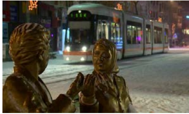
Resim 7. Doktorlar Caddesi.

Kent çeperlerinde yer alan birçok büyük ölçekli sanayi kuruluşuna rağmen 2000'li yılların başlarına değin kent, bir Anadolu Kasabası görünümündeydi. Daha sonraları Üniversite kampüslerindeki estetik ve dinamik sanatsal öğelerin kent merkezine taşınmaya başlamasıyla kent birçok modern heykelle donatılmaya başlandı. Kent yöneticilerinin bir Avrupa kenti prototipi yapmaya kararlı oldukları Eskişehir'de aynı yıllarda, gerekliliği hala tartışılan raylı ulaşım sistemleri kuruldu. Bu sistemin kent içi trafiğin yükünü almaktan ziyade raylı ulaşım nedeniyle yayalaştırılan kent merkezinin insanların istifadesine daha rahat şartlarda sunulmasına sebep olarak olumlu bir etki yaptığı söylenebilir.