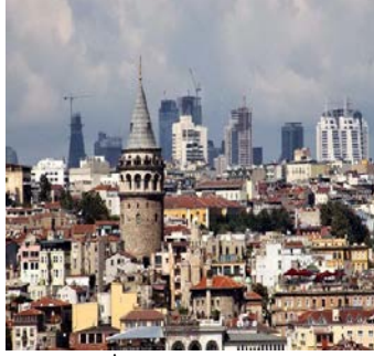
Resim 5. İstanbul'da Siluet Bozan Yapılar-3