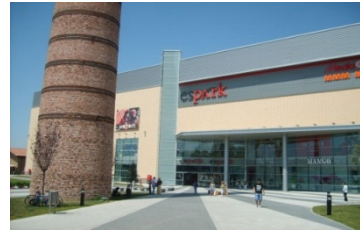
Resim 8. Eski Kiremit Fabrikası ve AVM

Diğer taraftan kentte yaratılmak istenen modernite uğruna kentin doğal kimlik ögesi olan ve kentin içerisinden geçerek kentle birlikte anılan Porsuk Çayı rehabilite edilmiştir. Yeşilden arındırılarak motorlu küçük tekne ve beton duvarların gölgesinde eski romantik havasını kaybeden Porsuk Çayı, akşamları gece kulüplerini andıran parlak ışıkların altında suni bir görünüme bürünmektedir.