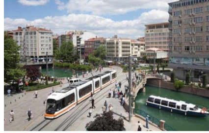
Resim 9. Eskişehir Kent Merkezi

24 saat yaşayan kent imajı yaratmak için kent merkezinde mahalle yaşamının hüküm sürdüğü bir sokak “Barlar Sokağına” dönüştürülmüştür. Birçok işyerinin ve konutun eğlence mekânlarına dönüştürülerek geç saatlere kadar hareketliliğin sağlanmaya çalışıldığı sokak, aynı zamanda geceleri gürültü ve asayiş olaylarının merkezi haline gelmiştir. Gençlerin alkole özendirilip, uyuşturucu kullanımının yaygınlaştığı bu tip mekânlar nedeniyle bazı aileler yıllardır yaşadıkları evleri terk ederek başka semtlere taşınmak zorunda kalmışlardır.