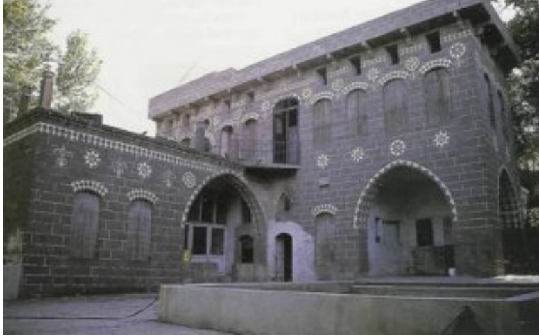
Resim 2. Diyarbakır Kuşdili Köşkü.

Doğal çevre öğelerinden bir diğeri olan iklim de kentin kimliğini doğrudan etkilemektedir. Yaz sıcaklarının rekor düzeylere ulaştığı Güneydoğu illerimizdeki geleneksel avlulu-eyvanlı yapılar o kentlerin kimliğini oluşturan öğelere iyi bir örnektir. Diyarbakır, Şanlıurfa ve Gaziantep; evlerin ve sokakların iklim koşullarına göre şekillendiği, iklime özgü bir mimarinin geliştirildiği illerimizdendir. 21