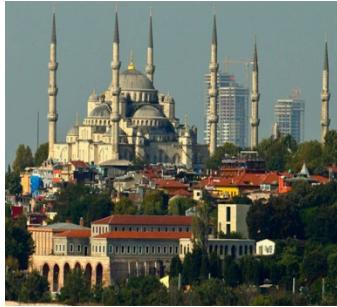
Resim 3. İstanbul'da Silüet Bozan Yapılar-1

Küresel kent olma iddiasında olan İstanbul'da son zamanlarda tarihi kentsel alanların yenilenerek prestijli mekânlar haline getirilmesi ve finans merkezleri yaratmak uğruna ekonomik gücün sembolü gökdelenlerin inşa edilmesi sıkça görülen uygulamalardandır. Bu kentsel dönüşüm uygulamaları İstanbul'un kent kimliğini aşındırmakta ve kentsel sorunlara sebep olmaktadır. Nitekim Sultanahmet ve Ayasofya Camileri minarelerinin arasından Zeytinburnu'nda yapımı süren gökdelenlerin yükselmesiyle gündeme oturan tartışmalar, şimdiye kadar kentsel dönüşüm konusunda pozitif bir tutum sergileyen çevrelerin bile tepkisine sebep olmuştur. Gelen tepkiler üzerine gökdelenlerin silüet bozan ve kentin görsel kimliğine zarar veren katlarının yıkılmasına mahkemece karar verilmiştir.