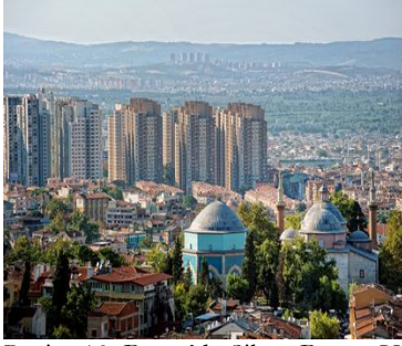
Resim 10. Bursa'da Siluet Bozan Yapılar