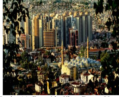
Resim 11. Bursa'da Siluet Bozan Yapılar

Tarihi ve kültürel mirası oldukça yüklü olan Bursa'da yeni ve modern binaların yapılması gereken alanın tarihi yapılarla dolu, kentin silüetini oluşturan eski kent merkezi olamadığı açıktır. Merkezi konumu nedeniyle ekonomik anlamda değerli olan bu alanlarda projeler yapılacaksa bile projeler kapsamında bölgenin dokusuna uygun olarak en fazla 3-4 katlı yüksek tavanlı estetik özellikleri kentin diğer yapıları ile uyumlu binalar yapılmalıdır. Yapılarda kullanılacak malzemelerin de bölgenin tarihi bütünlüğünü bozacak nitelikte olmaması gerekmektedir. Tarihi kentlerde projeler üretilirken tarihi kentsel eserlerinin görünürlüğünün artırılması ve kentin silüetinin belirginleşmesi temel amaç olmalıdır. Bursa'da ise bu amacın tam tersi yönünde uygulamalar hayata geçmiştir. Kentte anıt özelliği olan ve tarihi değeri bulunan yapıların rehabilitasyon, restorasyon ve yeniden canlandırma gibi kentsel dönüşüm uygulamaları ile görünürlüğünün artırılması gerekirken bu kentsel kimlik öğeleri, hemen yanı başlarında yükselen yeni binaların gölgesinde yitip gitmektedir.