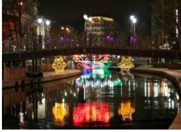
Resim 8. Porsuk Çayı