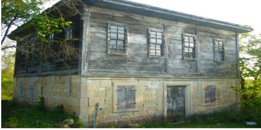
Resim 1. Doğu Karadeniz Bölgesinde yer alan bir Gürcü evi.

Doğal çevre öğelerinden bir diğeri olan iklim de kentin kimliğini doğrudan etkilemektedir. Yaz sıcaklarının rekor düzeylere ulaştığı Güneydoğu illerimizdeki geleneksel avlulu-eyvanlı yapılar o kentlerin kimliğini oluşturan öğelere iyi bir örnektir. Diyarbakır, Şanlıurfa ve Gaziantep; evlerin ve sokakların iklim koşullarına göre şekillendiği, iklime özgü bir mimarinin geliştirildiği illerimizdendir. 21