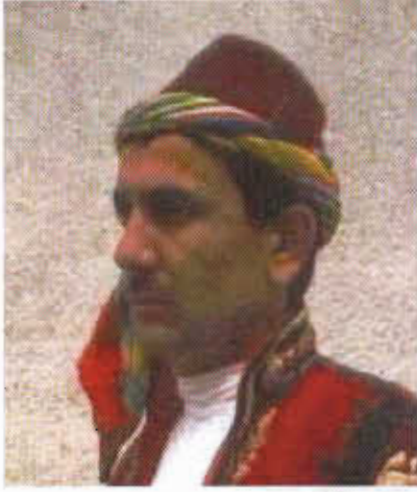
Resim-2A/B: Erkek Fesi ve Poşu.