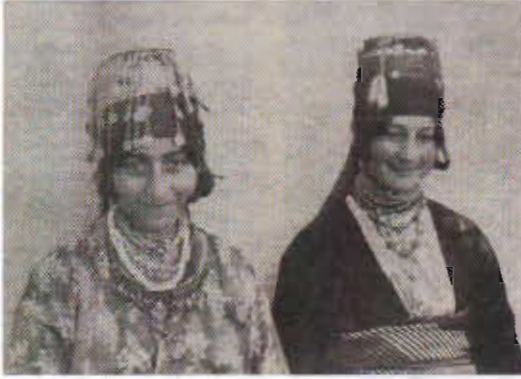
Resim-10: Çorum'un Bayat Köylerinde Kadınların Giydikleri Fesler ve Baş Takıları.