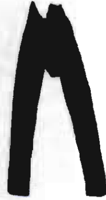
Resim-7: Zıvga Pantolon

2.2.2.2-Zıvga: Kaşe kumaştan yapılır. Arkadan ağ kısmı körüklü olup paçaları dardır. Bele bağlanması için bezek (kaytan) yerleri vardır. Renk olarak siyah ve lacivert renkler sıklıkla kullanılır. 22 Kimi zaman mavi çuha ya da luvi denilen kumaştan yapılır. Beli uçkurla sıkılarak toplanan zıvganın paçası dar, arkası körüklüdür. Körüklü olan zıvgalar arkası körüklü şeklinde tabir edilirken, yıgmalı ve çok körüklü olanına zıvga ifadesi kullanılır. Yanlarda birer ilikli cep bulunur. Paça ağzına, yanlara ve cep ağzına 2 parmak eninde siyah renkli ipek kaytan geçirilerek süslenir. Göynek ve ışık şalvarın içine sokulduktan sonra uçkur bele sıkıca bağlanarak kullanılır. 23