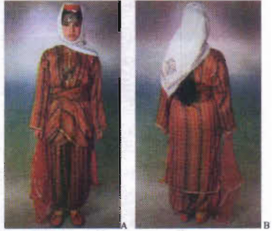
Resim-9A/B: Çorum Yöresi Geleneksel Kadın Kıyafeti.

3.1.2-Çember: El dokuma tezgâhlarında elde dokunan çemberler, dokuma sırasında yapılan motiflerle süslenir. Daha sonra kenarları püskül ve metal pullarla tezyin edilerek süsleme elemanları artırılır. Desensiz olan düz kumaştan yapılmış çemberler de vardır. Bunların özelliği dokularında ipek karıştırılmış olmasındandır. 32 Yazma olarak da adlandırılan çemberler genelde beyaz olmakla birlikte siyah renkli olarak da zaman zaman kullanılmaktadır. Canfes üzerine bağlanarak kullanılır. 33 Başa örtülürken fesin önü açık kalacak şekilde, saçları ise örtecek biçimde kullanılır. Düz örtülerek kullanıldığı gibi üçgen katlandıktan sonra yaşmak yapılarak ta kullanılabilir. Fesin üzerine örtülen örtüler elbiseye göre değişir. İpek kıvrak, oyali krep, çember denilen örtüler daha çok yaşlılar tarafından kullanılır. 34