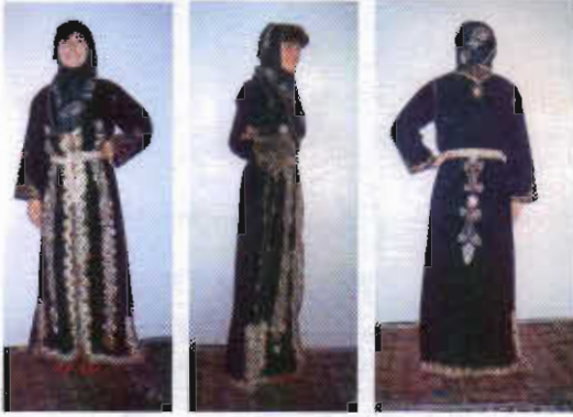
Resim-15: Yakın Zamanda Yapılmış Olan Bindalı Giysi.