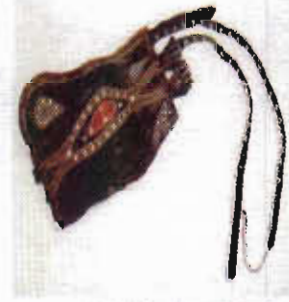
Resim—5: Gayret Kuşağı

2.2.1.6-Gayret Kuşağı: Deriden yapılır ve deri bağlarla belden bir kere döndükten sonra tokalarla bağlanır. Bağların üzeri yuvarlak gümüşlerle süslenmiştir. Ceplerine tütün tabakası, para kesesi, bıçak, tarak, ayna vb. eşyalar konur. En alttaki cebin altı açıktır. Buraya kama, tabanca gibi silahlar takılmaktadır (Resim—5). Gayret kuşağının üzerine sarı simli kaytan ile çift sıra helezonik formlarla dikiş yapılarak süslenir. Yanlara kırmızı deri ile dikiş süsleri yapılır. Bir yanında uzun bağcıklar diğer yanında tokalar vardır. Gayret kuşağı göğüs ile kalça arasında yerleştirdikten sonra, yandaki iki uzun bağcık kuşağın üzerindeki süslerin altından ve üstünden geçirilerek tokalar vasıtasıyla bağlanır. 19