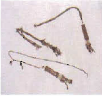
Resim-8: Köstek Zincirleri.

2.4-Takular ve Aksesuarlar: Takı ve aksesuar olarak erkekler gümüş köstekler, meşinden yapılmış silahlıklar kullanırlar. Dört adet zincirden oluşan köstek, ay yıldız motifli kopçası ile sol göğüs üzerine tutturulur. Uçlarında top şeklinde sallantılar olan diğer uç sağ tarafta kuşağın orta kısmına sokulur (Resim-8).