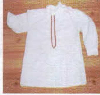
Resim-11: İç Gömleği.

renkler kimyasal boyalar ile yapılmakta olup 39 yakalı ve yakasız olmak üzere iki türü bulunmaktadır. Süslemeleri bakımından ele alındığında ise güzel oyali , kırpık oyali ve sıçandışi oyali olmak üzere üç türüsü görülebilmektedir. 40 Modellerine göre ayrıldığına ise; aynalı, fırçalı, şemsiyeli, karpuz kollu, dört peşli, yakadan büzmeli gibi çeşitleri olduğu görülmektedir. Önünde, karn seviyesine kadar uzanan, uzunca bir yırtmacı vardır. Yırtmaç ve yaka kenarına 2 cm eninde beyaz ipekl kumaştan yapılmış bir şerit geçirilir. Ön kısım 4-5 adet düğme ile kapatılır (Resim-11). 41