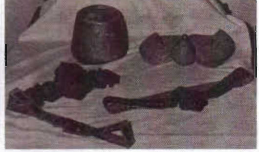
Resim-12: Çorum Müzesi'nde Gümüş Kemer ve Tepelik.

3.3.2-Ayakkabı ve Çizmeler: Yörede özel günlerde geleneksel kıyafetlerin altına deriden yapılmış günümüz ayakkabıları giyilmektedir. Tarlada çalışan kadın ise günlük kıyafetlerinde plastikten yapılmış ayakkabılar kullanılmaktadır. 63 Eski zamanlarda ise mes (mest) ve pabuç olmak üzere iki türlü ayakkabı kullanılmaktaydı. Bu pabuçların derileri yakın çevrede beslenen hayvanların derilerinden imal edilmekte olup, sarı, kırmızı ve siyah renkler en çok tercih edilenleriydi. 64 ERDEN; a.g.e., s. 129. Pabuçların İÇİ ÇUHALI ve İŞLEMELİ (LALELİ) olmak üzere iki türüsü bulunmaktaydı. Köylerde altı kabarıklı (yuvarlak başlı çivili) kunduralar giyilmekteydi. Bu kunduralara katur adı da verilmekteydi. Gençler genellikle çizmeyi tercih ederlerdi. Kötane, ürüzgar, asdarsız, uluorta ve boğazi körüklü gibi çizme türleri olduğu bilinmektedir. 65