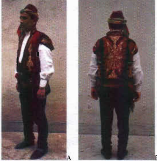
Resim-3A/B: Çorum Yöresi Erkek Kıyafeti Önden ve Arkadan Görünümü

2.2.1.5-Bel Kuşağı: İpek veya yünden yapılır. Zengin olanların kuşağı Gürtün şalı denilen ipeklî bir dokumadan yapılmaktadır. Orta halliler, üç parçalı, üç renkli, uzunluğu da 2—3 m arasında değişen ve Tosya kuşağı olarak adlandırılan yün kuşağı bele sıkıca sararak kullanırlar. 18