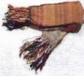
Resim-6: Tosya Kuşağı.

2.2.1.7-Tosya Kuşağı: Zenginler ve memurlar eskiden genellikle şal kuşak kullanırlardı. Normal statüdeki halk ise bellerine, yaklaşık 5 m uzunluğunda kuşaklar sararlardı. Şalvarın beline ipek ve yünden yapılan Gürün şalını zenginler, yünden dokunmuş olan Tosya kuşağını orta halliler kullanırlardı. Ham ipekle ve keçi kılından dokunan Tosya kuşağı, kırmızı-yeşil ve sarı-siyah çizgili olarak iki renkten yapılır. Yaklaşık her biri 30 cm enindeki 2 parça birbirine eklenir. Boyu 2 metre olan şalın uçları saçaklıdır. Kuşak ikiye katlandıktan sonra önden başlamak üzere sola doğru dolanarak sıkıca sarılır. Kuşağın uçlarındaki saçaklar sol taraftan kalça üzerine düşürülür (Resim-6). 20