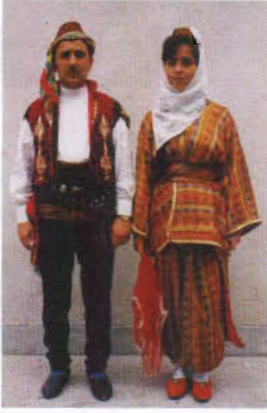
Resim-1: Çorum Geleneksel Erkek ve Kadın Kıyafetleri.

Genel anlamda baktığımız zaman, yöresel kıyafetlerin daha çok yaşlı kesimin elinde olduğu, bu insanların eski kıyafetleri saklamaya özen gösterdiği anlaşılmaktadır. Çorum ve civarında çoğu zaman köylülerin kendilerine ait yöresel kıyafetlerinin olduğu görülmekte ve bu kıyafetleri kendileri dikerek, başkalarına diktirerek, satın alarak, hediye ya da atalarından devralarak temin etmektedirler.