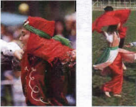
Resim-16: Semah Yapan Kadınların Geleneksel Kadın Kıyafetleri.

Bu giysilerin dışında dini amaçla giyilen kıyafetler de vardır. Bilhassa semah gösterisi yapan alevi vatandaşlarımızın giydikleri kıyafetler yöre açısından bunlara en güzel örneklerdir. Erkekler genellikle hâkim yaka beyaz gömlek ve siyah şalvar giyerlerken, kadınların çok daha renkli kıyafetleri tercih ettiklerini görürüz. Kadınlar beyaz gömlek, üçetek entari ve kırmızı şalvardan oluşan bir kıyafet kullanırlar. Üzerlerine kimi zaman sırma işlemeli kırmızı yelekler giymektedirler. Başlarına taktıkları fesin üzerine kırmızı bir saten eşarp örterler. Bu eşarın etrafına da yeşil renkli bir puşuyu dolandırarak sardıkları görülür. Fesin ön kısmında altın liralık yer alır.